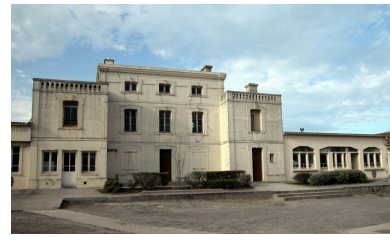
Vue d'ensemble avec une extension latérale.

IVR22_20048001576NUCA