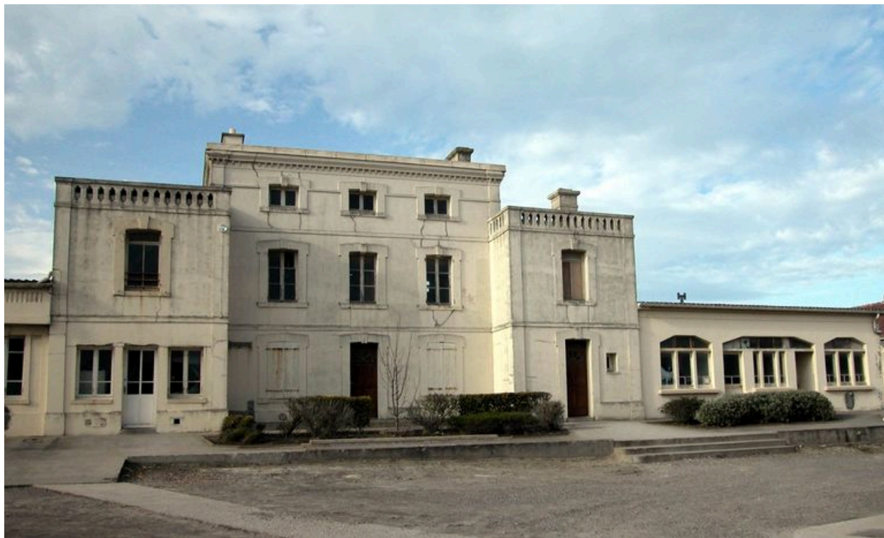
Vue d'ensemble avec une extension latérale.