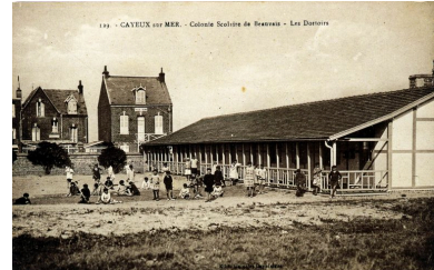
Les dortoirs de la colonie de vacances, carte postale, 1er quart 20e siècle (coll. part.).

Phot. Monnehay-Vulliet Marie-Laure IVR22_20058000479XAB