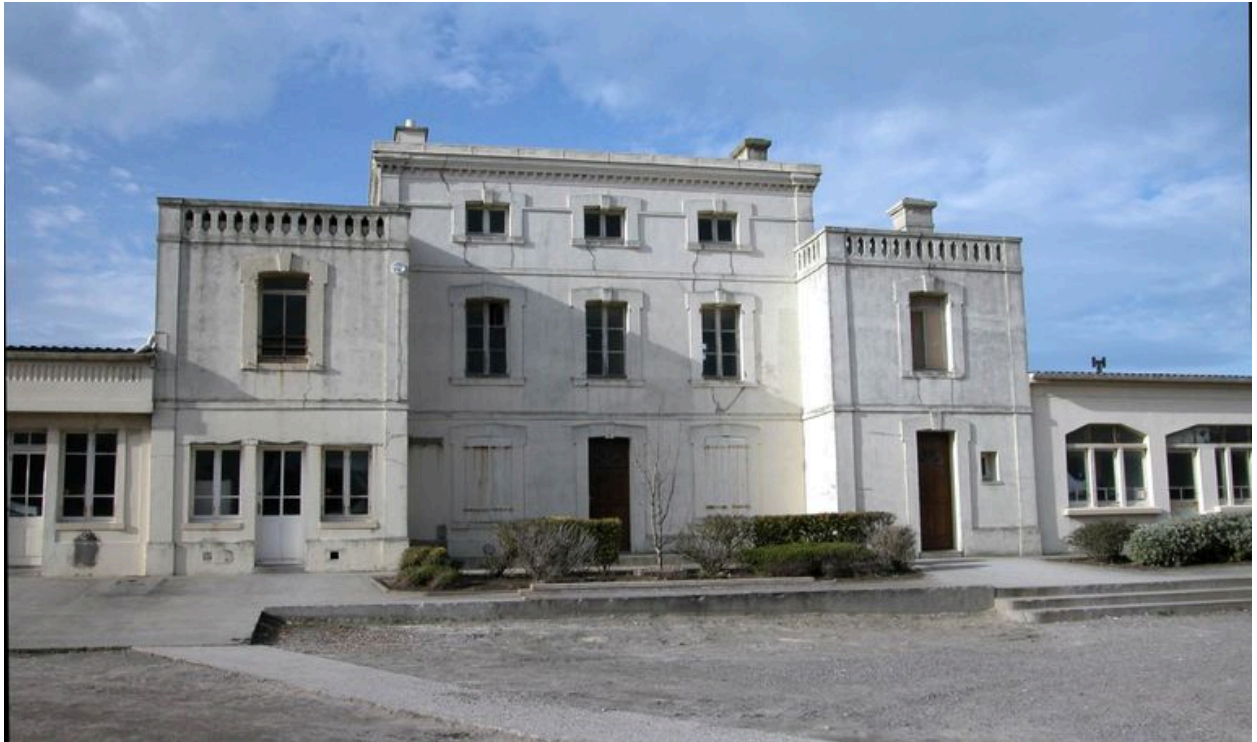
Vue d'ensemble depuis la rue.