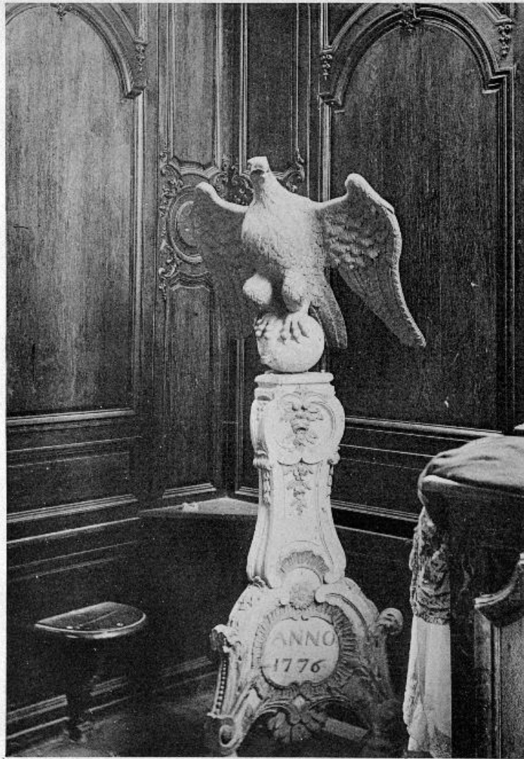
FIG. 290. — DAMPLEUX. Lutrin.

L'aigle-lutrin, photographié par Étienne Moreau-Nélaton en août 1911 (Les Églises de chez nous. Arrondissement de Soissons, t. 1, fig. 290).