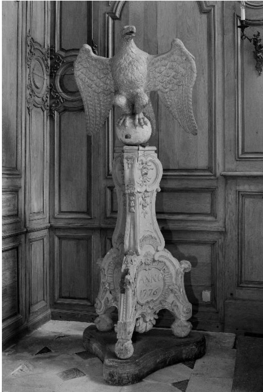
Vue générale du lutrin.