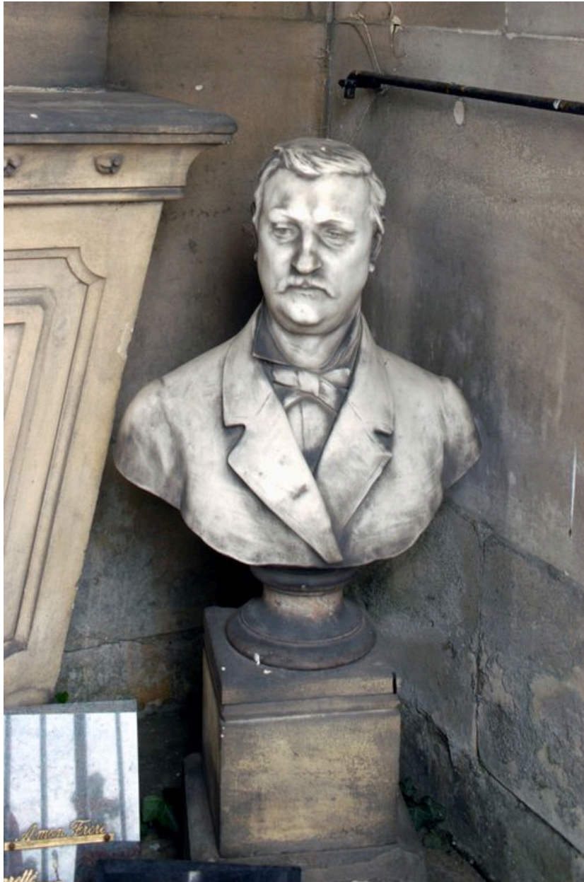
Vue intérieure : buste d'homme.