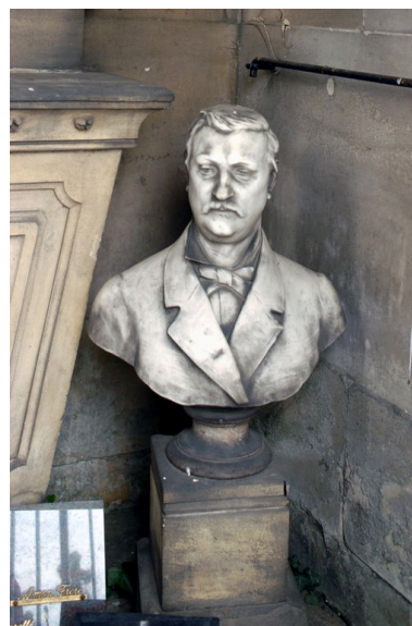
Vue intérieure : buste d'homme. IVR22_20038000810NUCA