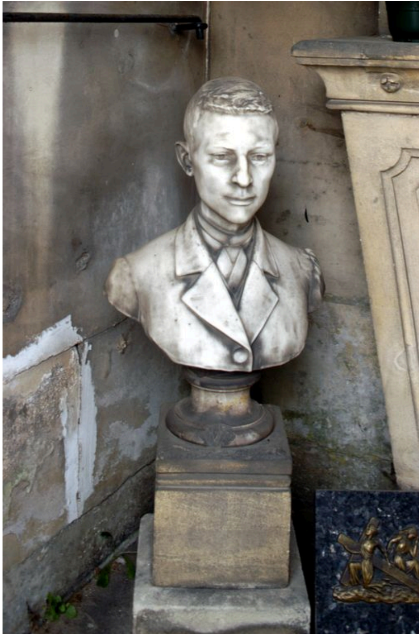
Vue intérieure : buste de jeune homme.