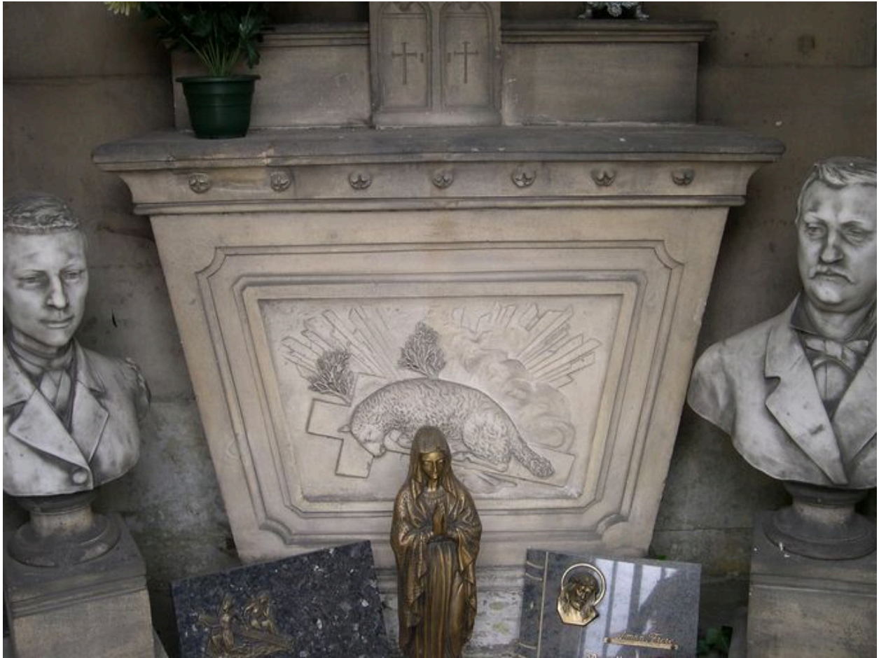
Vue intérieure : autel et bustes d'hommes.