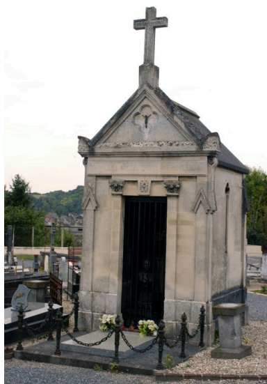
Vue générale. IVR22_20038000811NUCA