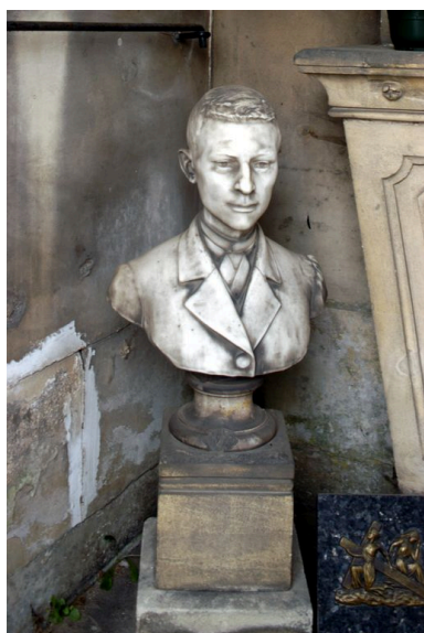
Vue intérieure : buste de jeune homme. IVR22_20038000809NUCA