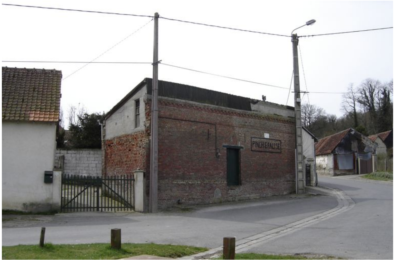
Vue de la grange sur rue.