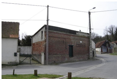
Vue de la grange sur rue.