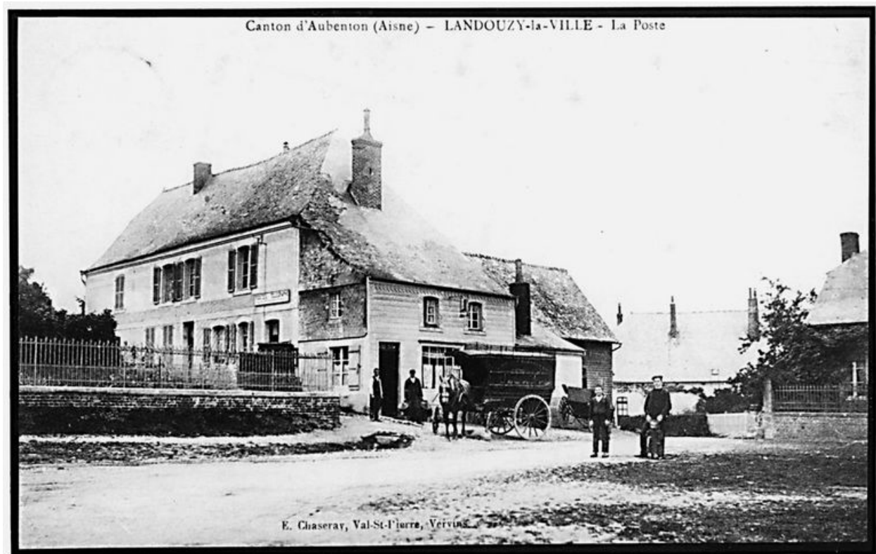
Vue de la maison, alors transformée en relais de poste (AP).