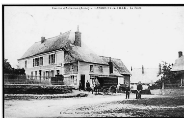
Vue de la maison, alors transformée en relais de poste (AP).