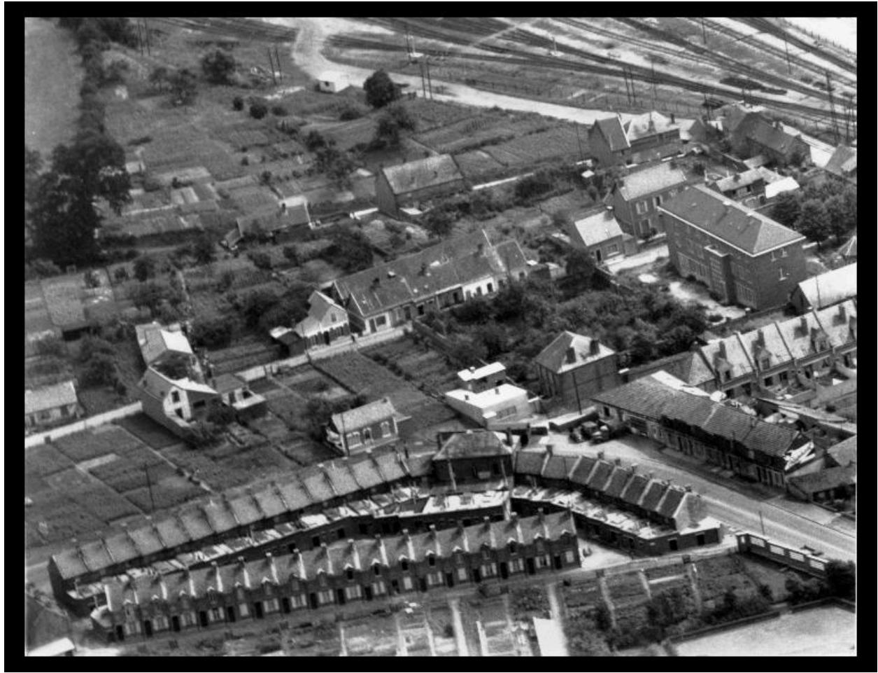
La cité ouvrière. Vue aérienne par Henrard, 1955 (AD Somme ; 3 Fi 127).