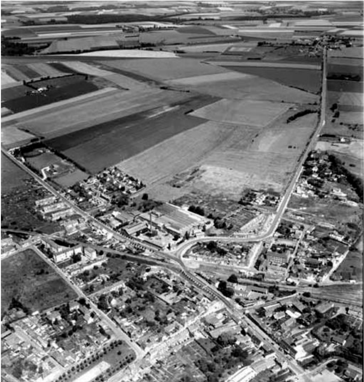
Vue aérienne de la filature et de l'agglomération (nord-ouest).