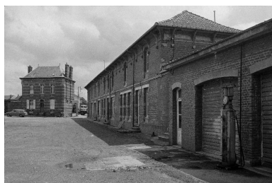
Logement patronal et bureaux, vue du nord-ouest. IVR22_19878000046Z