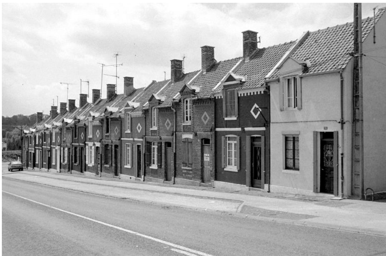
La cité ouvrière, élévation est.