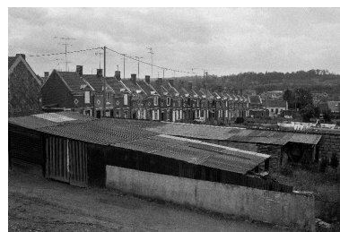
La cité ouvrière (ruelle Rouse), flanc ouest.