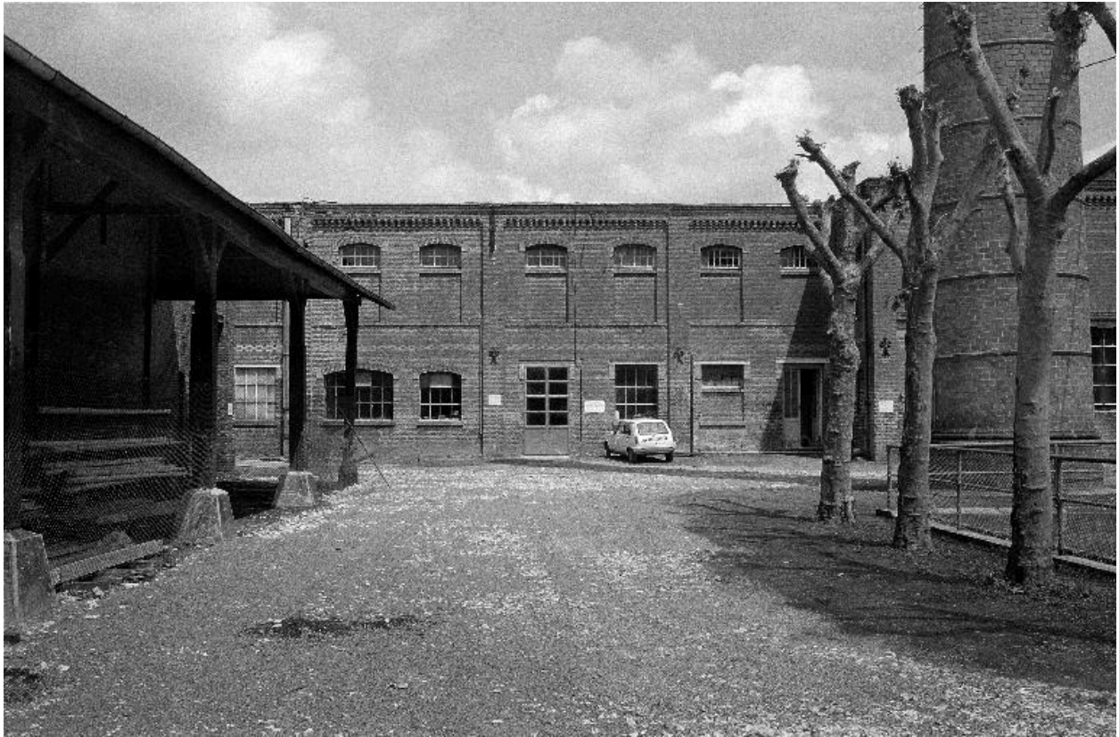
Atelier de fabrication, vue partielle, flanc sud.