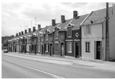
La cité ouvrière, élévation est. IVR22_19878000049Z