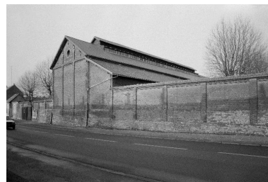
Entrepôt industriel. IVR22_19918000299Z