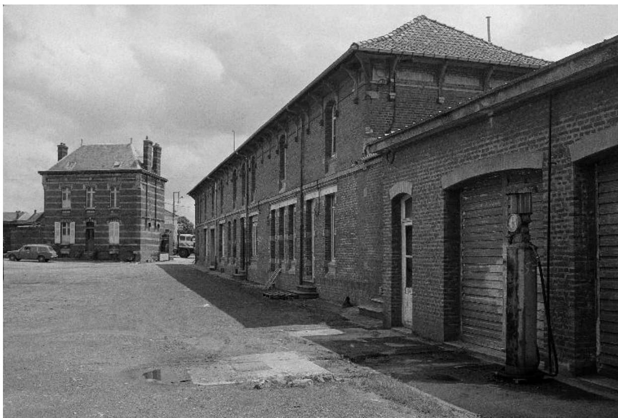
Logement patronal et bureaux, vue du nord-ouest.