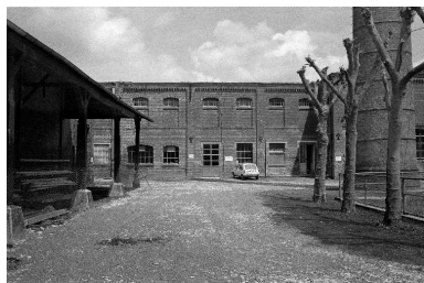
Atelier de fabrication, vue partielle, flanc sud.