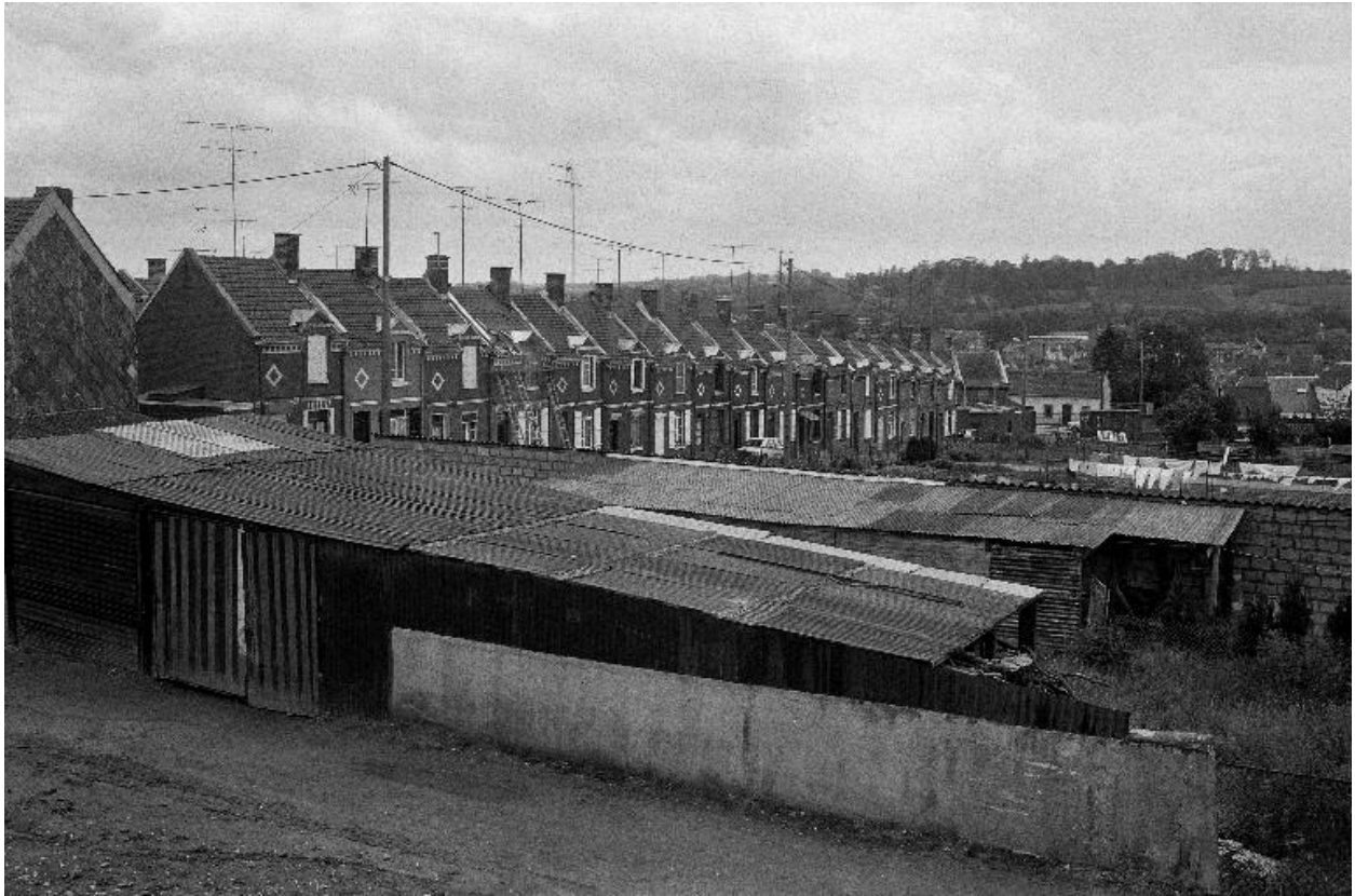
La cité ouvrière (ruelle Rouse), flanc ouest.