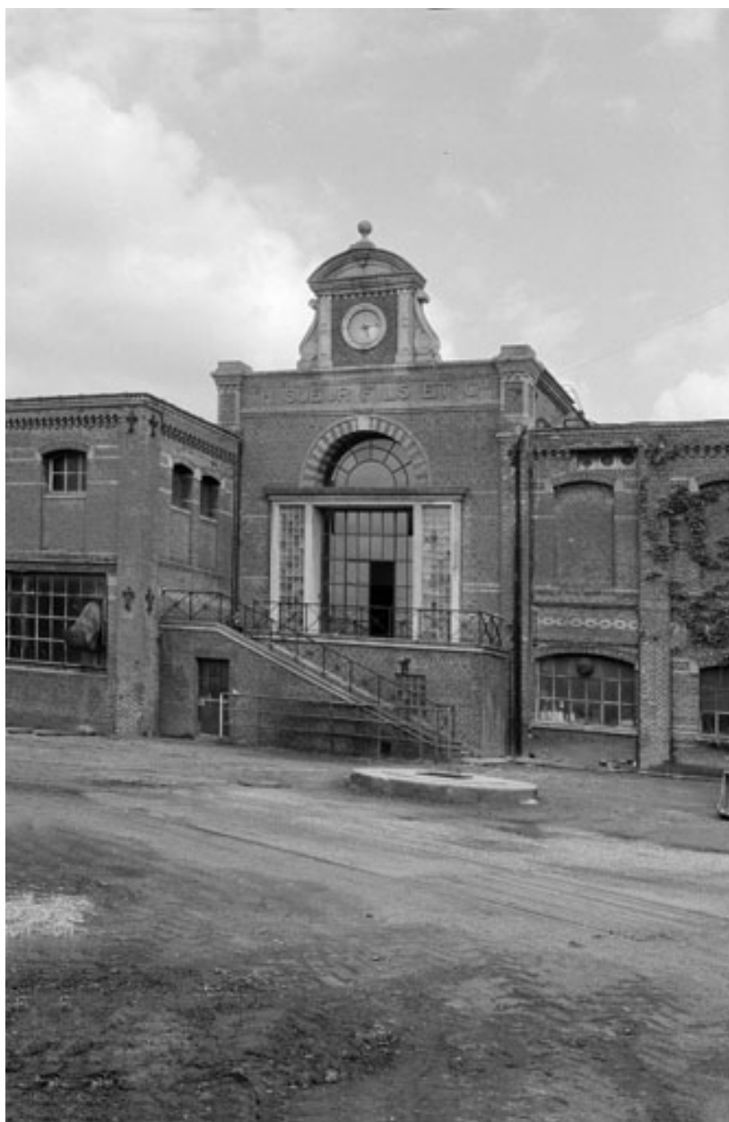
Salle des machines.