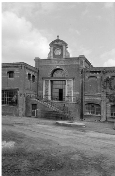
Salle des machines. IVR22_19878000043Z