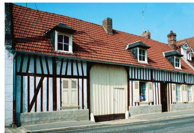
Elévation antérieure, de trois-quarts. IVR22_19856001321ZA