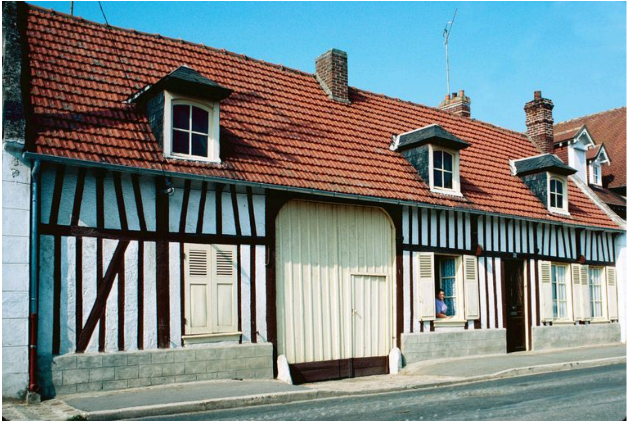
Elévation antérieure, de trois-quarts.