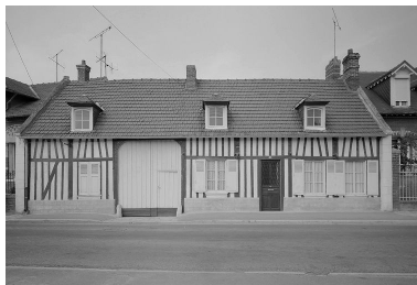
Elévation antérieure. IVR22_19856001413V