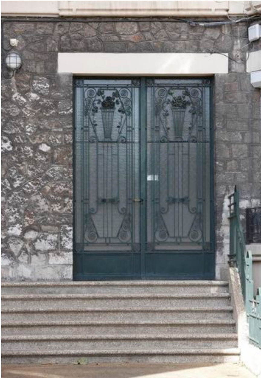
Porte en fer forgé ornée de spirales et de fleurs stylisées.