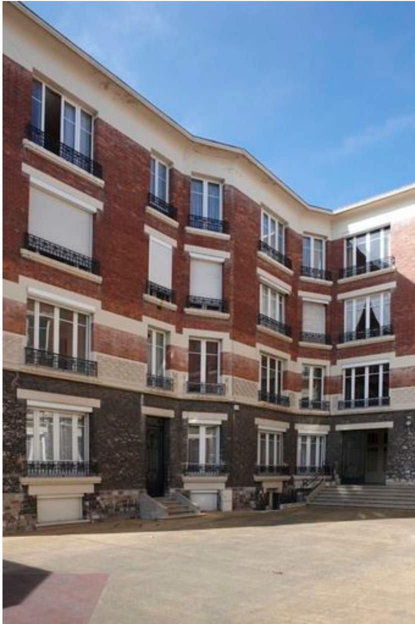
Partie latérale gauche de l'immeuble, à pans coupés.