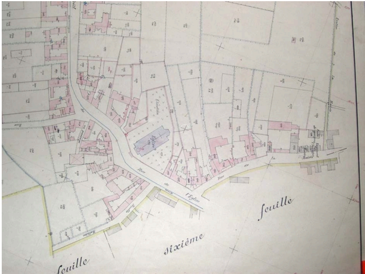
Plan de situation. Cadastre de 1913, 5e feuille, extrait (AD Nord : P31/626).