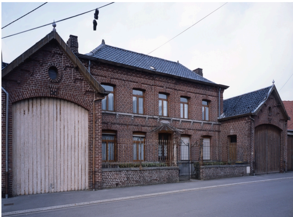
Maison de maître, 33 rue Alexandre-Dubois.