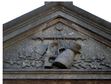
Vue sur le décor sculpté du fronton (emblème de profession).