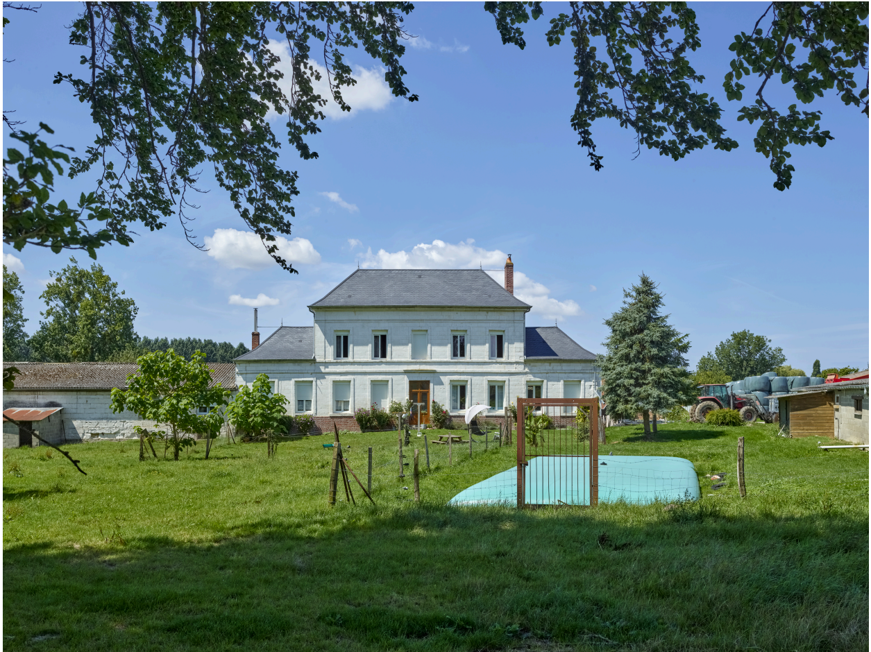
Vue de la maison de la ferme, depuis l'est.