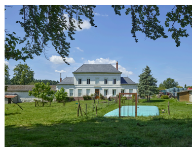
Vue de la maison de la ferme, depuis l'est.