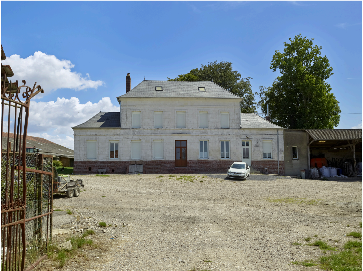
Vue de la maison de la ferme, depuis l'ouest.