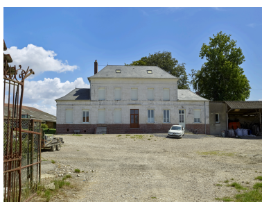
Vue de la maison de la ferme, depuis l'ouest.