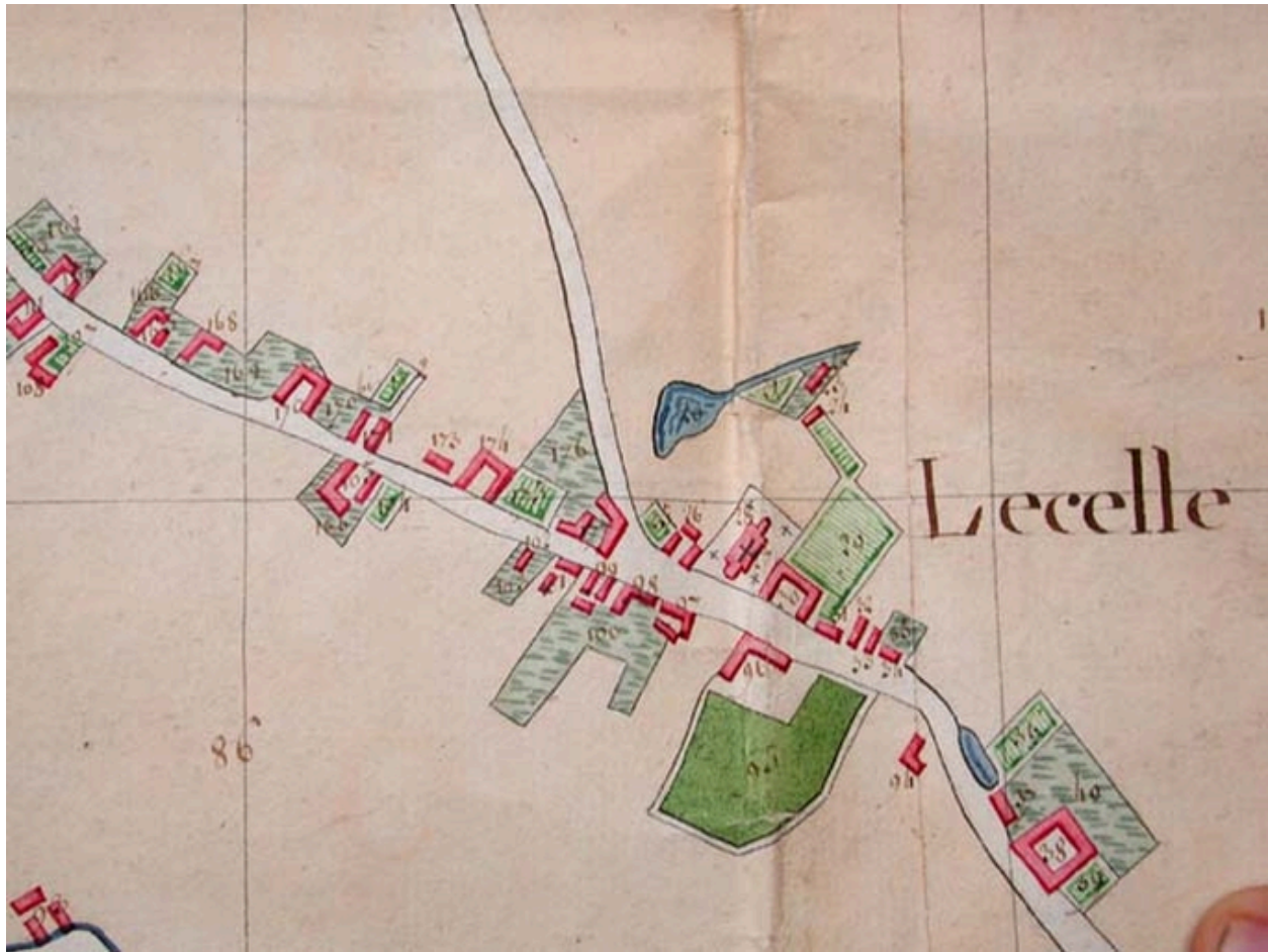
Cadastre de 1805, le centre autour de l'église et le presbytère (AD Nord P30/192).