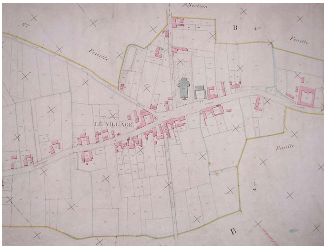
Plan de situation, cadastre de 1885 (AD Nord P31/598).