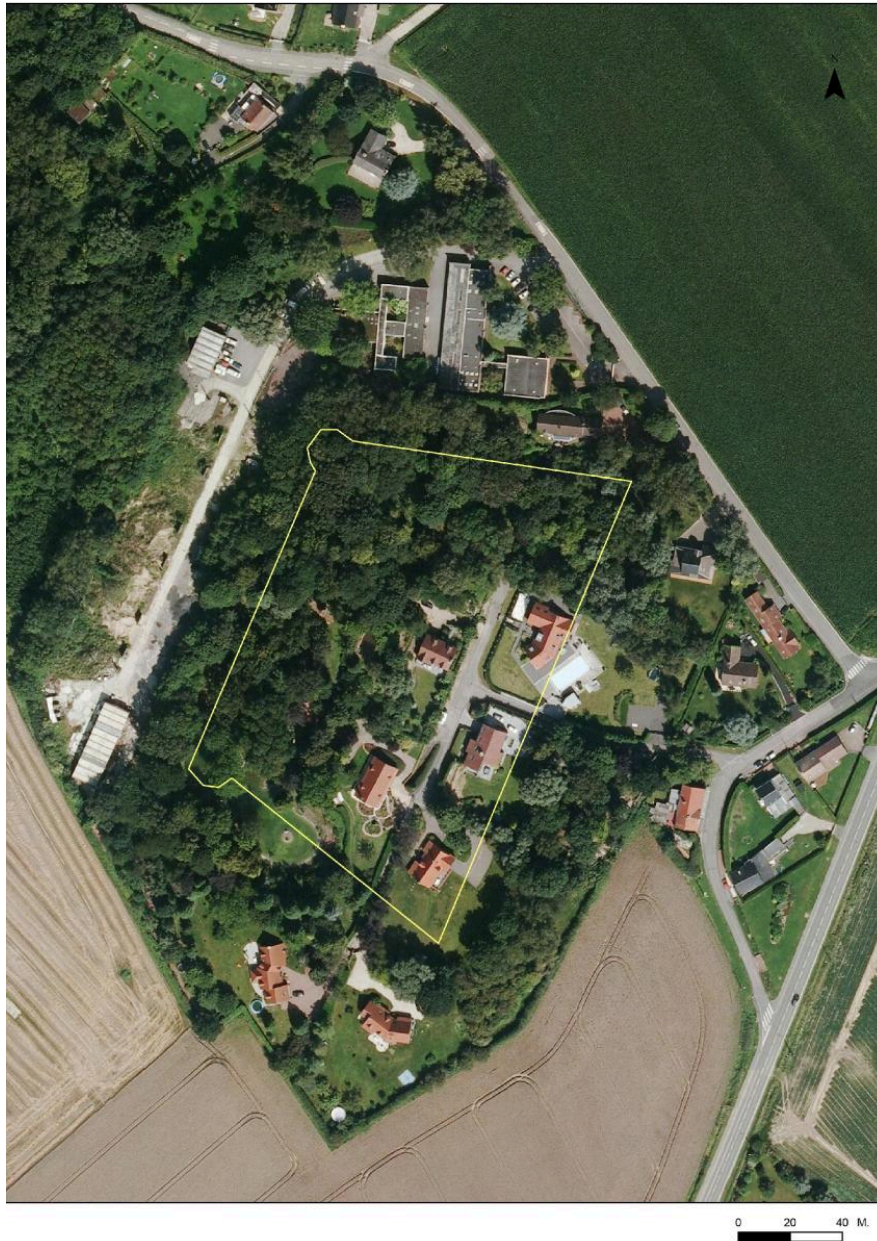
Emprise du fort sur une photographie aérienne de 2015 (Source IGN. Photothèque nationale).