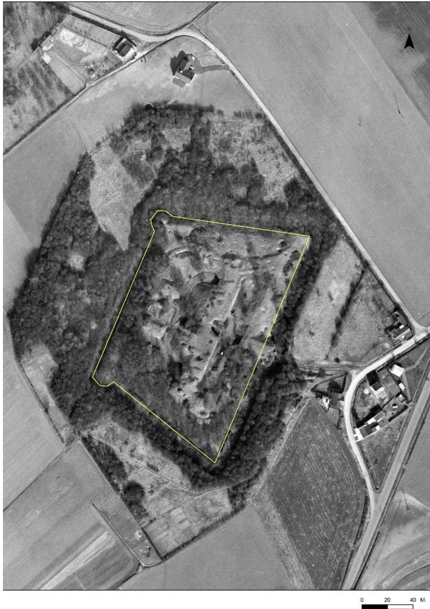
Emprise du fort sur une photographie aérienne du 13 mars 1965.