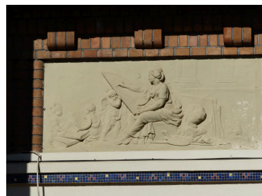
Bas-relief.