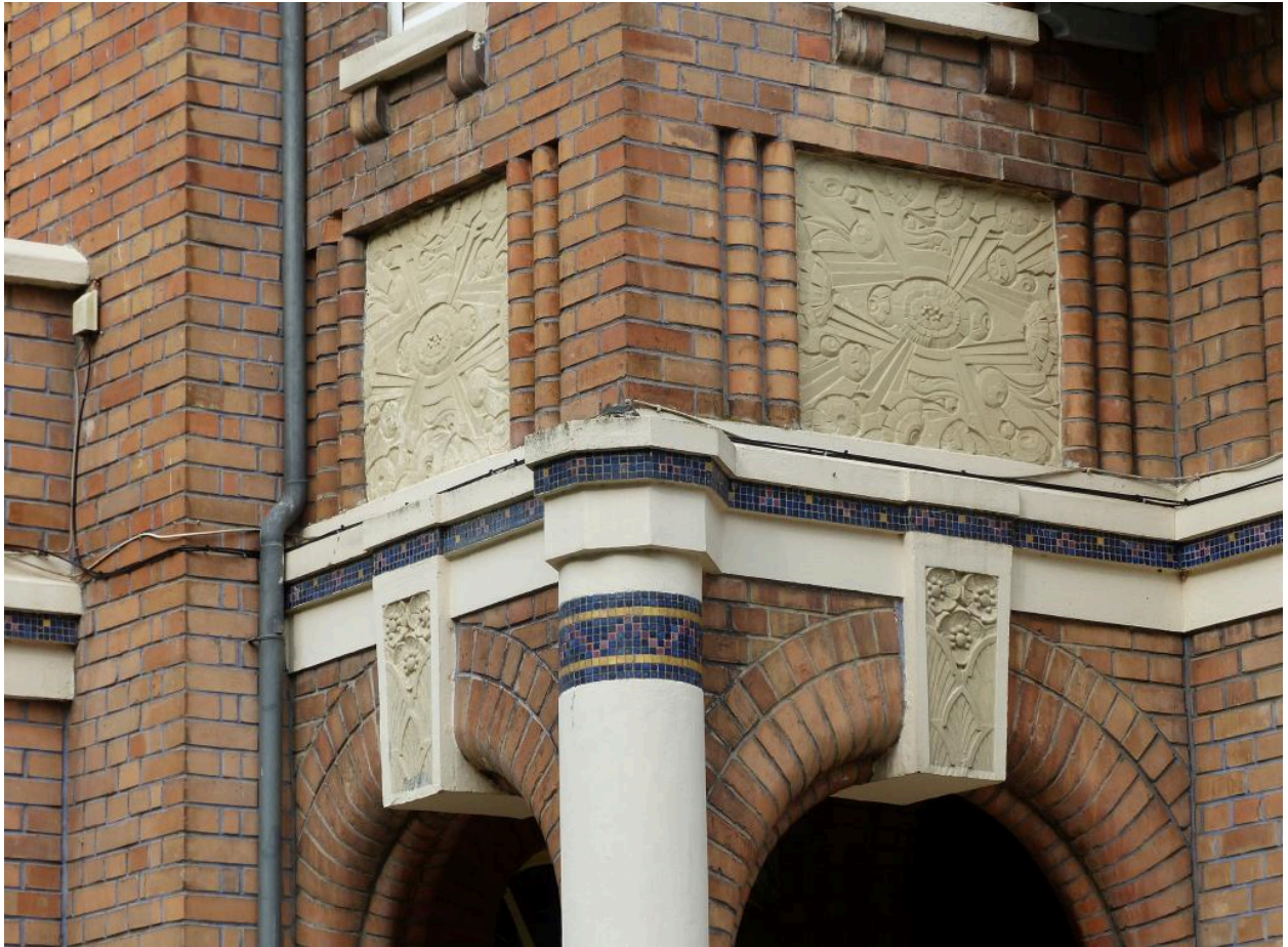
Vue du décor.