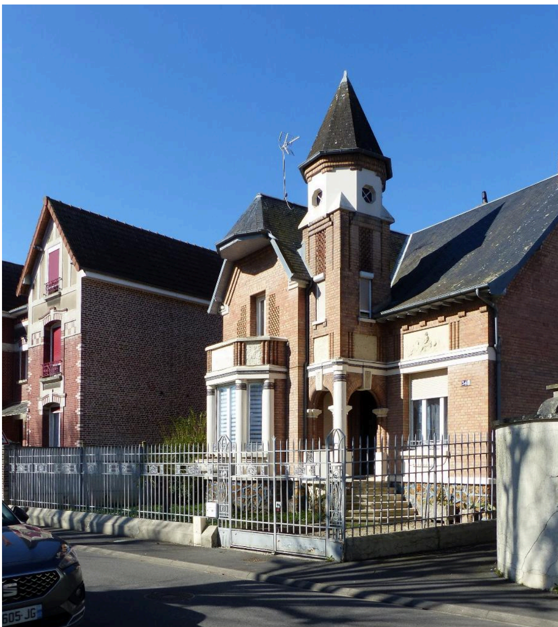
Vue de situation.