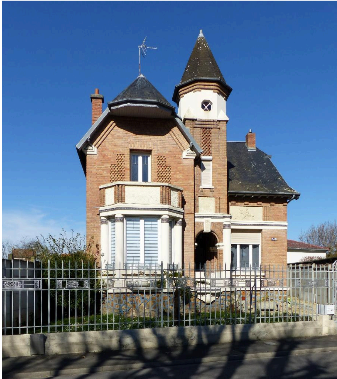
Vue de la façade sud.