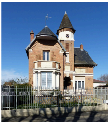
Vue de la façade sud. IVR32_20220205080NUCA