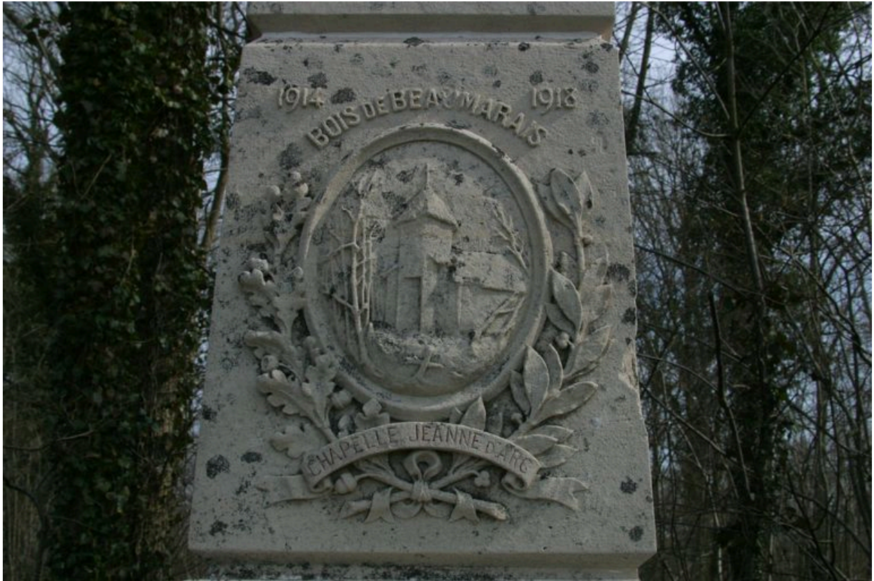
Détail du blason.