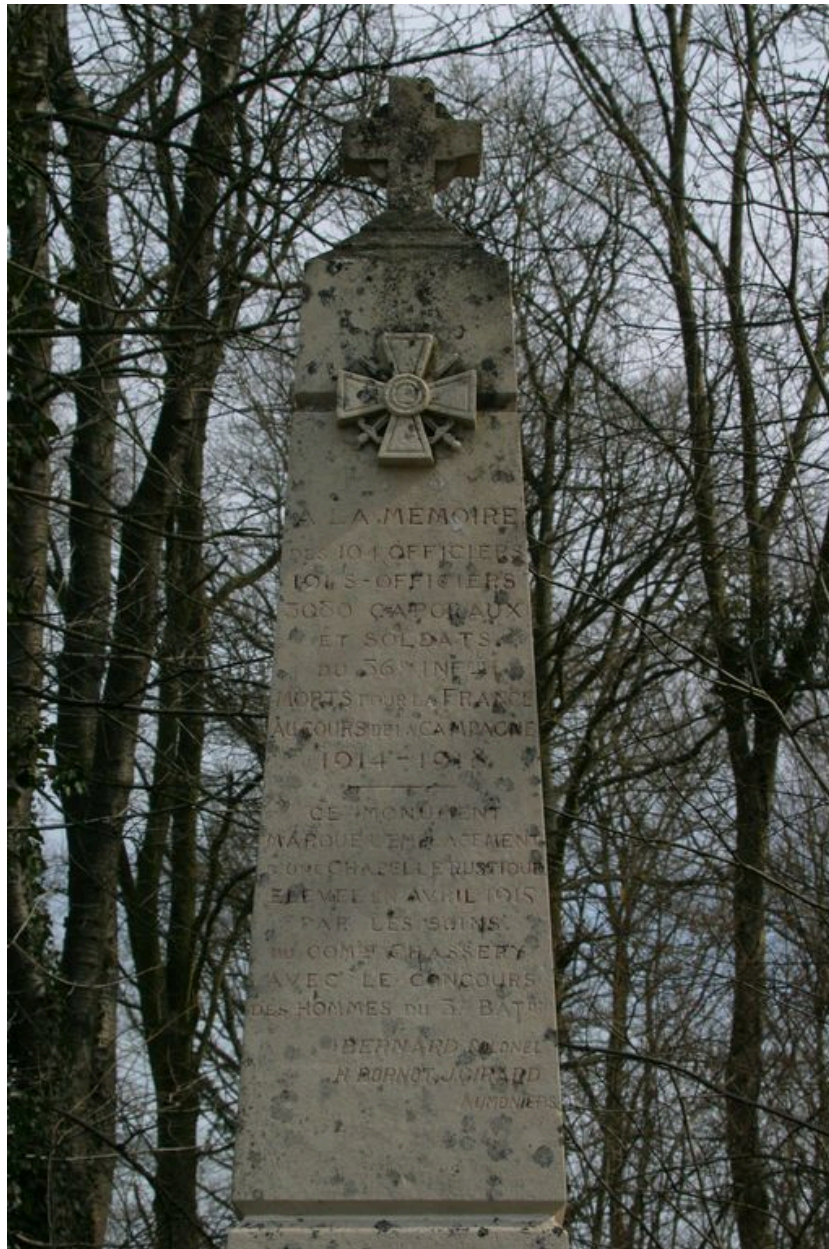
Vue détaillée de l'obélisque.