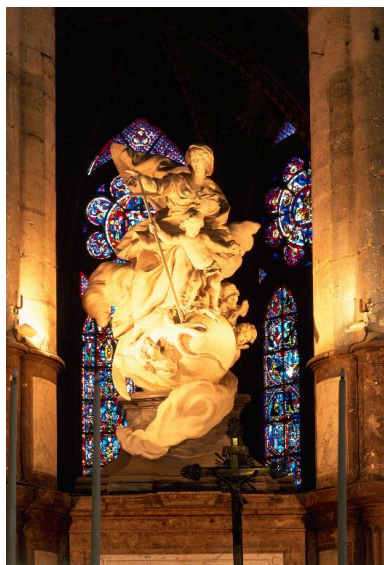
Vue de face. IVR22_19966003803XA