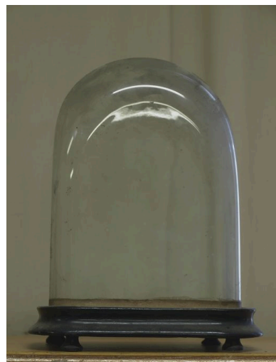
Objet de dévotion sous globe, non identifié, dont seul subsiste le globe IVR31_20106204658NUCA