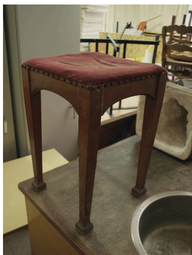
Tabouret : vue générale IVR31_20106204657NUCA