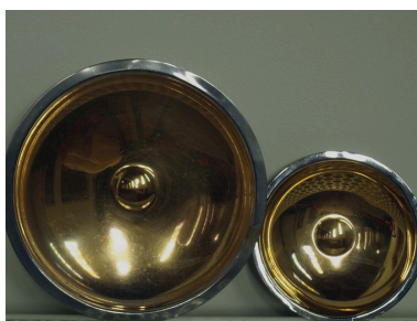
Deux plateaux ou plats à quêter IVR31_20106204654NUCA