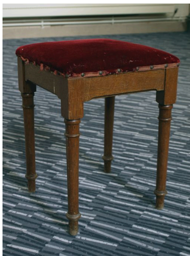
Tabouret : vue générale IVR31_20106204655NUCA