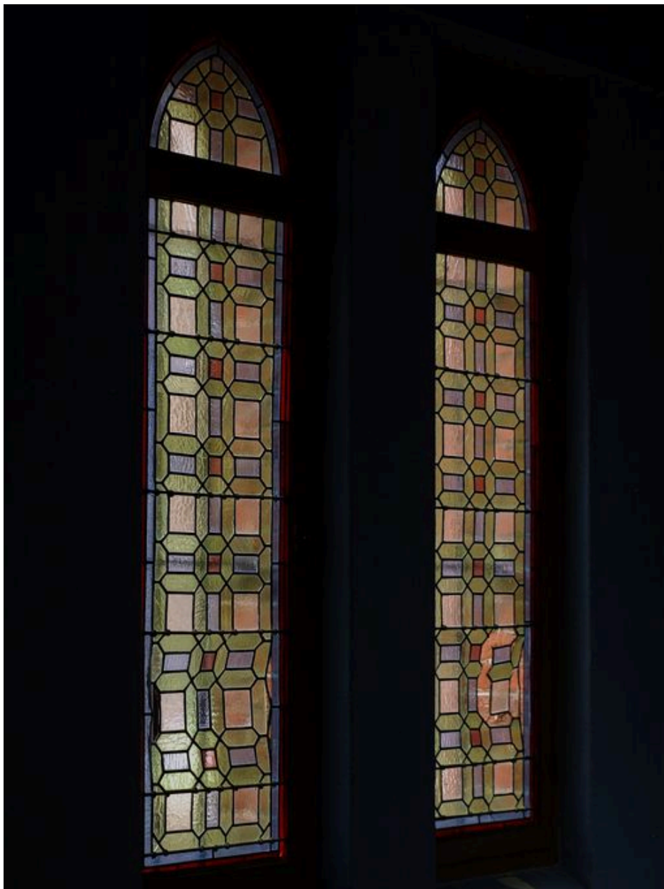
Deux verrières décoratives, losangées et colorées