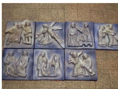
Chemin de croix, en plâtre IVR31_20106204659NUCA