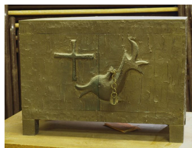
Tabernacle en métal doré : vue générale