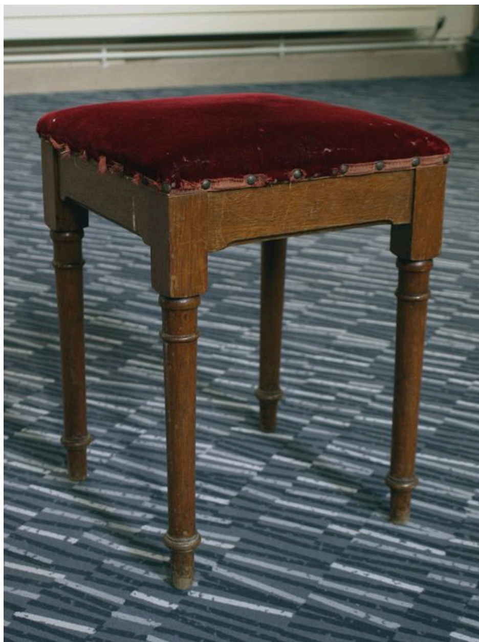
Tabouret : vue générale