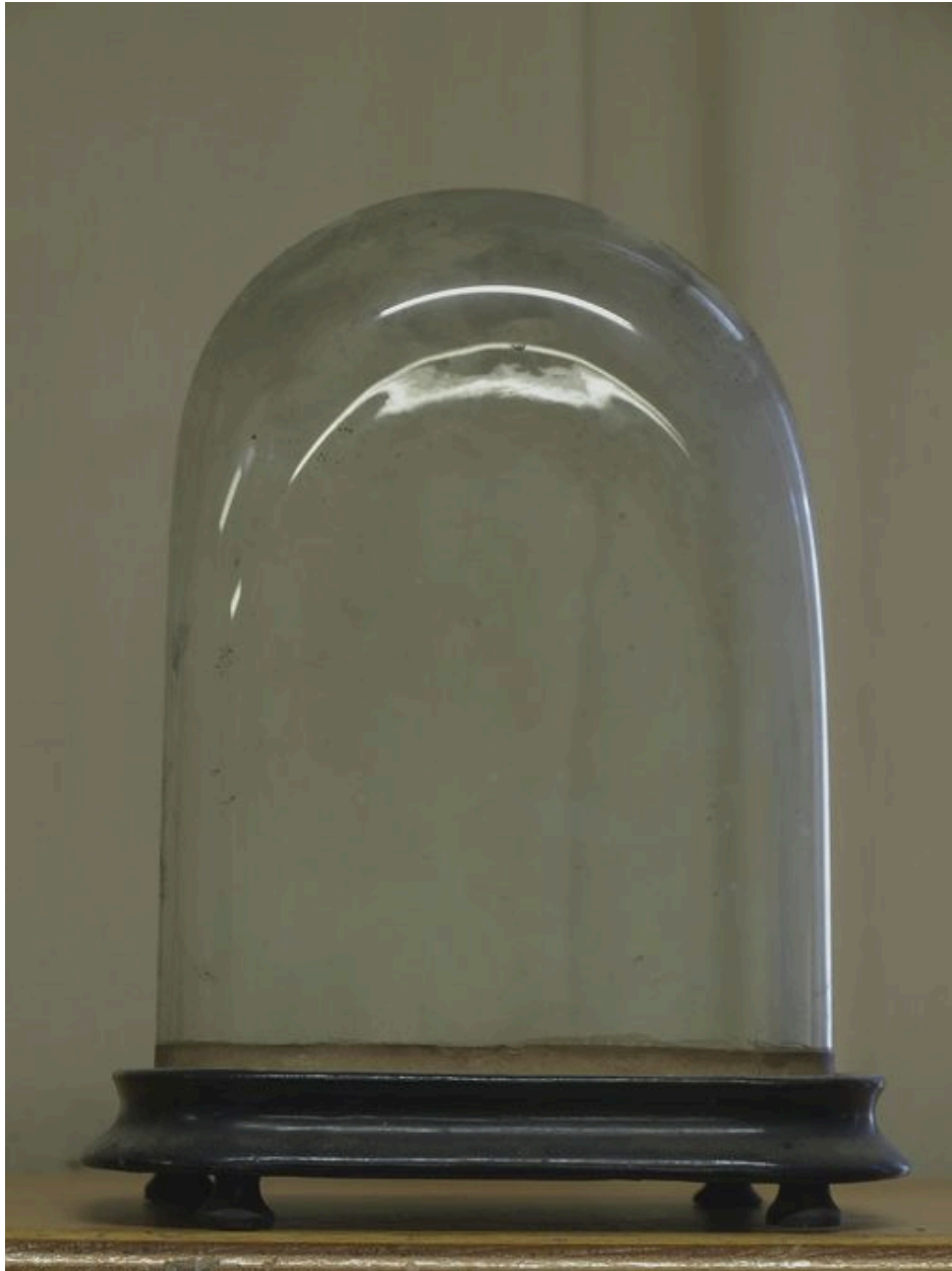
Objet de dévotion sous globe, non identifié, dont seul subsiste le globe