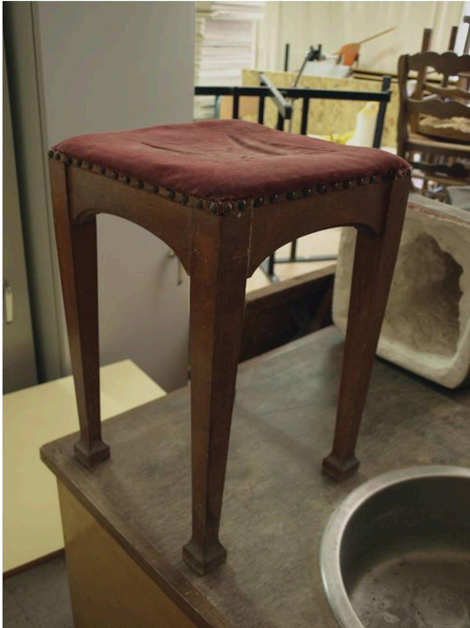
Tabouret : vue générale