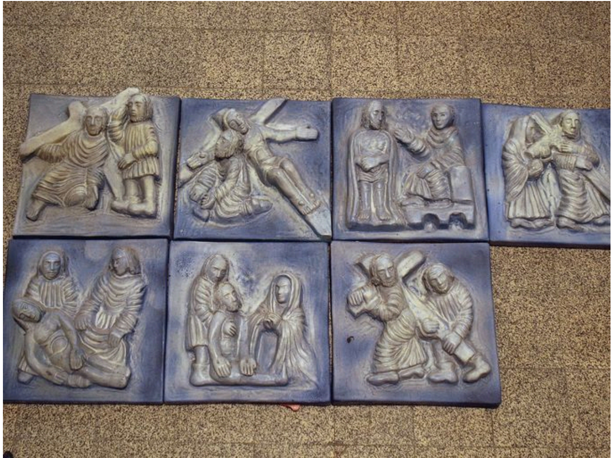
Chemin de croix, en plâtre