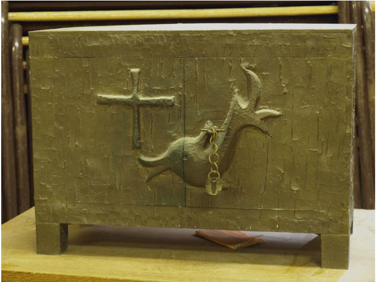
Tabernacle en métal doré : vue générale