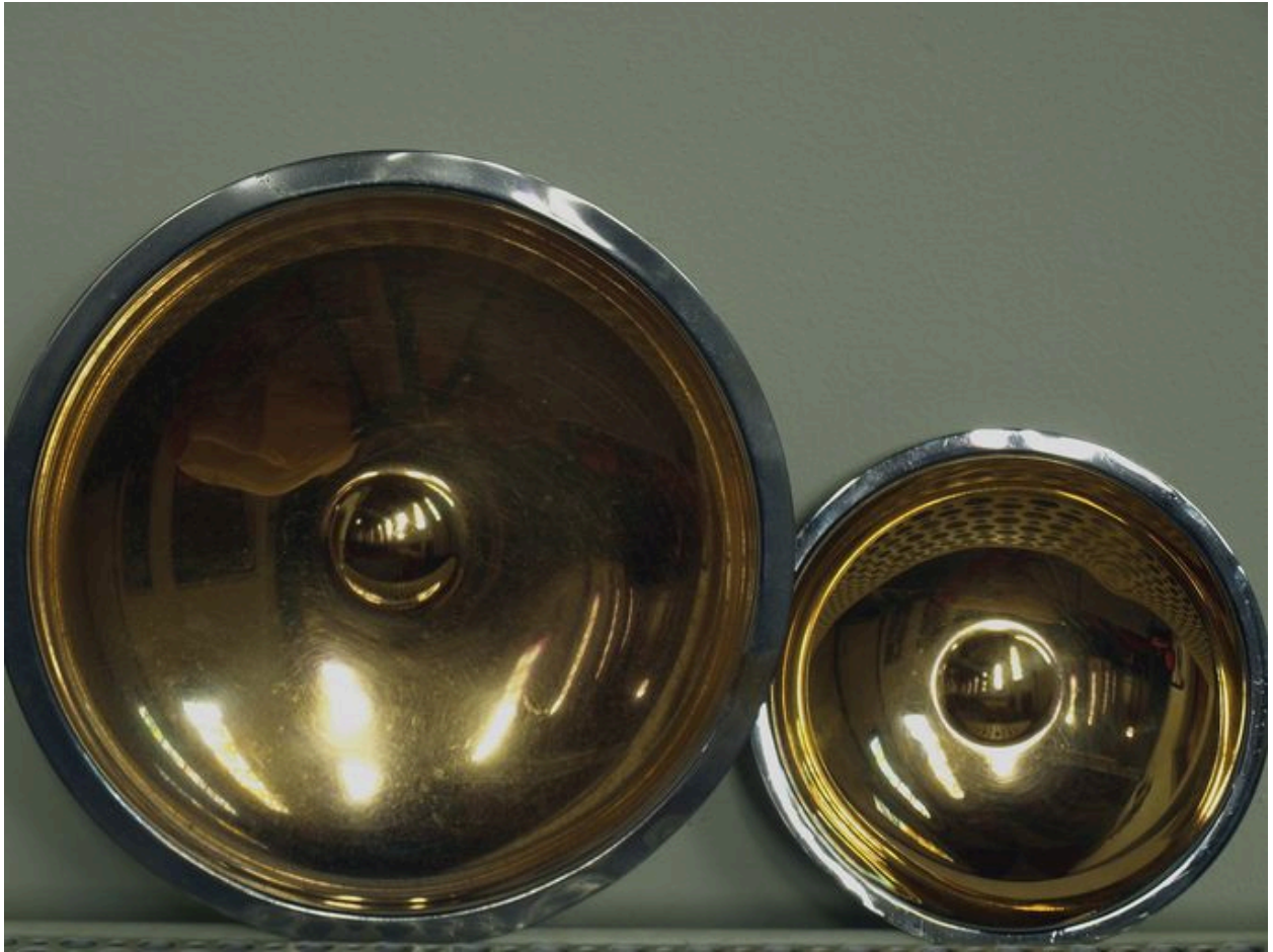
Deux plateaux ou plats à quêter