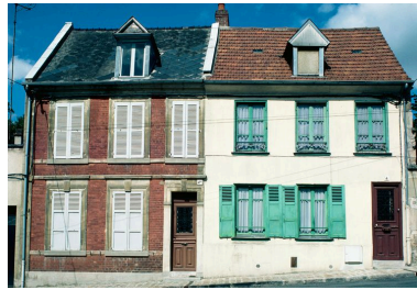
Elévation antérieure. IVR22_19856001325ZA

Plan de situation. Extrait du plan cadastral de 1974, section AL 9. IVR22_20096000485NUCA