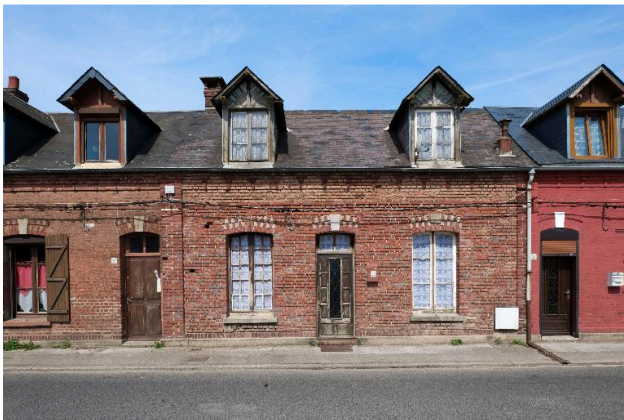
Vue d'un logement de contremaître ou d'ouvrier qualifié.