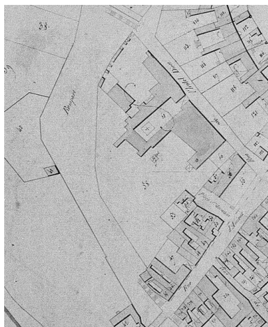
Extrait du cadastre napoléonien (DGI). IVR22_20096000553NUCA