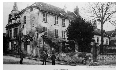
Etat avant 1914 (AP). IVR22_19856000505XB