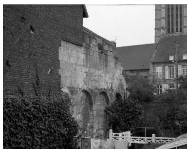
Vestiges du mur gouttereau nord.