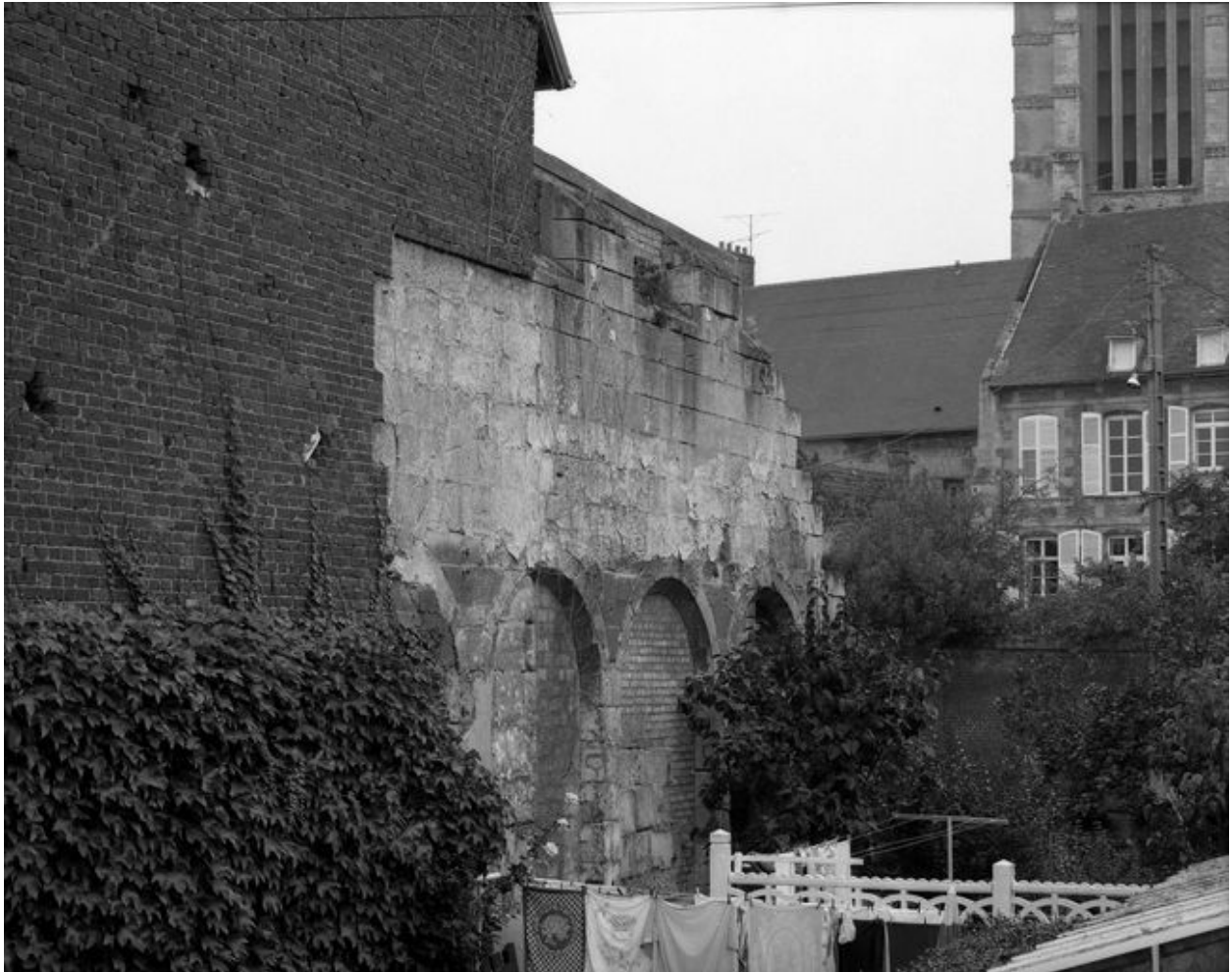
Vestiges du mur gouttereau nord.