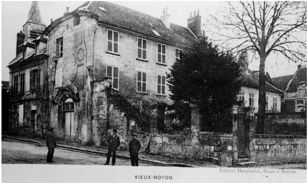
Etat avant 1914 (AP).