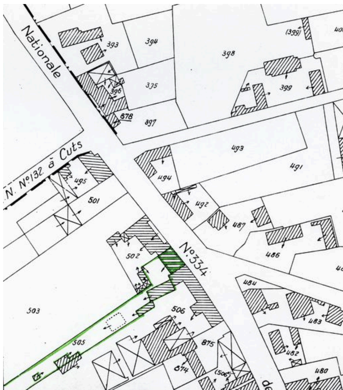
Plan de situation. Extrait du plan cadastral de 1962, section C2 505.