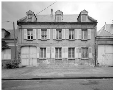
Elévation antérieure. IVR22_19856000822V

Plan de situation. Extrait du plan cadastral de 1962, section C2 505. IVR22_20096000087NUCA