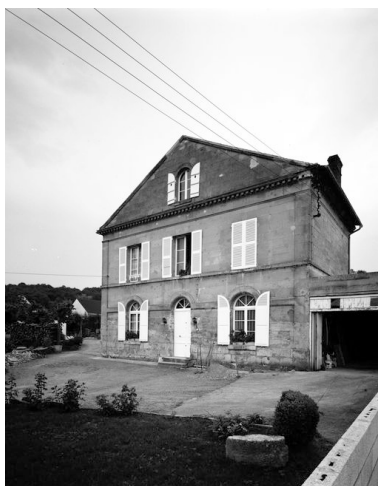
Élévation antérieure. IVR22_19856000811X