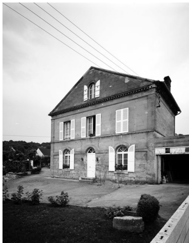
Elévation antérieure. IVR22_19856000811X