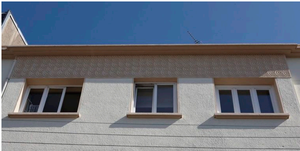
Frise Art déco aux motifs semi-circulaires.