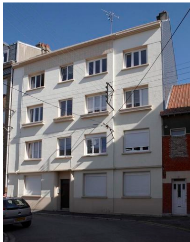
Vue générale. IVR31_20086200237NUCA