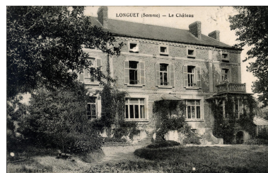
Vue du château de Longuet, façade sud, depuis le parc, carte