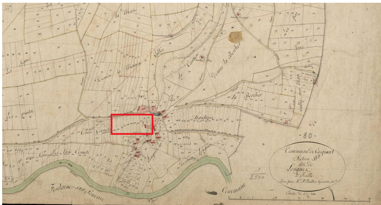
Recadrage plan parcellaire de la commune de Caours, dit cadastre napoléonien, section B2, hameau de Longuet, 1812 (AD Somme ; 3 P 1316/5).