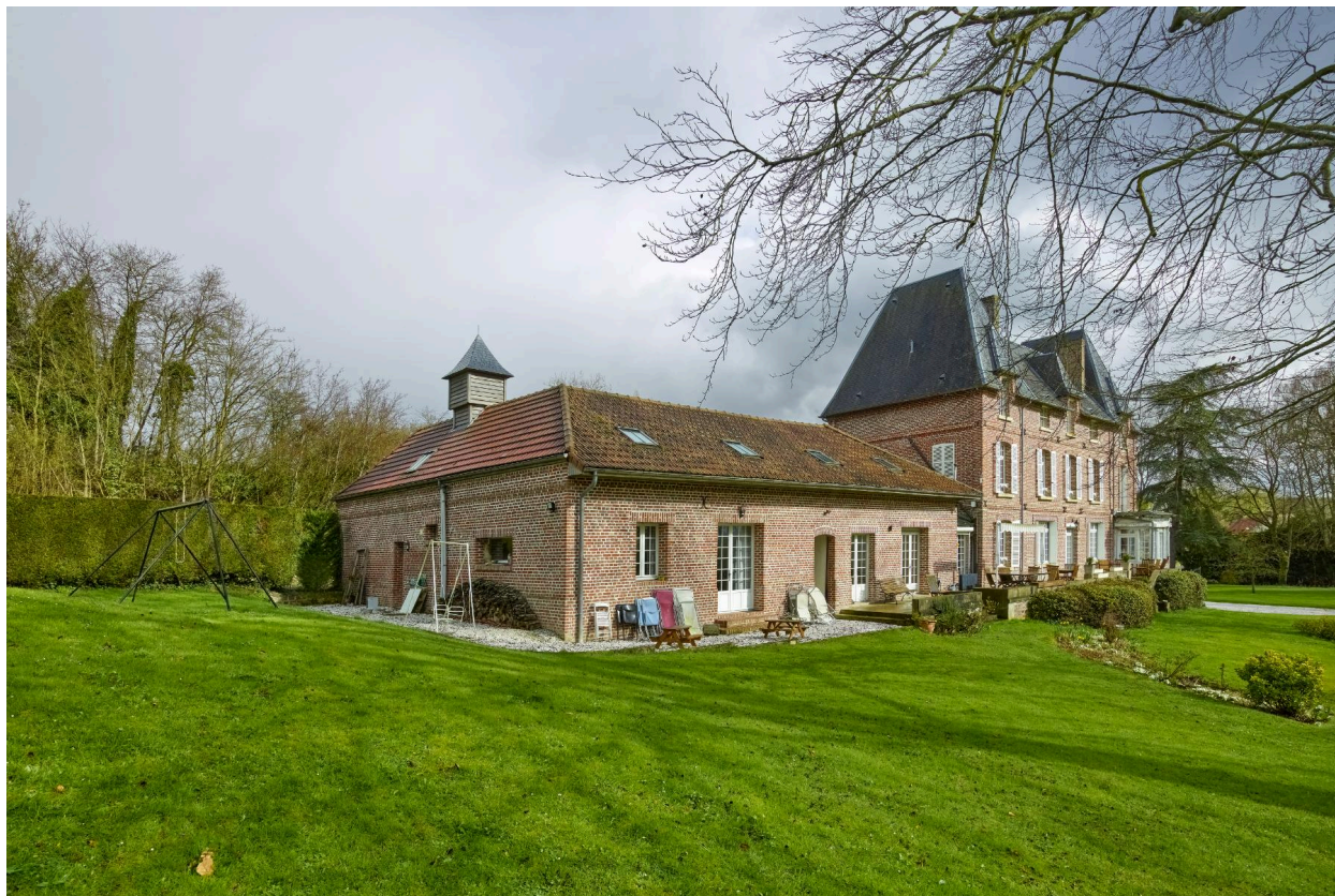
Vue de la dépendances et de la demeure, depuis l'ouest.