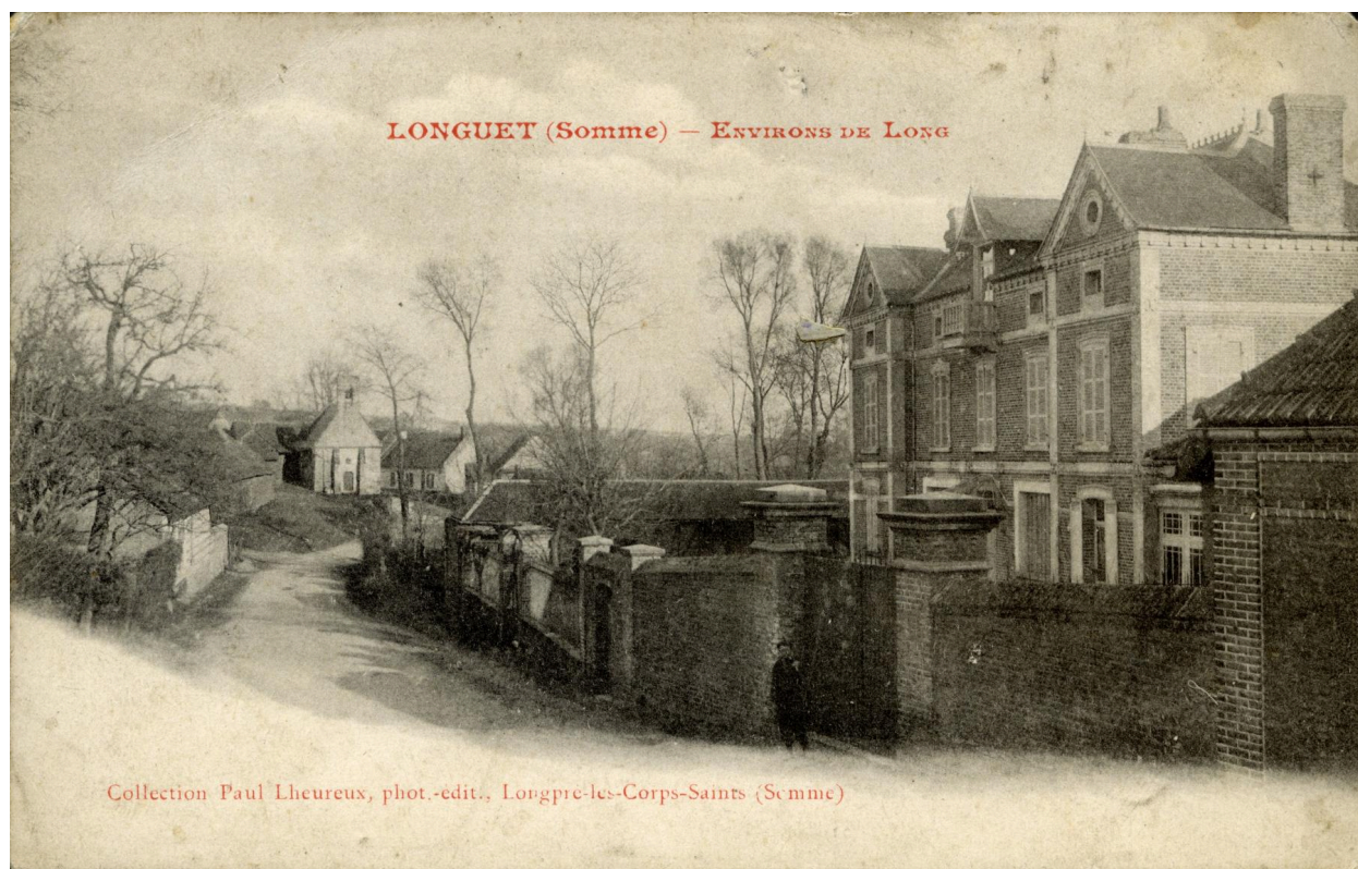
Vue du château de Longuet, façade nord, depuis la rue, carte postale, Paul Lheureux, phot.-édit., Longpré-les-Corps-Saints (coll. part. Hubert Lourdelle).