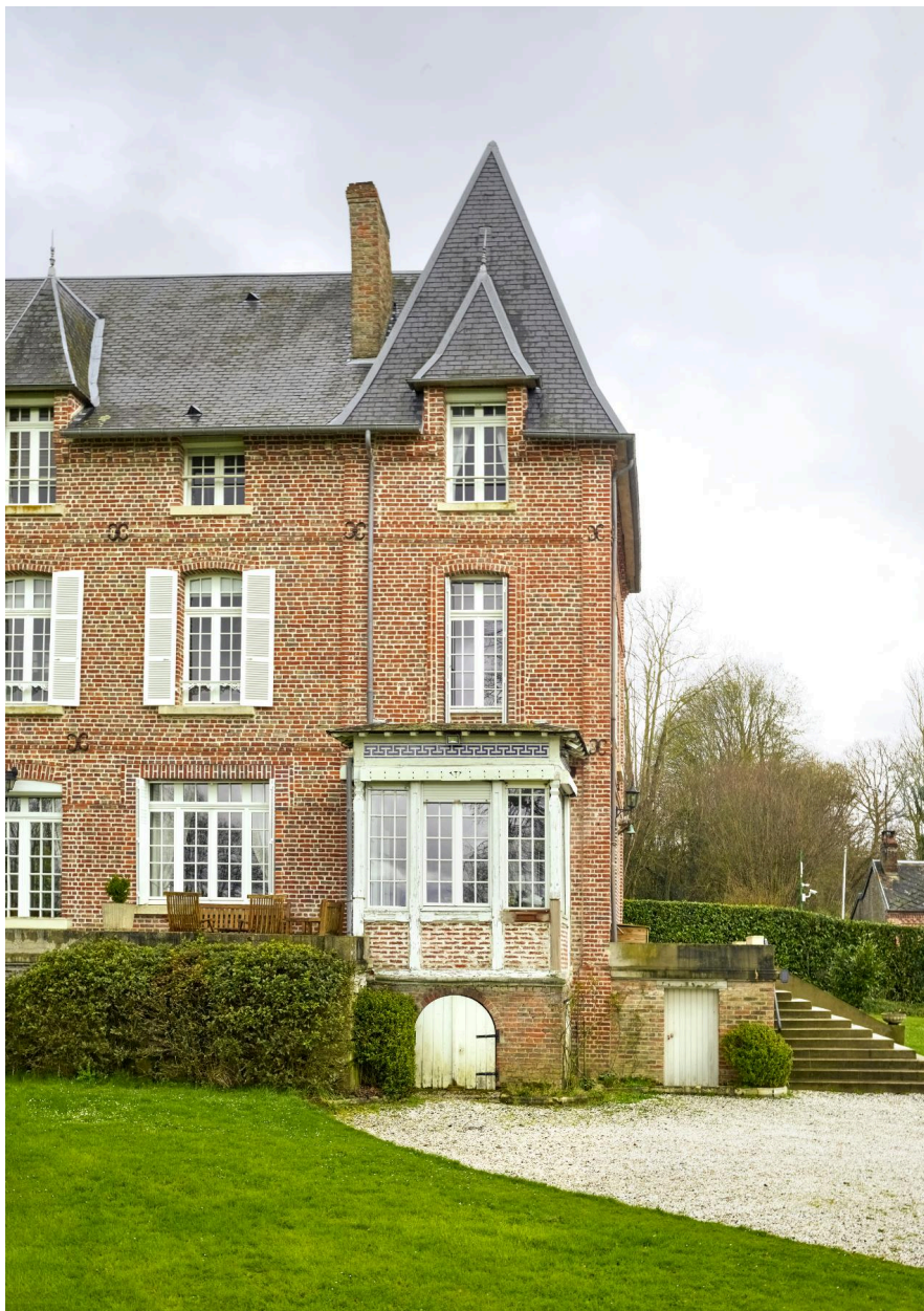
Détail de la véranda de la façade sud.