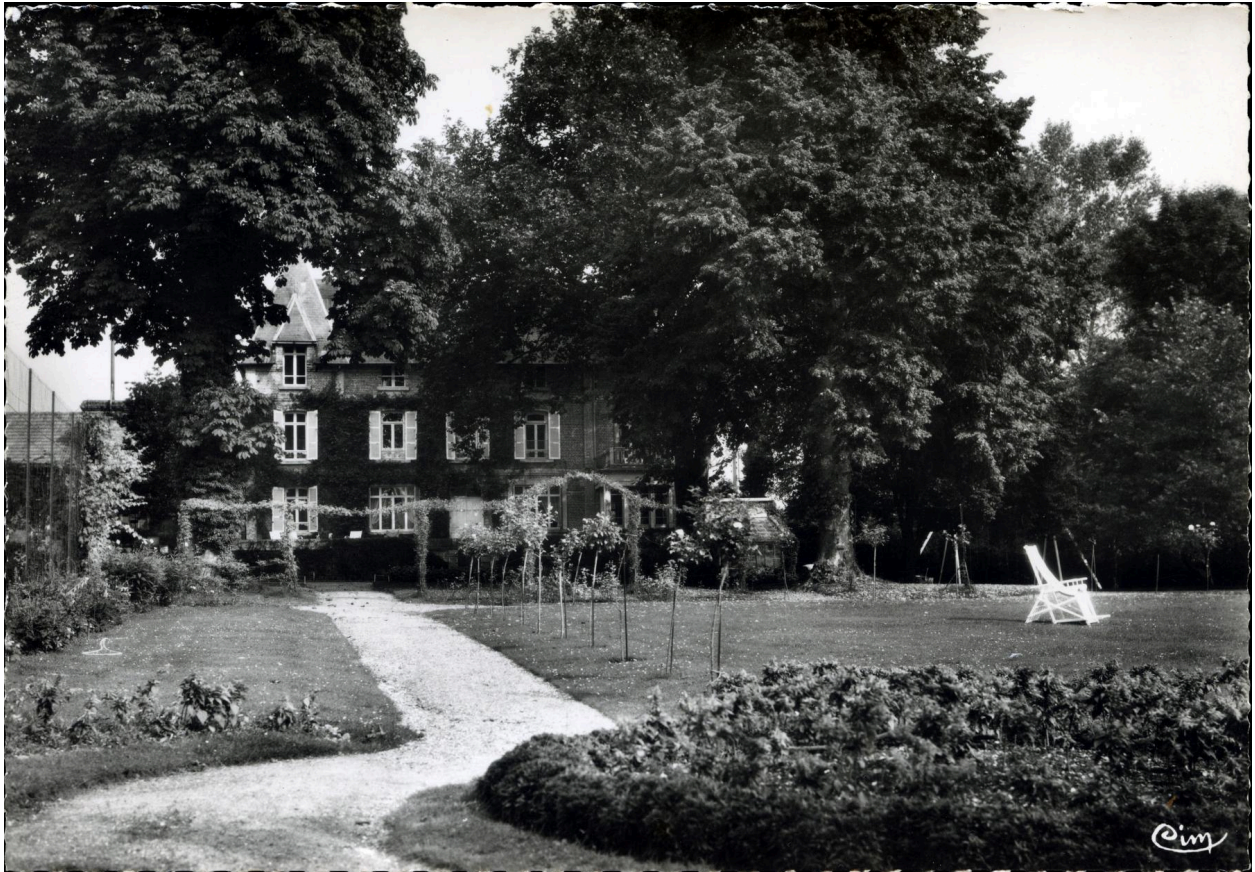
Vue du parc du château de Longuet, depuis le sud, carte postale, Combiér imprimeur Macon-Cim. (coll. part. Hubert Lourdelle).