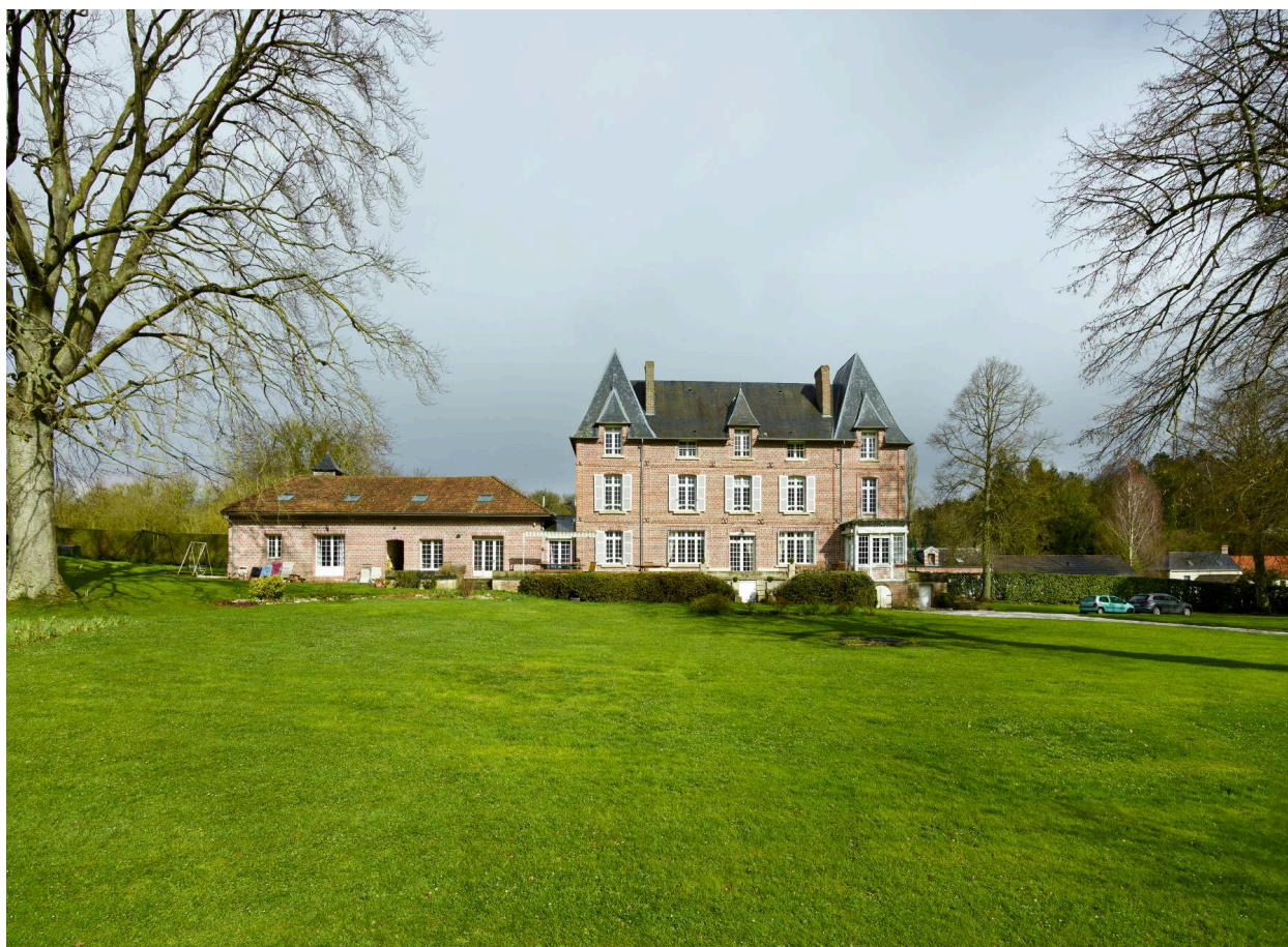
Vue de la demeure dans son parc, depuis le sud.