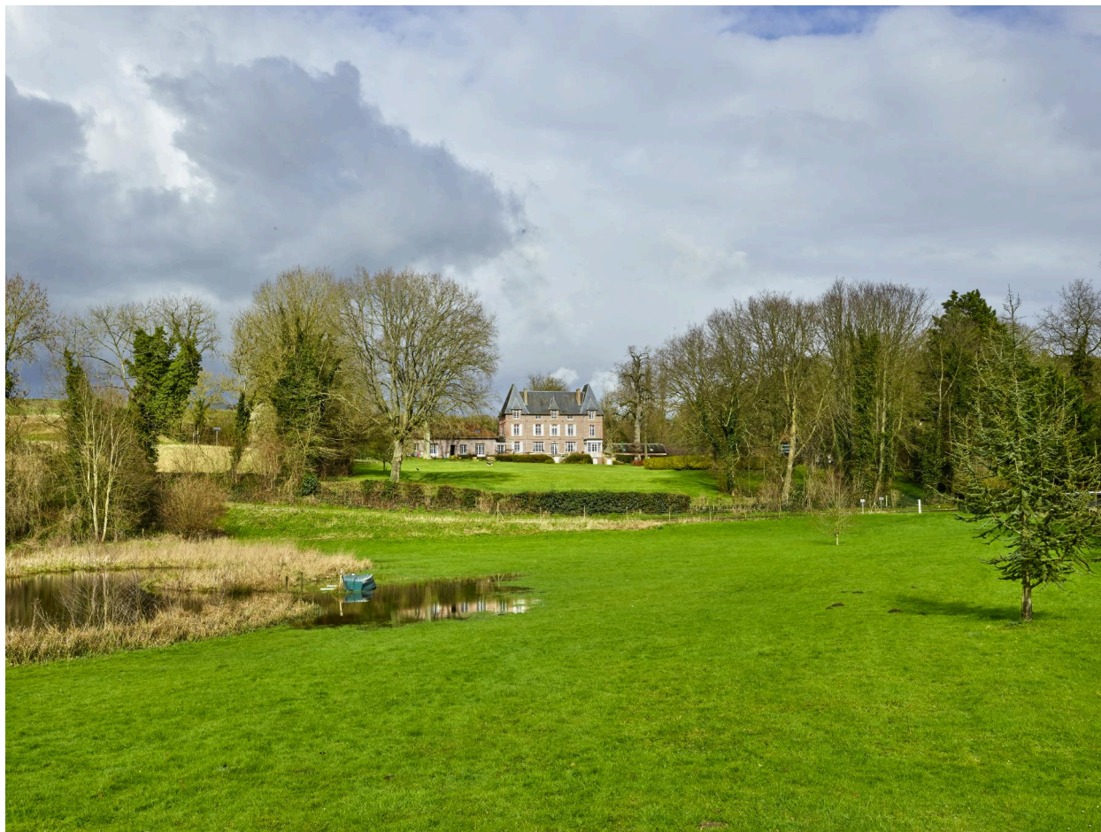
Vue de la demeure dans son environnement, depuis le sud.