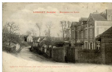
Vue du château de Longuet, façade nord, depuis la rue, carte postale