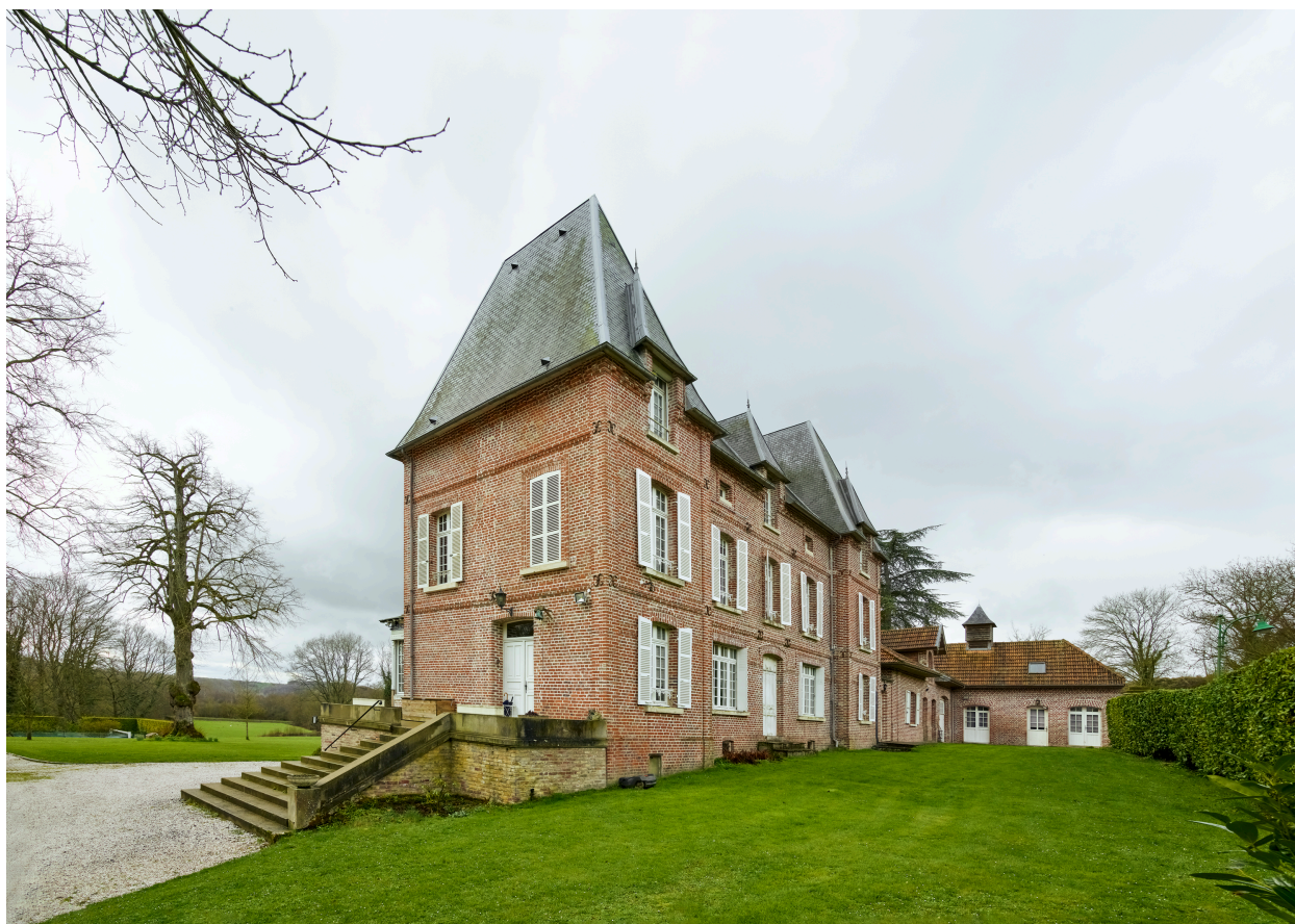
Vue de la façade nord de la demeure, depuis le nord-est.