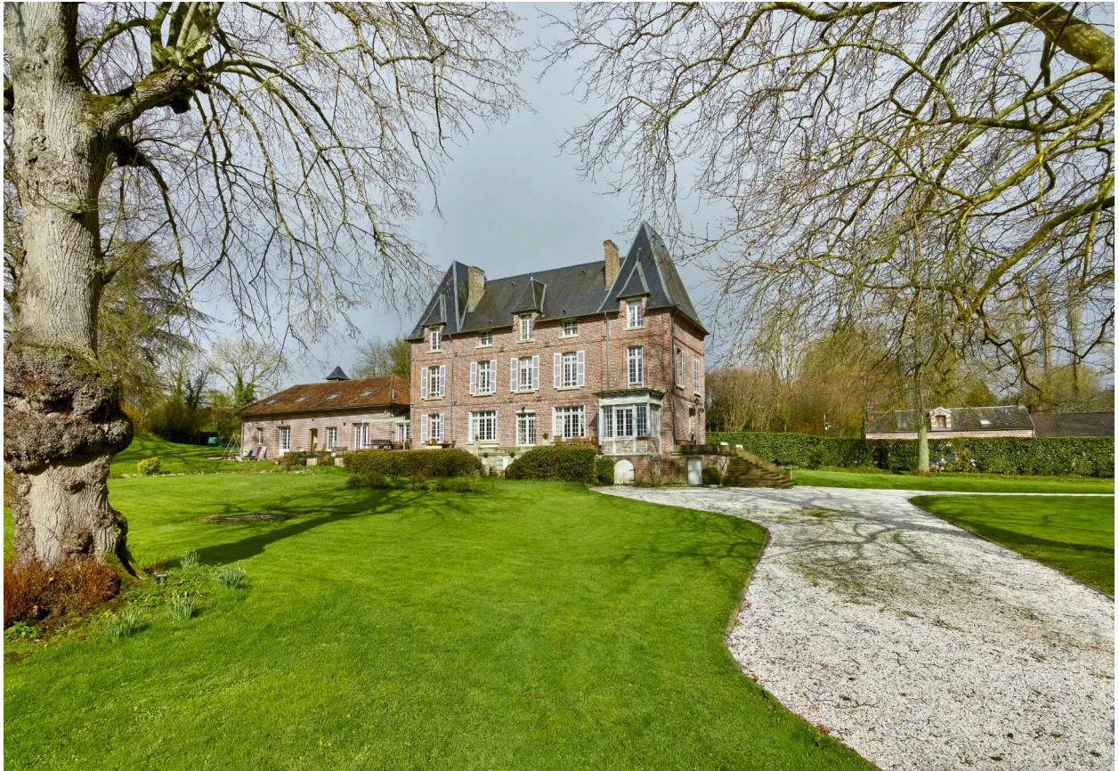
Vue de la demeure, depuis le sud.