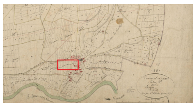
Recadrage plan parcellaire de la commune de Caours, dit cadastre napoléonien, section