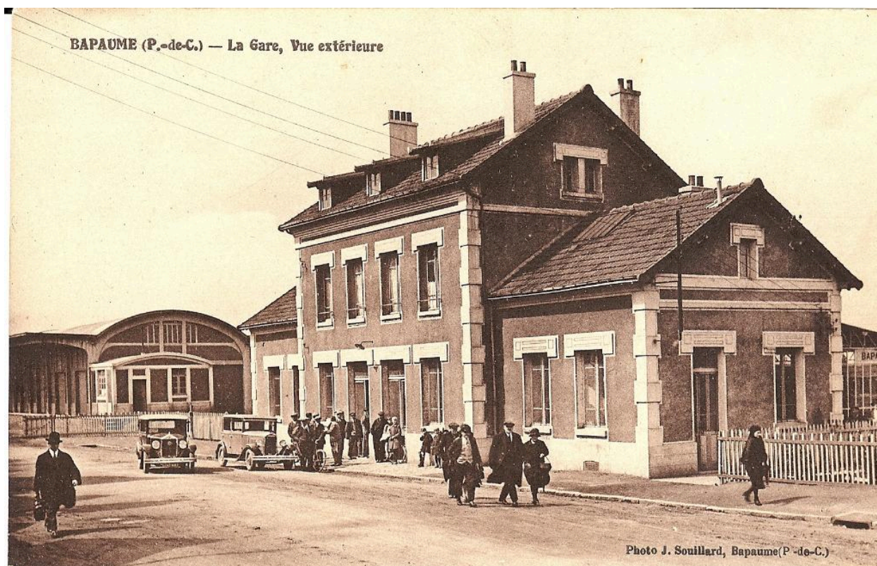
Bapaume (P.-de-C.) - La gare, vue extérieure. Photo J. Souillard, Bapaume. Carte postale, vers 1930. (Coll. part.). Vue générale de la place de la gare reconstruite.