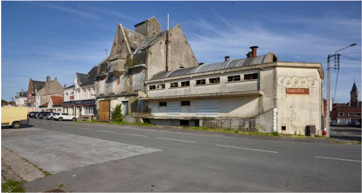
Vue générale côté sud.