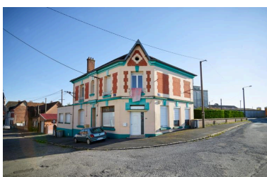
Vue des façades et du pan coupé depuis la rue de la gare de l'ancienne maison-estaminet de Mme veuve Angéline Leclercq-Verdel. Construit entre 1921 et 1928 par Eugène Bidard (AD Pas-de-Calais, 10R9/48, dossier n°696).

IVR32_20196200883NUCA