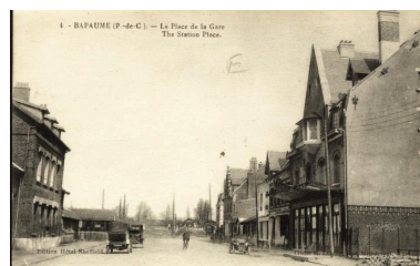
4. Bapaume. La place de la Gare - The station place. edition Hôtel Sheffield. Cliché R. Lelong, rue Miromont, Amiens. Carte postale, vers 1925 (coll. part.). Vue générale de place reconstruite.

Repro. Hubert Bouvet IVR32_20196200974NUCA