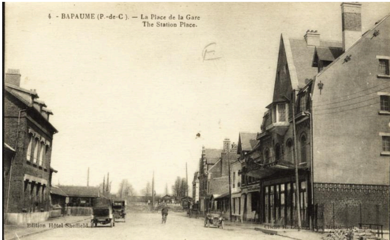
4. Bapaume. La place de la Gare - The station place. edition Hôtel Sheffield. Cliché R. Lelong, rue Miromont, Amiens. Carte postale, vers 1925 (coll. part.). Vue générale de place reconstruite.