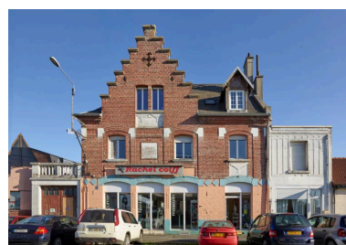
Maison de commerce avec pignon à redents, place de la gare.

IVR32_20196200517NUCA