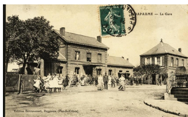
Bapaume - la gare. Edition Bertrancourt, Bapaume. Carte postale, vers 1910 (coll. part.). Vue générale de la place de la gare avant guerre.

Repro. Hubert Bouvet IVR32_20196200971NUCA