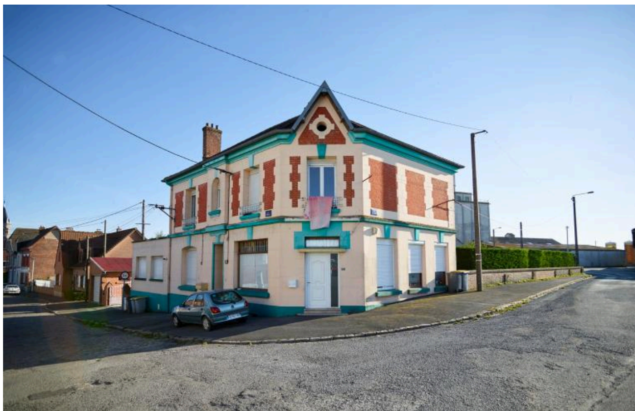
Vue des façades et du pan coupé depuis la rue de la gare de l'ancienne maison-estaminet de Mme veuve Angéline Leclercq-Verdel. Construit entre 1921 et 1928 par Eugène Bidard (AD Pas-de-Calais, 10R9/48, dossier n°696).