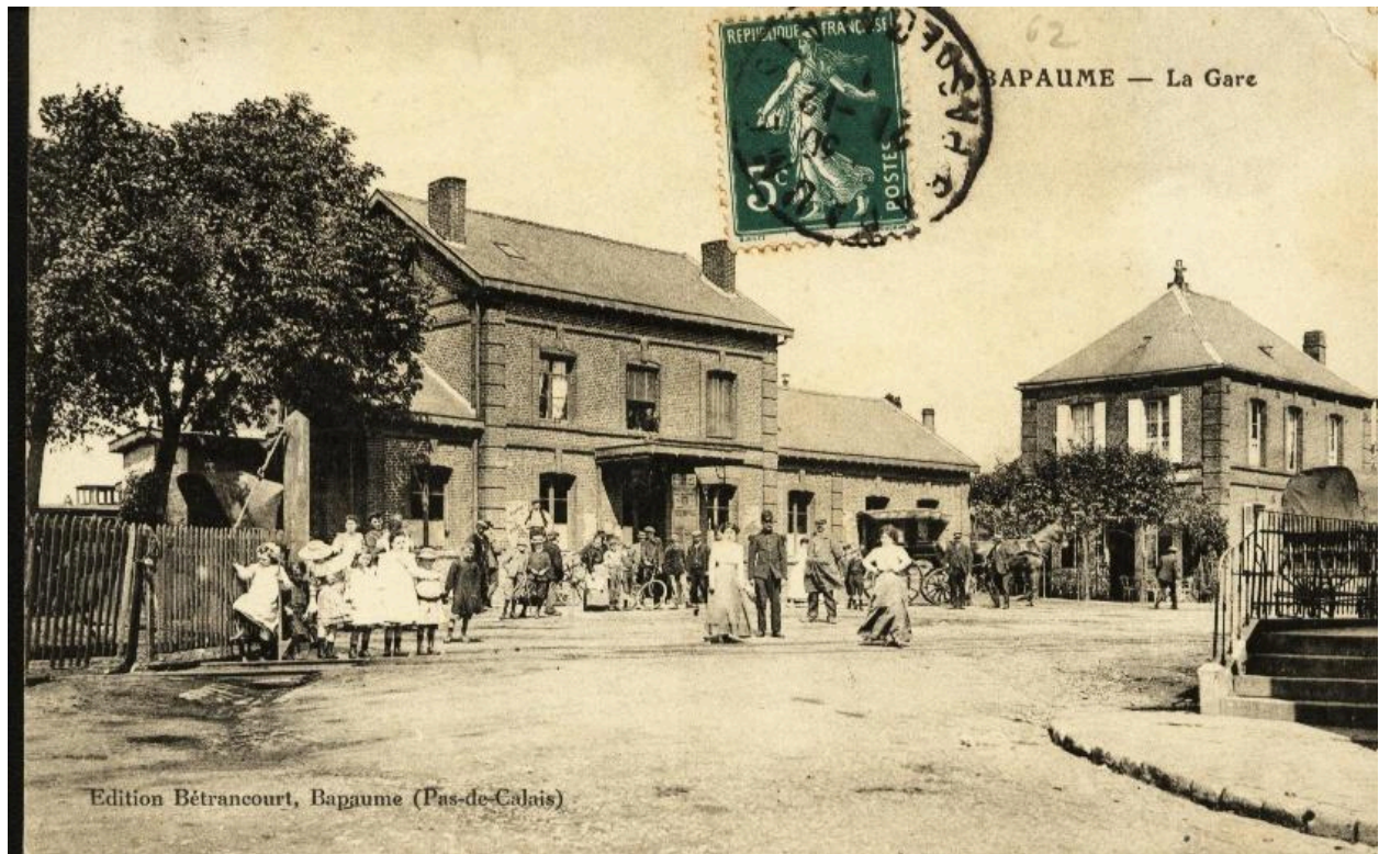
Bapaume - la gare. Edition Bertrancourt, Bapaume. Carte postale, vers 1910 (coll. part.). Vue générale de la place de la gare avant guerre.