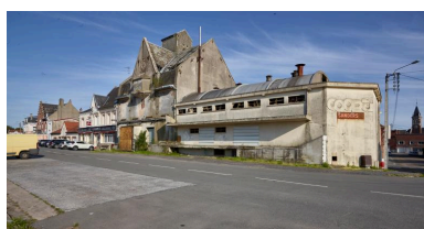
Vue générale côté sud.

Repro. Bouvet Hubert IVR32_20196200991NUCA