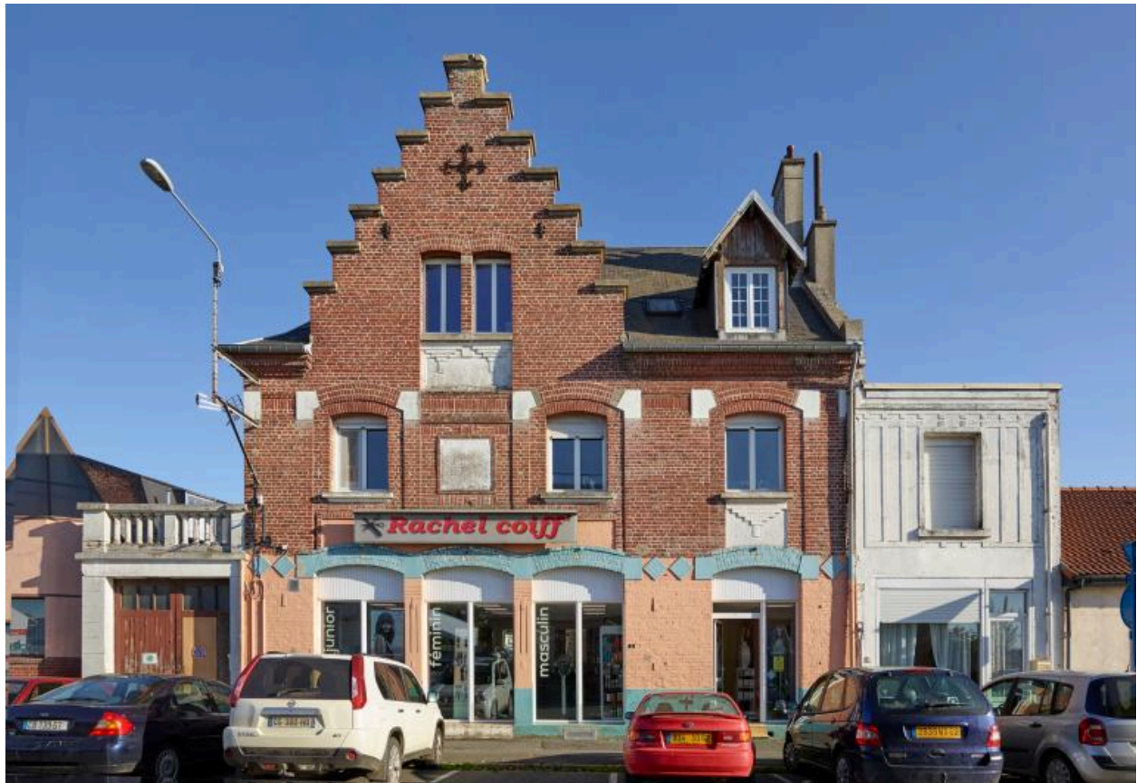
Maison de commerce avec pignon à redents, place de la gare.