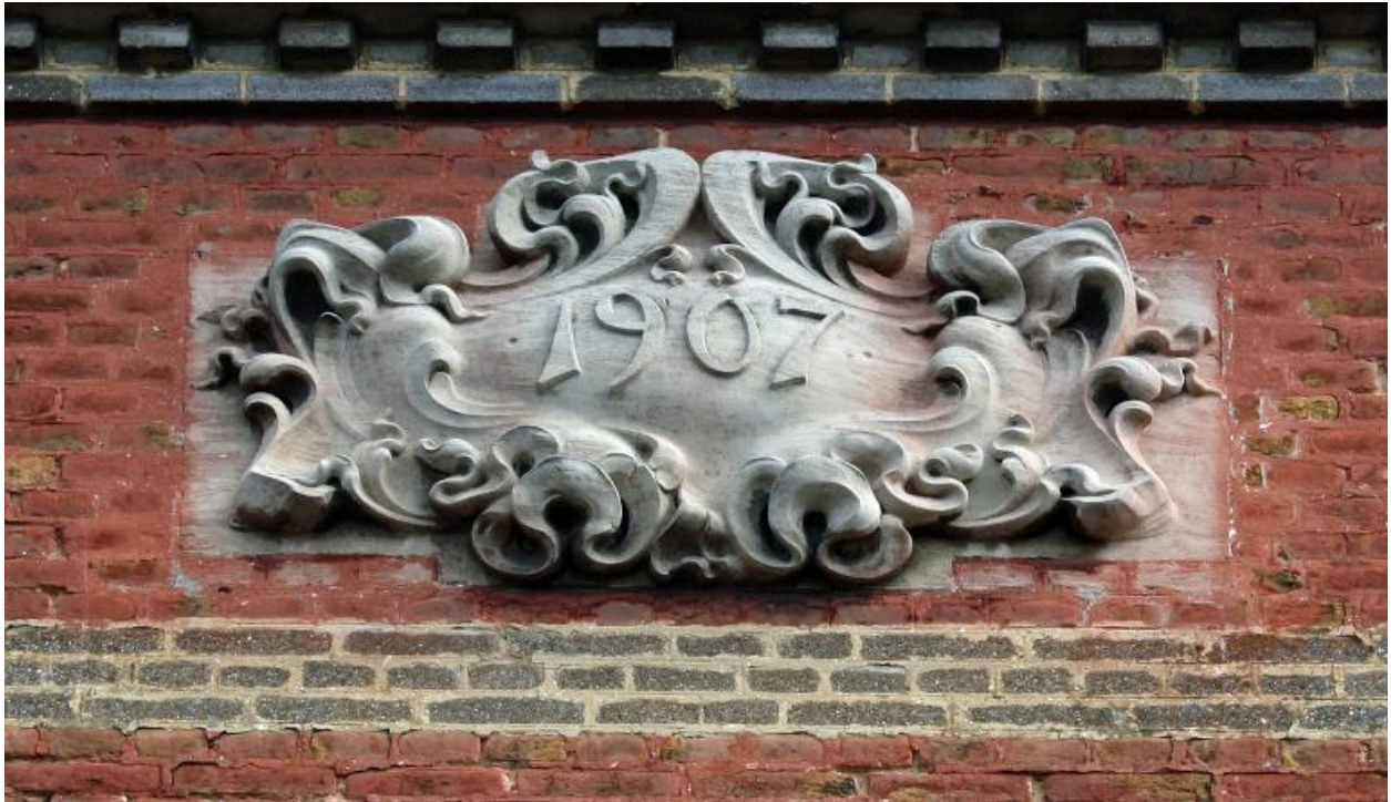
Cartouche portant la date de 1907.