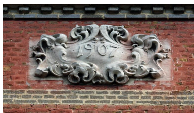
Cartouche portant la date de 1907. IVR22_20128005025NUCA