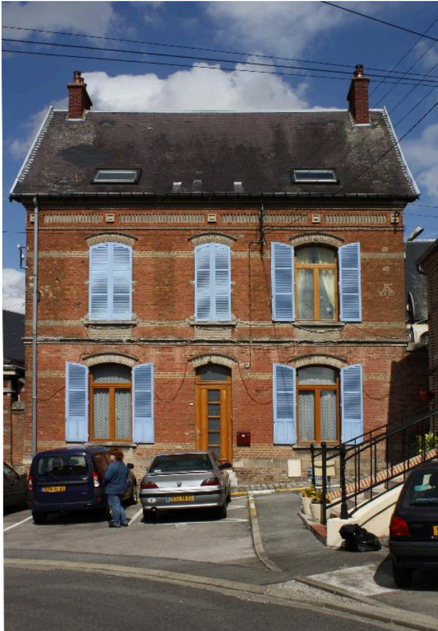
Façade sur rue du logement d'institutrice.