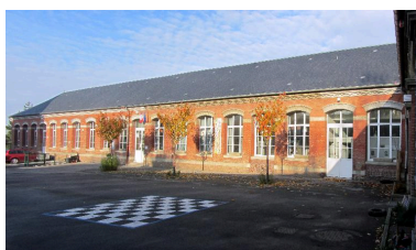
Façade sur cour des salles de classe. IVR22_20138016096NUC2A