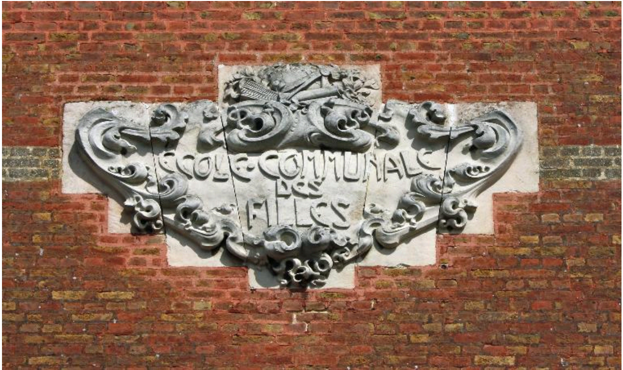
Détail du cartouche orné de l'école communale des filles.