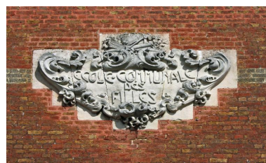
Détail du cartouche orné de l'école communale des filles. IVR22_20128005023NUCA