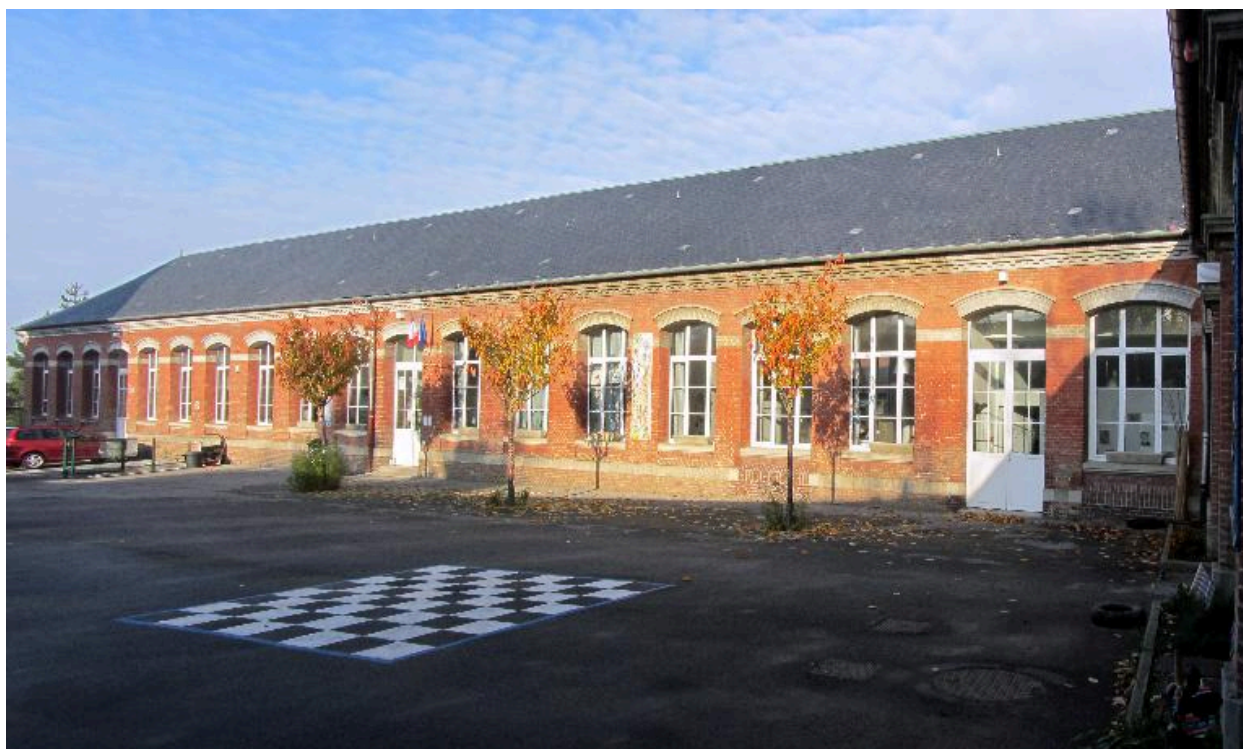
Façade sur cour des salles de classe.