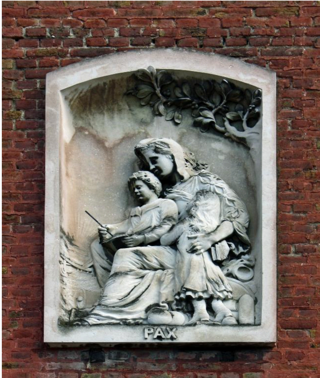
Détail du haut-relief de l'allégorie de la paix sculpté par Georges Legrand.