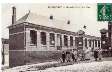
L'école, vers 1910.