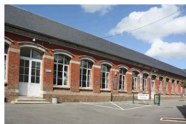
Façade sur cour.