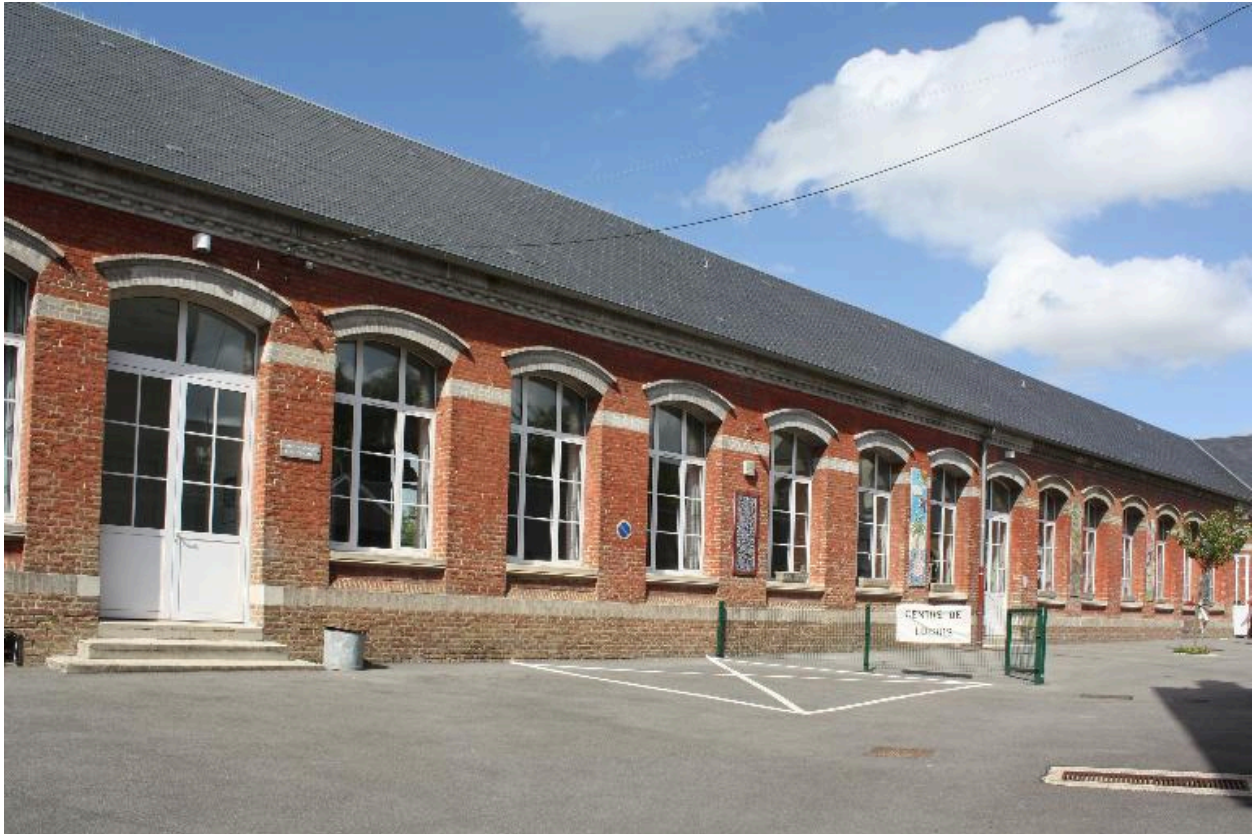
Façade sur cour.