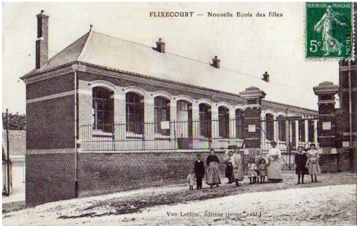
L'école, vers 1910.