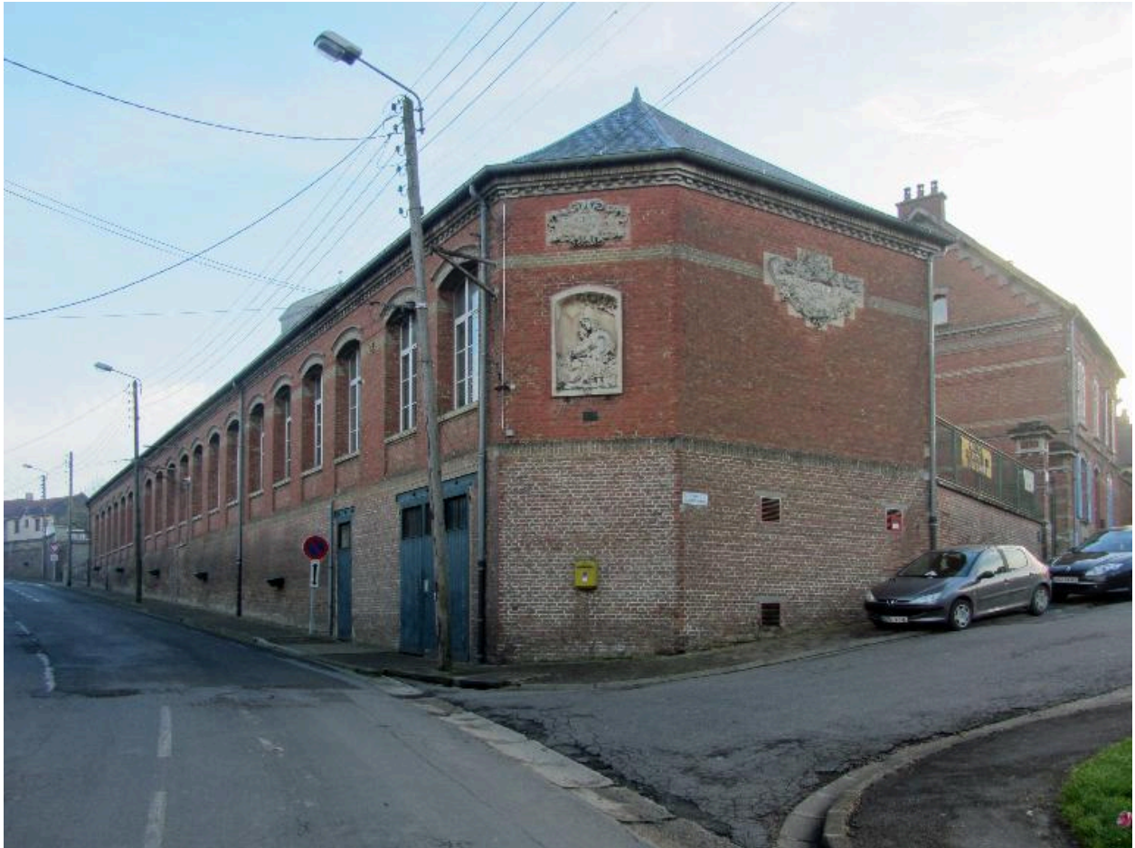
Vue d'ensemble sur rue.