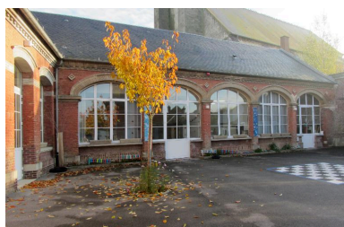
Façade sur cour des salles en retour. IVR22_20138016095NUC2A