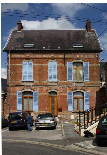
Façade sur rue du logement d'institutrice.