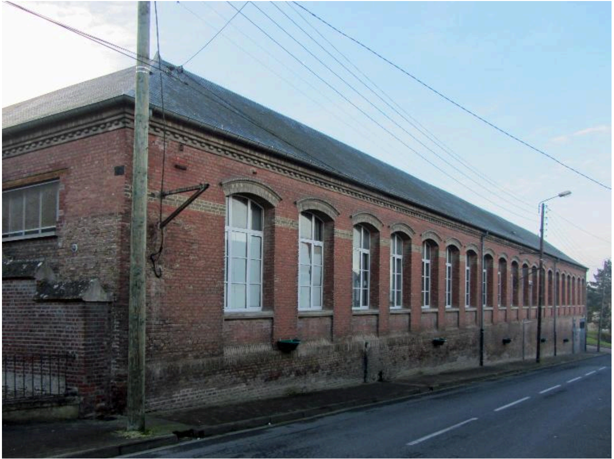
Façade sur rue des salles de classe.