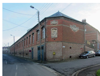
Vue d'ensemble sur rue. IVR22_20138016094NUC2A