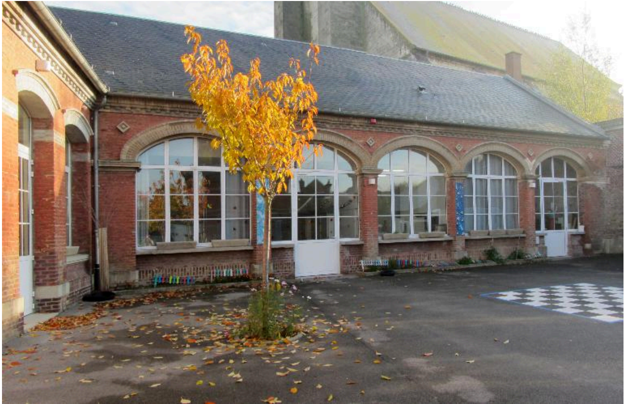
Façade sur cour des salles en retour.