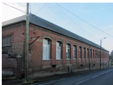
Façade sur rue des salles de classe.