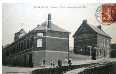
L'école, en 1910