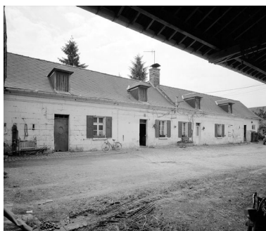
Logis. Elévation antérieure. IVR22_19856000844V