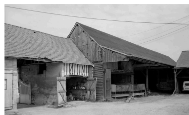
Hangar et ancien pigeonnier, depuis la cour. IVR22_19856000875V