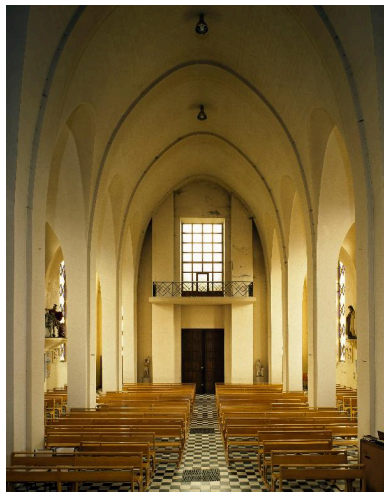
Vue intérieure vers l'entrée.