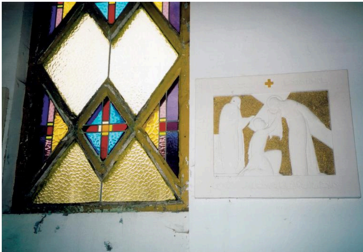
Verrière géométrique (atelier de Jean Damon, 1930) et chemin de croix (Darras-Delahaye, 1933).