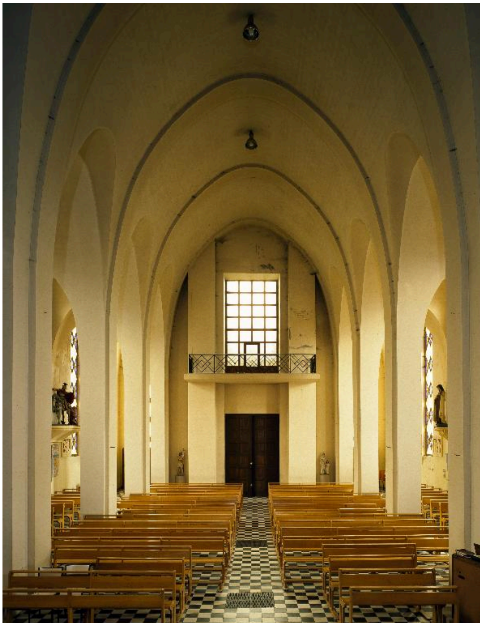
Vue intérieure vers l'entrée.