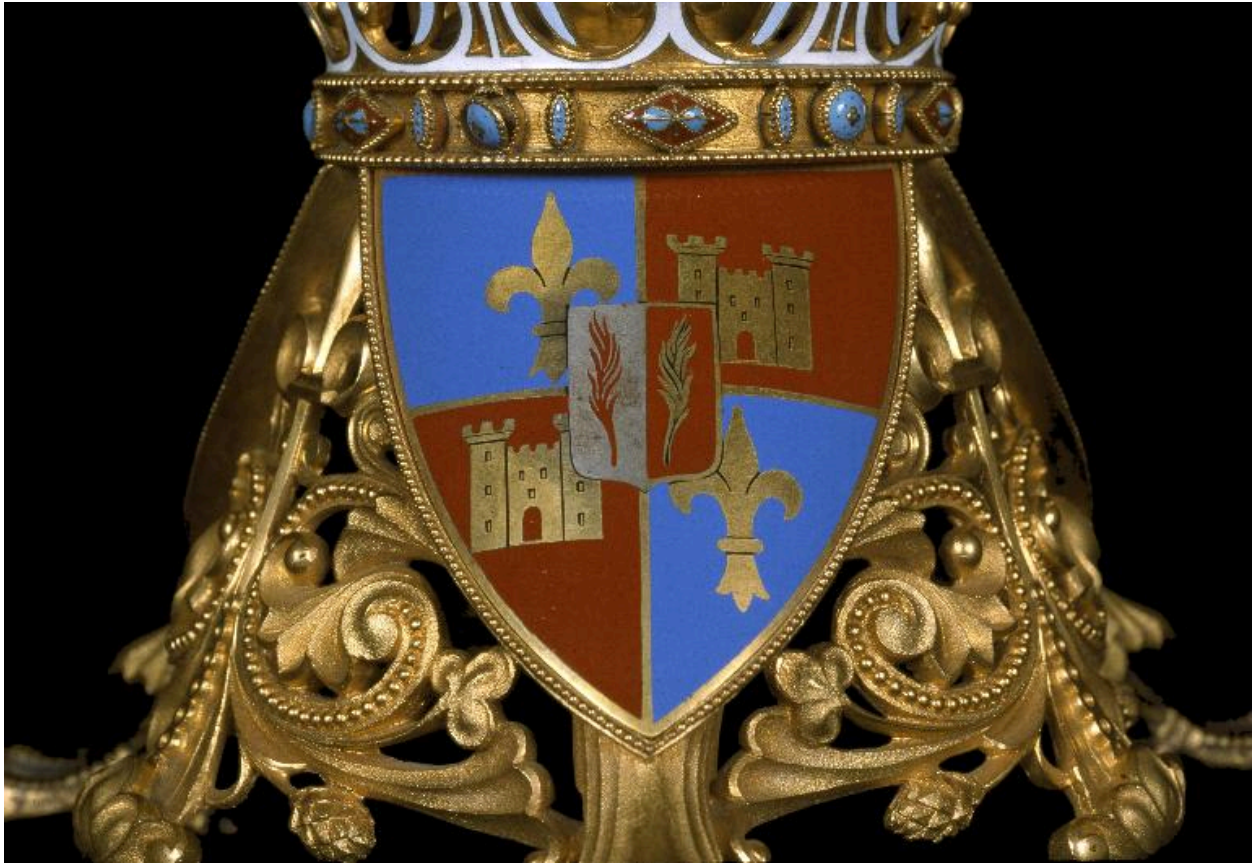
Détail du pied : armoiries du chapitre cathédral.