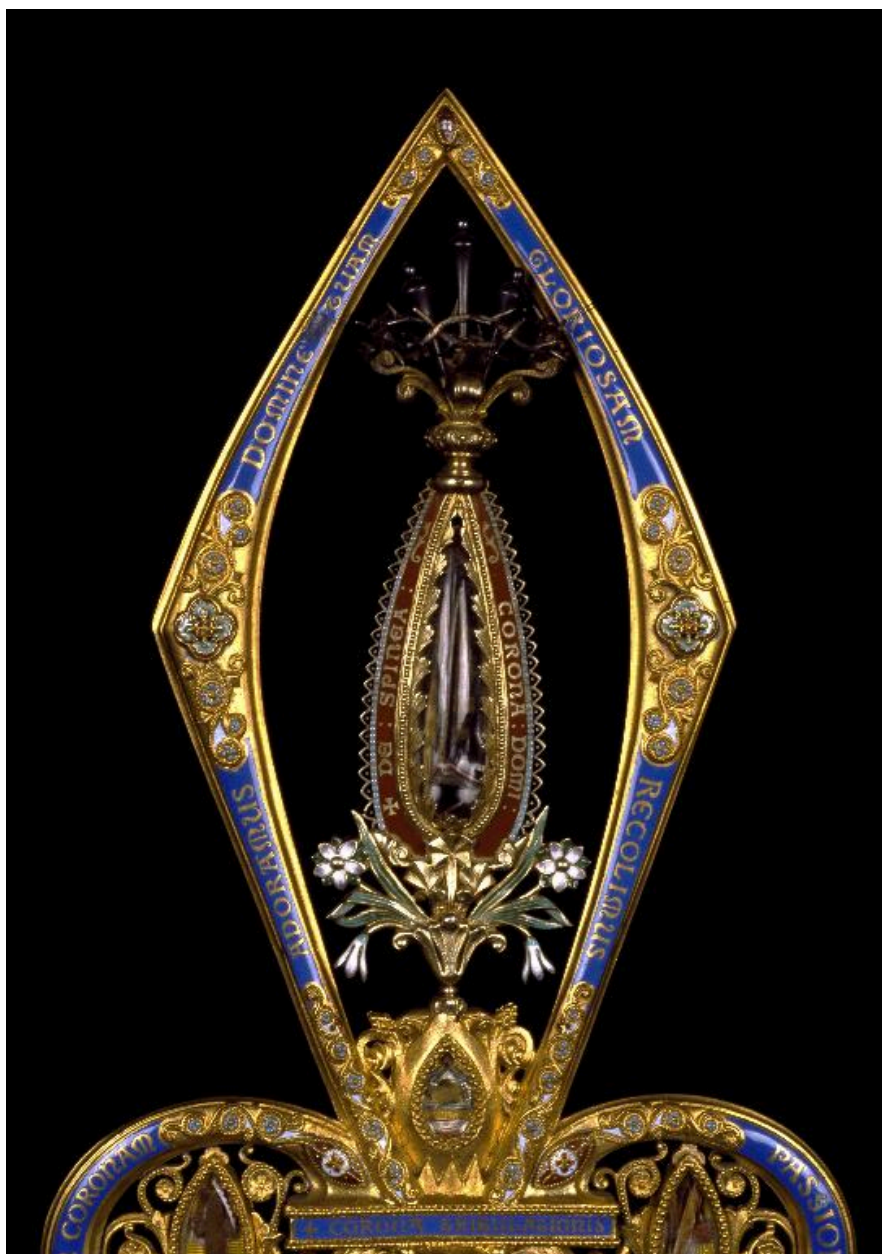
Détail du reliquaire : vue de la partie supérieure, renfermant une épine de la Couronne d'épines.