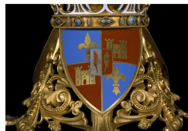
Détail du pied : armoiries du chapitre cathédral.