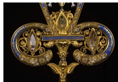
Détail du reliquaire : vue de la partie médiane, renfermant une parcelle de la croix, du roseau et de l'éponge. IVR22_20010202291ZA