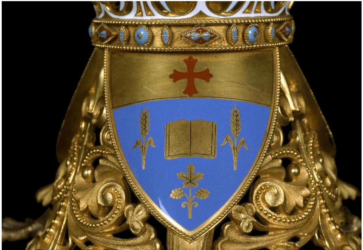
Détail du pied : armoiries de Monseigneur Odon Thibaudier.