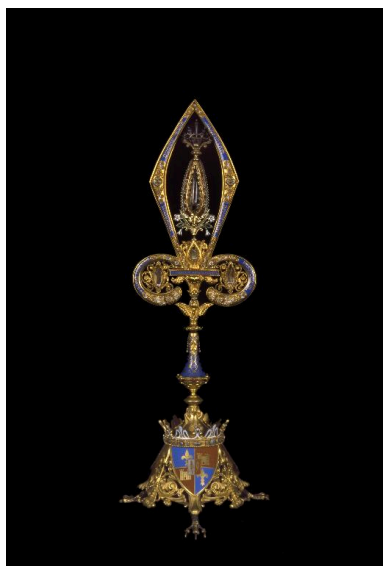
Vue générale. IVR22_20010202289ZA