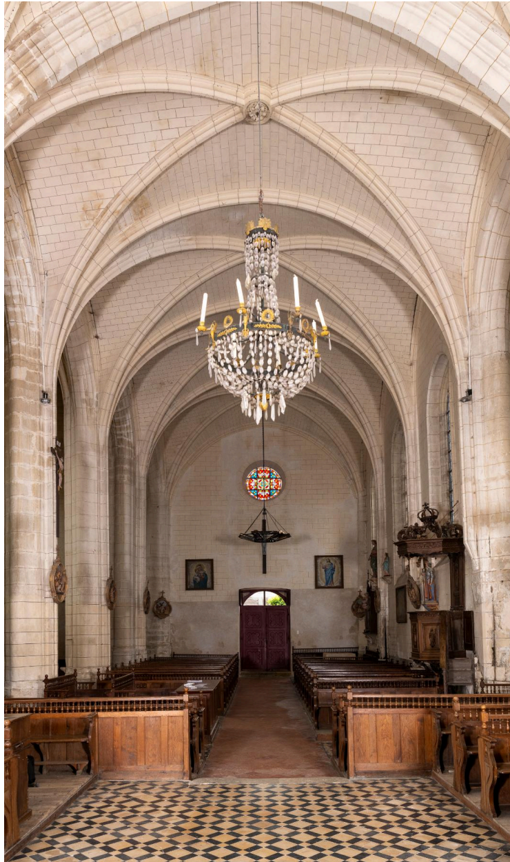
Vue générale vers la nef.