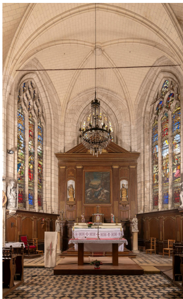
Vue générale du sanctuaire. IVR32_20226000553NUCA