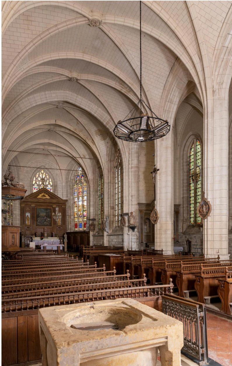
Vue générale du vaisseau central vers le bas-côté sud.