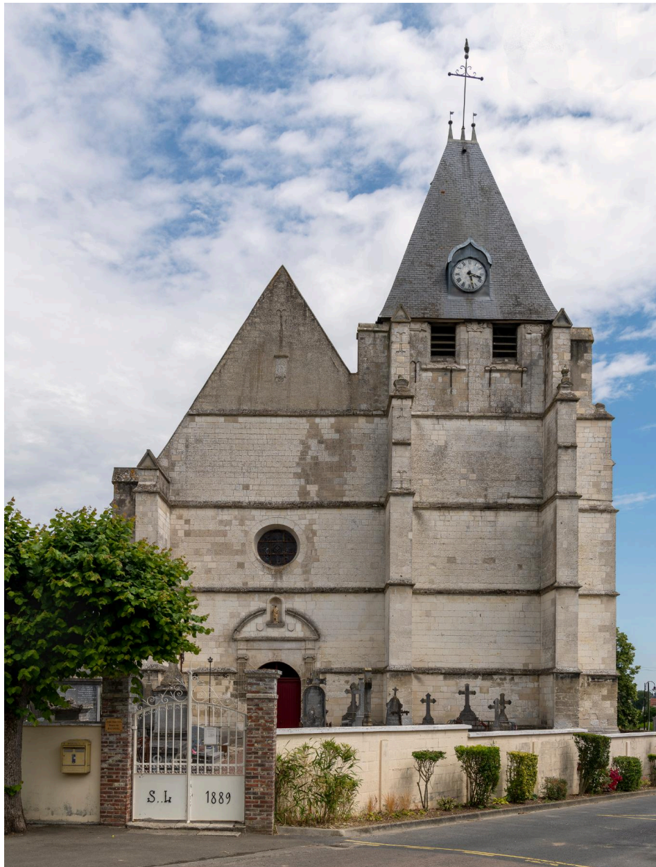
Vue générale de la façade occidentale avec le cimetière.