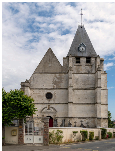
Vue générale de la façade occidentale avec le cimetière. IVR32_20226000552NUCA