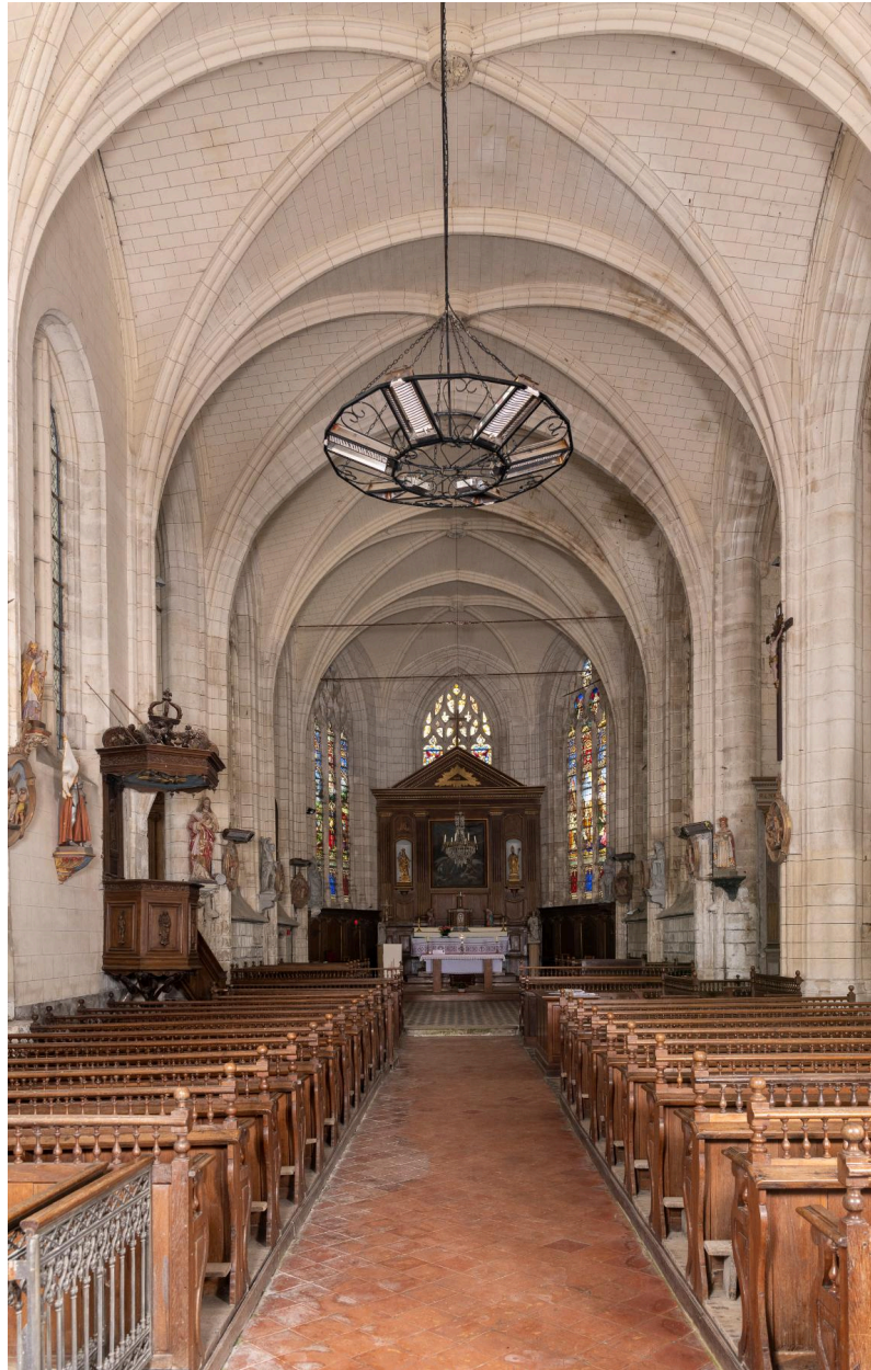
Vue générale vers le chœur.