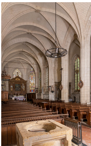
Vue générale du vaisseau central vers le bas-côté sud. IVR32_20226000573NUCA