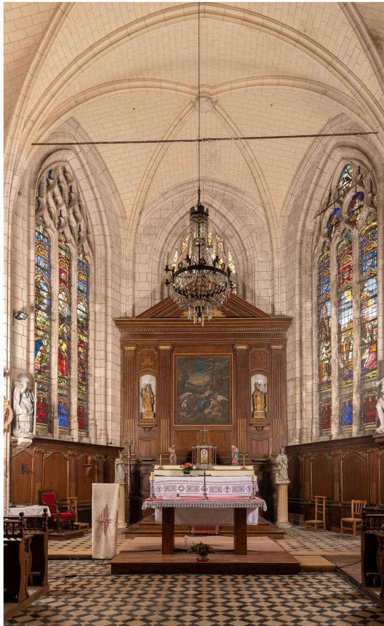
Vue générale du sanctuaire.