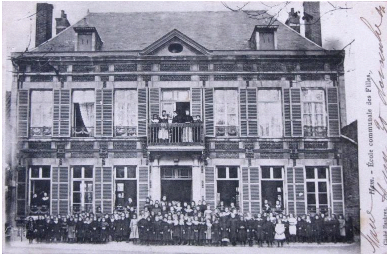
L'ancienne école de filles, cliché Haubrex, carte postale, début 20e siècle (Coll. Cercle Cartophile de Ham).