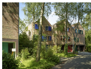
Maisons hollandaises (bande de trois maison) en léger retrait de l'allée Chanteclerc. L'alignement