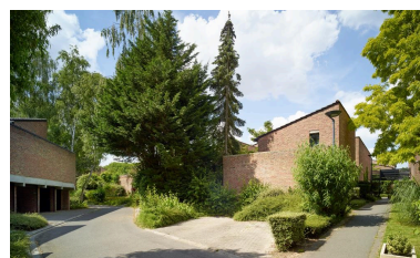
Maisons à patio. Les volumes bâtis et les sinuosités des venelles épousent le léger relief du terrain. Architecture et végétation sont intimement mêlées et composent un paysage original.