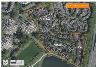
Les trois tranches opérationnelles de l'ilot 7. IVR32_20235905034NUDA