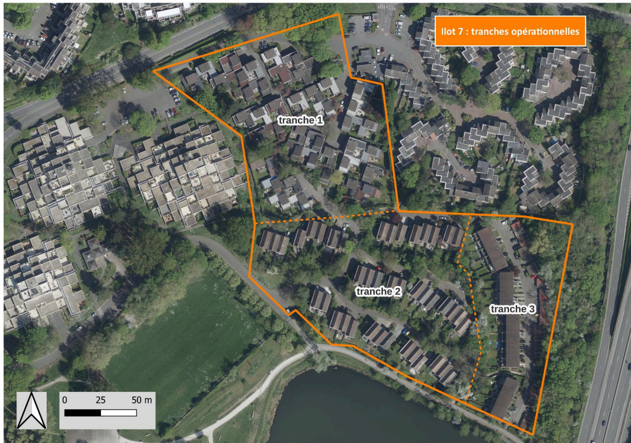
Les trois tranches opérationnelles de l'ilot 7.