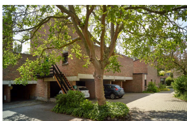
Maisons à patio. Les maisons sur garage, avec leur stationnement couvert, permettent de dissimuler