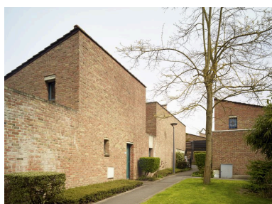
Maisons à patio de l'allée Chardin. Venelles et placettes arborées serpentent entre les habitations qui