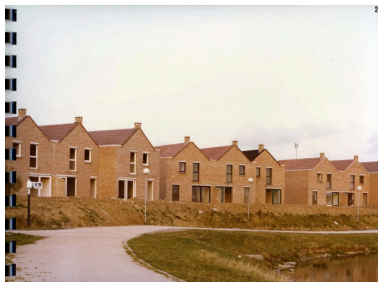
Maisons hollandaises (tranche 2) depuis la rive du lac des Espagnols. Photographie, 1978 (AC Villeneuve-d'Ascq ; 16W3). IVR32_20215900450NUCA