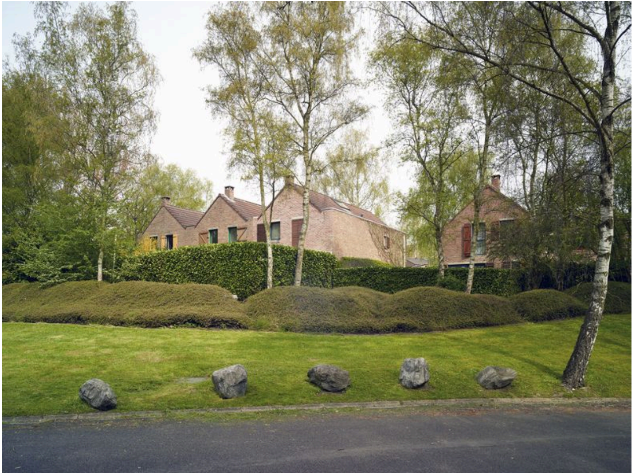
Maisons hollandaises vues depuis l'allée Chanteclerc. La position surélevée des jardins et la végétalisation de la pente du talus protègent de la vue des passants.