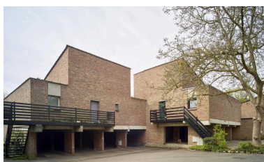
Maisons à patio. L'allée Chardin aboutit en placette, desservant les maisons sur garage, desservies par des escaliers et coursives. IVR32_20185900070NUCA