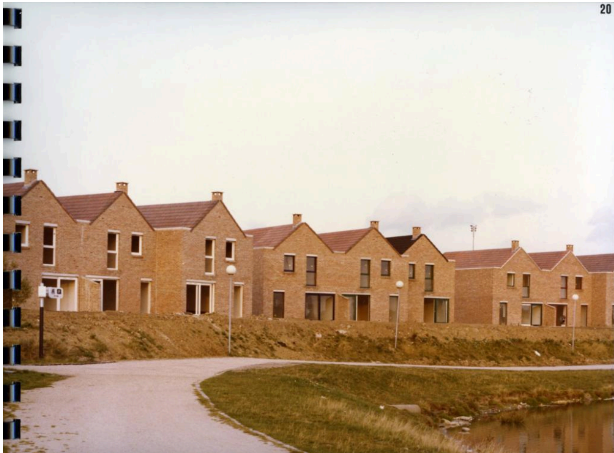
Maisons hollandaises (tranche 2) depuis la rive du lac des Espagnols. Photographie, 1978 (AC Villeneuve-d'Ascq ; 16W3).