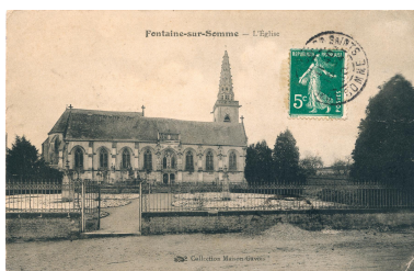
Fontaine-sur-Somme, l'église, carte postale, Édition Collection Maison Gavois, [ca 1910] (coll. part.). IVR32_20238000276NUCA