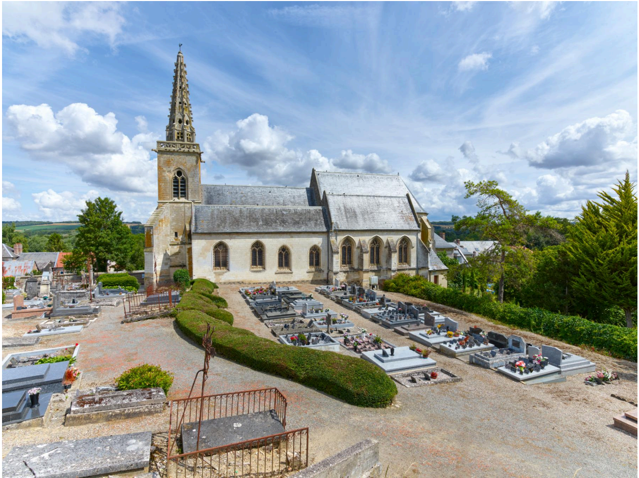
Vue sud du cimetière et de l'église.