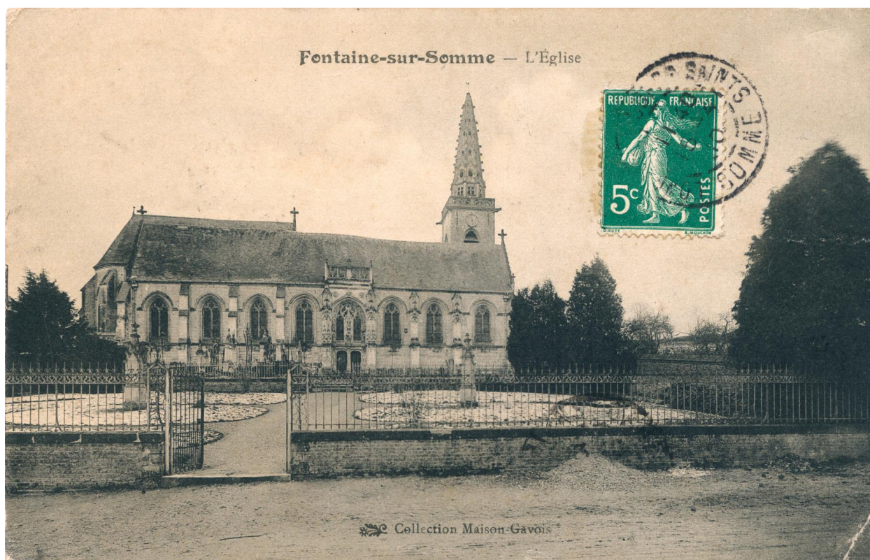
Fontaine-sur-Somme, l'église, carte postale, Édition Collection Maison Gavois, [ca 1910] (coll. part.).