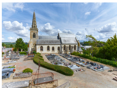
Vue sud du cimetière et de l'église.