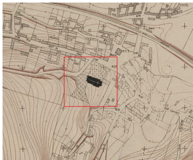
Topographie de Fontaine-sur-Somme, fonds de plan, Commissariat à la Reconstruction Immobilière, Feuille 1, 1942 (AD Somme ; 70W CP 39 2, ZH323)