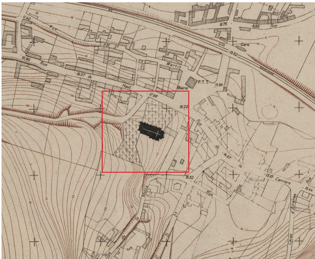
Topographie de Fontaine-sur-Somme, fonds de plan, Commissariat à la Reconstruction Immobilière, Feuille 1, 1942 (AD Somme ; 70W CP 39 2, ZH323)