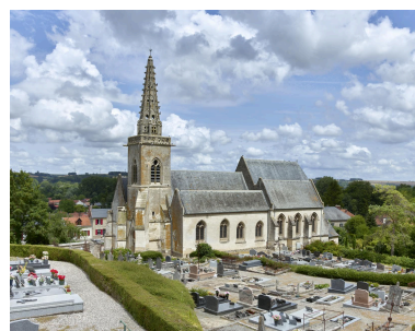
Vue sud-ouest du cimetière et de l'église. IVR32_20238000329NUCA