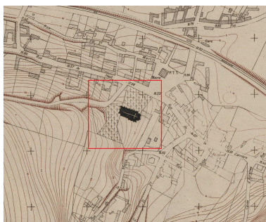
Topographie de Fontaine-sur-Somme, fonds de plan, Commissariat à la Reconstruction Immobilière, Feuille 1, 1942 (AD Somme ; 70W CP 39 2, ZH323) IVR32_20238005202NUCA