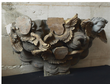
Elément nuées et angelots. IVR31_20106207287NUCA