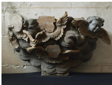
Elément nuées et angelots. IVR31_20106207286NUCA