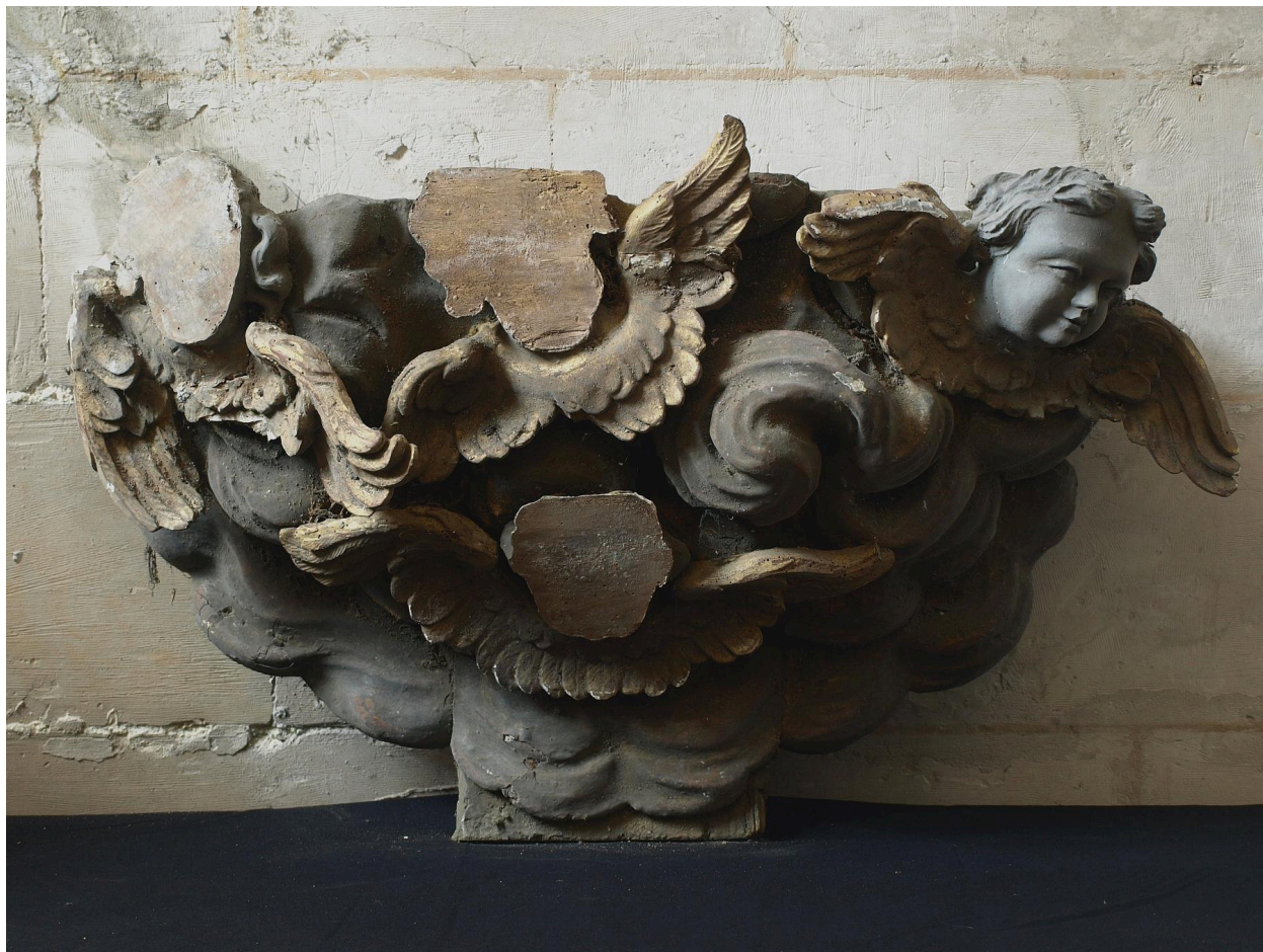
Elément nuées et angelots.