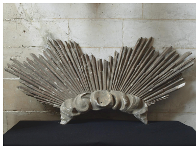
Rayons de gloire. IVR31_20106207293NUCA