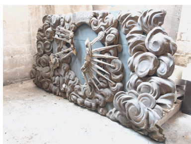
Elément, nuées et rayons. IVR31_20106207294NUCA