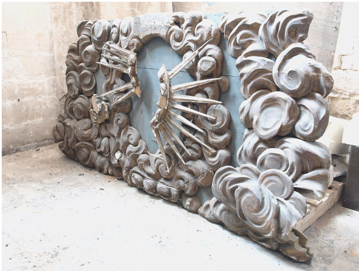
Elément, nuées et rayons.