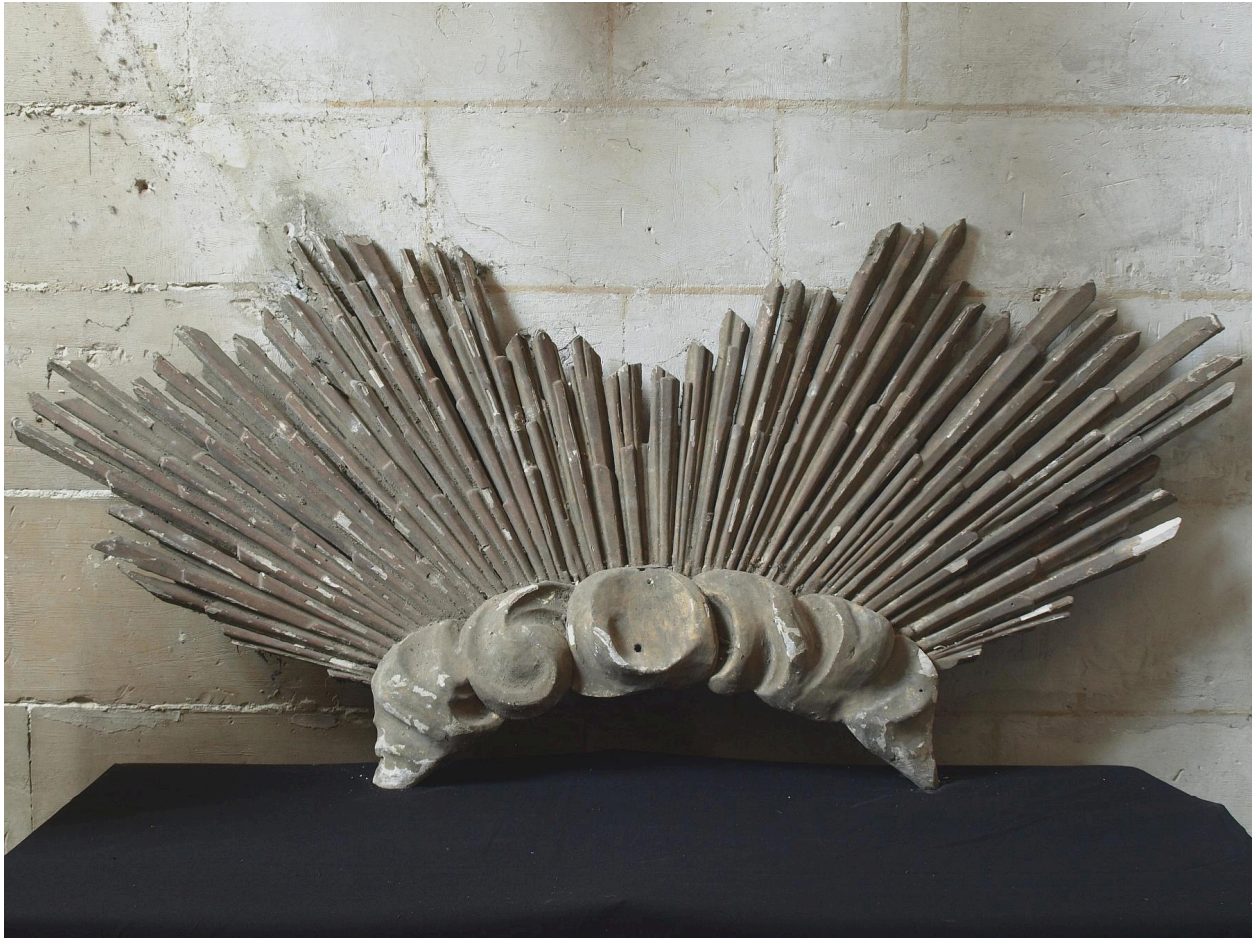
Rayons de gloire.