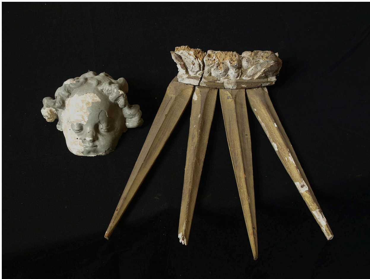
Tête d'angelot et rayons.