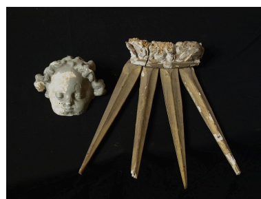
Tête d'angelot et rayons. IVR31_20106207292NUCA