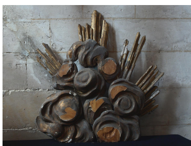
Elément, nuées. IVR31_20106207290NUCA