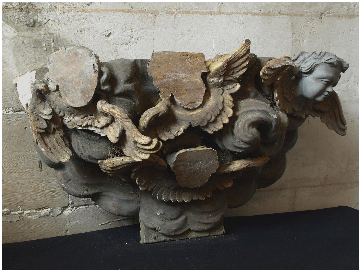
Elément nuées et angelots.