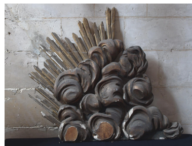
Elément, nuées.