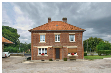
Maison d'habitation, vue prise depuis le sud. IVR32_20238000472NUCA