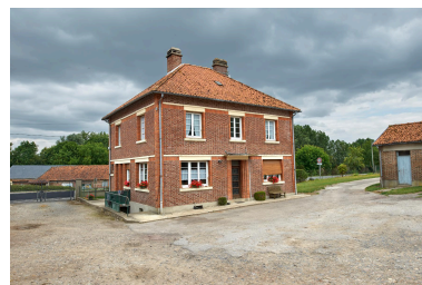
Maison d'habitation, vue prise depuis le sud-ouest. IVR32_20238000471NUCA