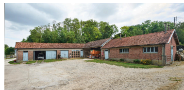
Ancienne porcherie, poulailler. Vue prise depuis le nord-ouest.