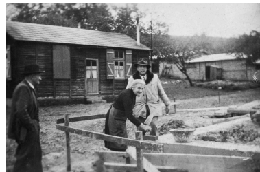
Pose de la première pierre de la reconstruction de la ferme, baraquement en arrière plan. Photographie, [ca 1950] (coll. part.).

Repro. Archives départementales de la Somme IVR32_20238005212NUCA