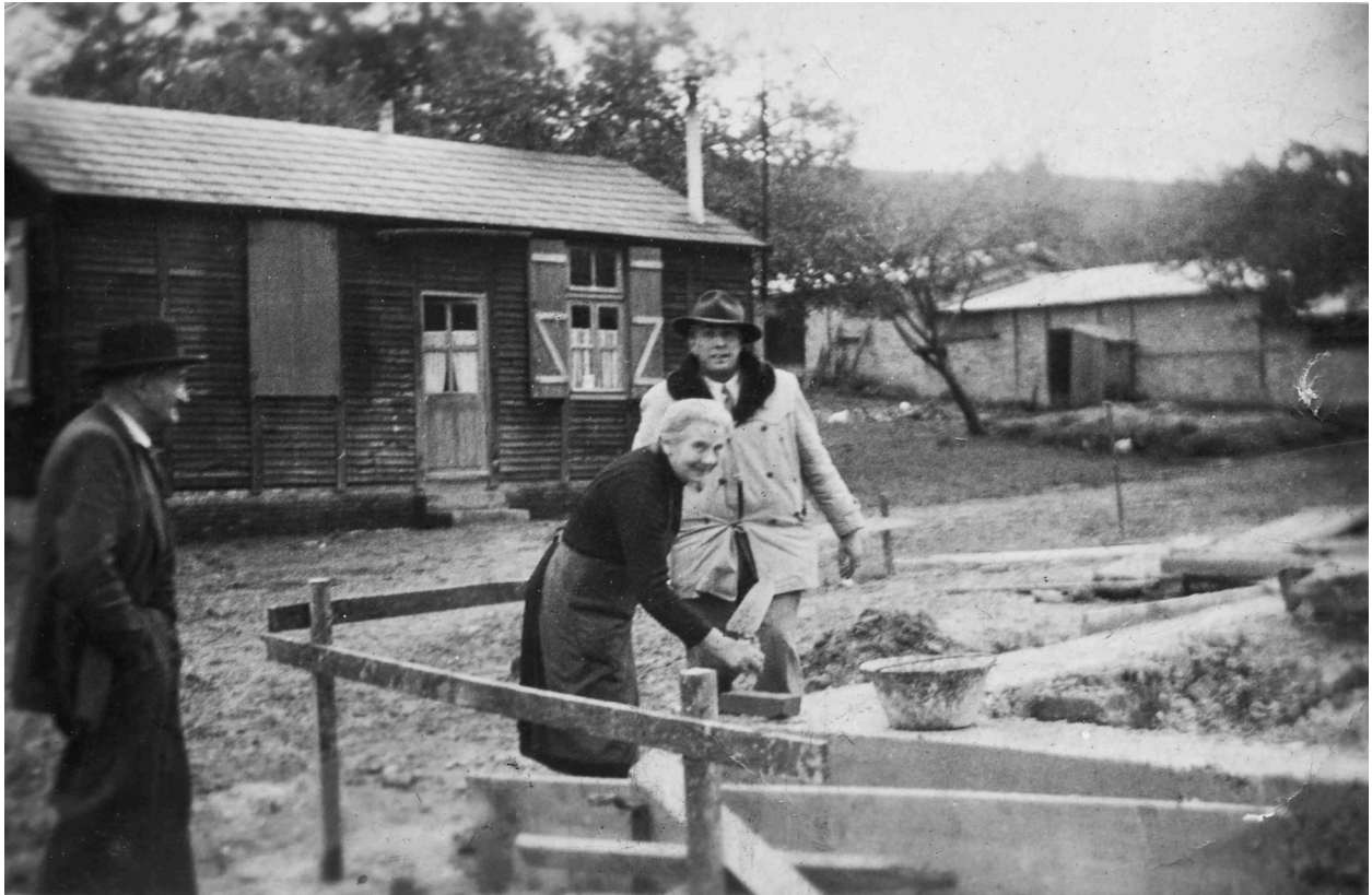
Pose de la première pierre de la reconstruction de la ferme, baraquement en arrière plan. Photographie, [ca 1950].