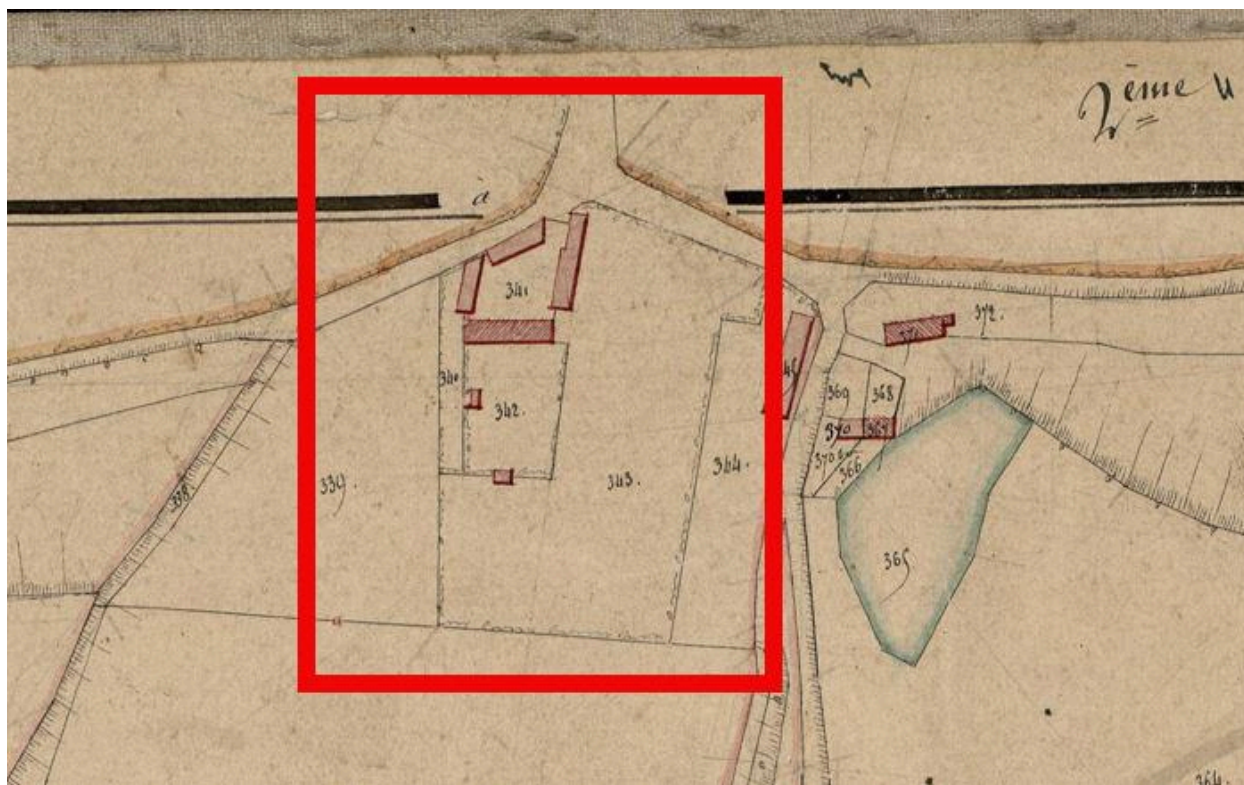
Plan de la ferme, extrait du plan parcellaire, dit cadastre napoléonien, section B2, 1833 (AD Somme ; 3 P 3557).