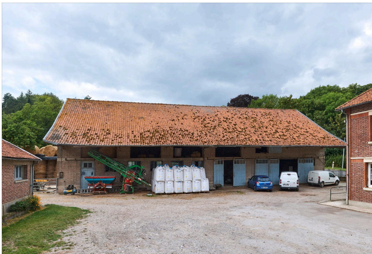
Ancienne étable, vue prise depuis l'est.