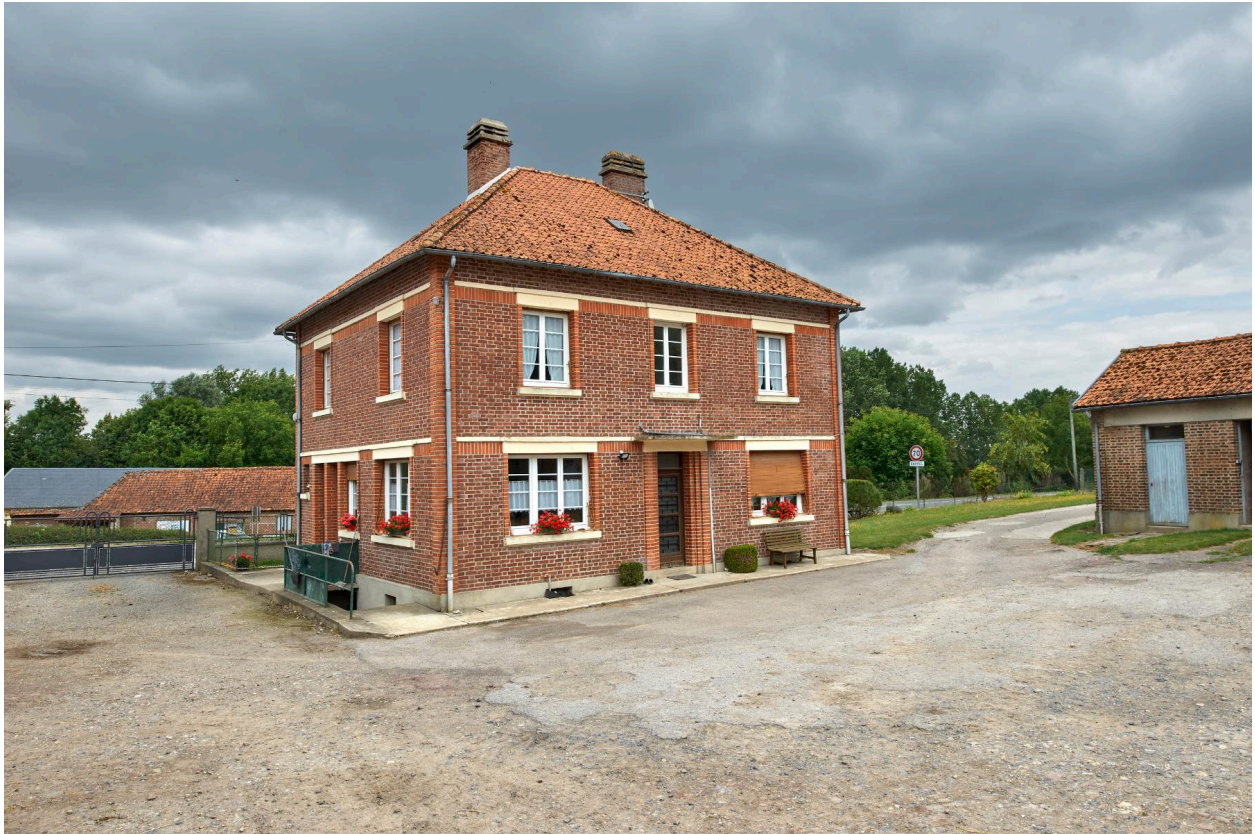
Maison d'habitation, vue prise depuis le sud-ouest.