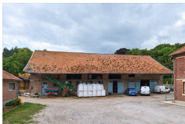
Ancienne étable, vue prise depuis l'est.