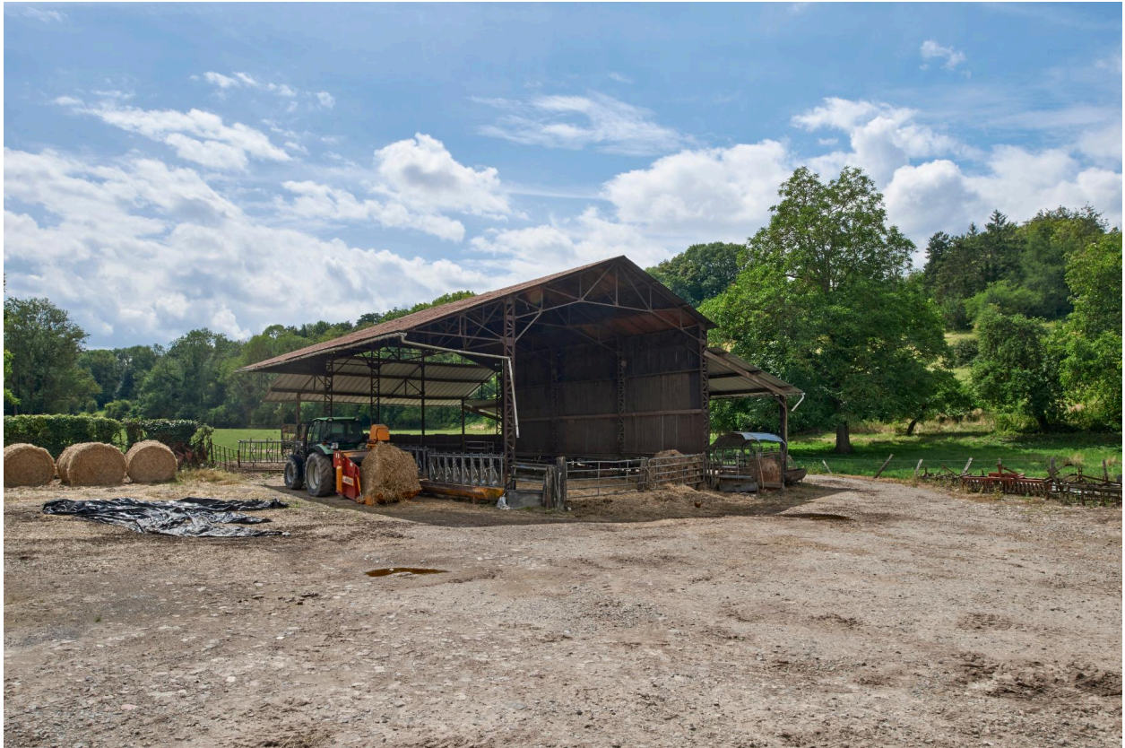
Hangar agricole, vue prise depuis le nord.