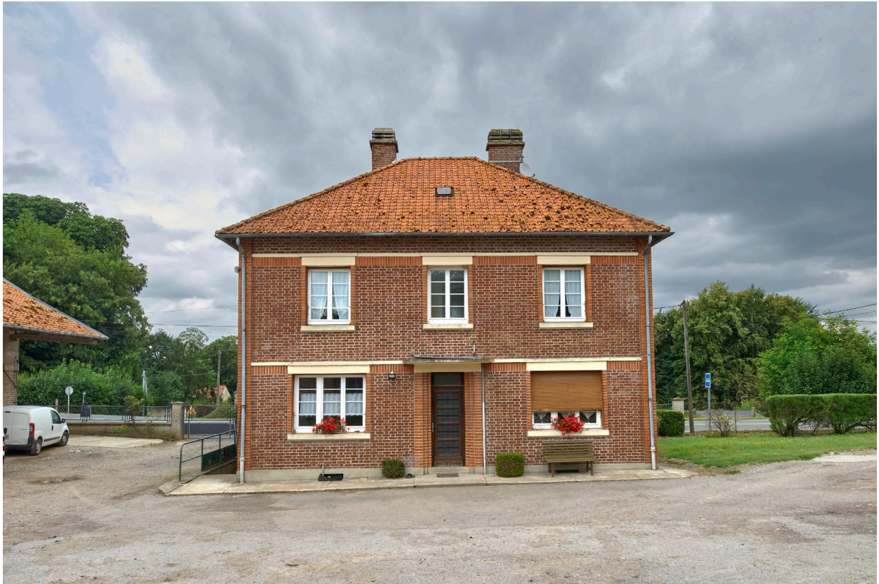
Maison d'habitation, vue prise depuis le sud.