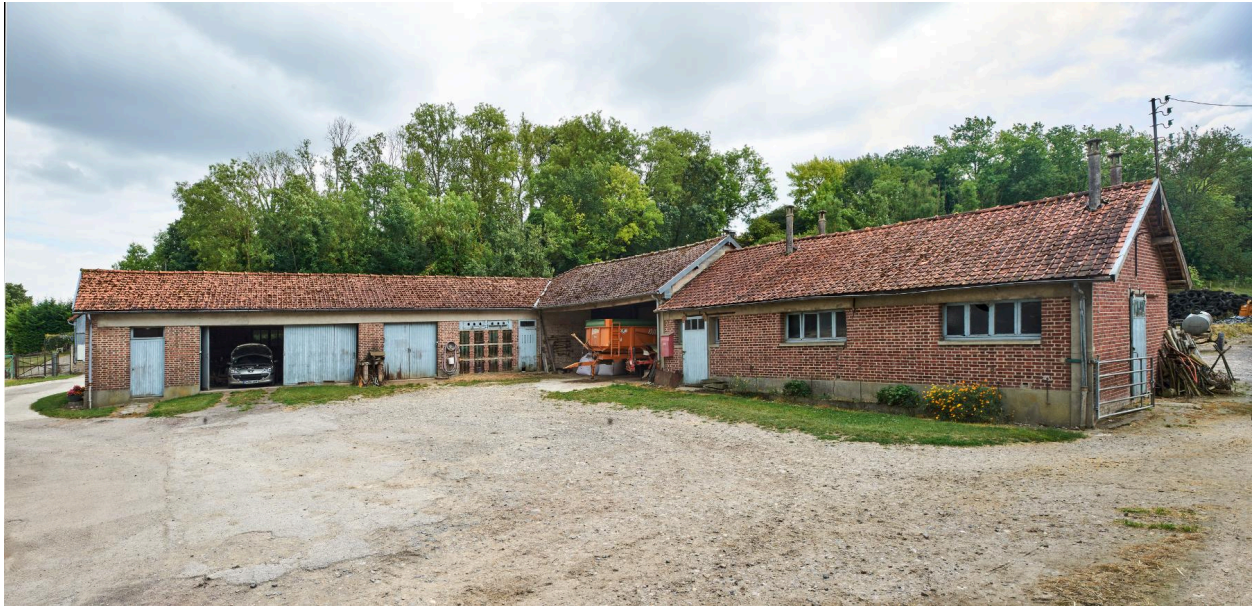
Ancienne porcherie, poulailler. Vue prise depuis le nord-ouest.