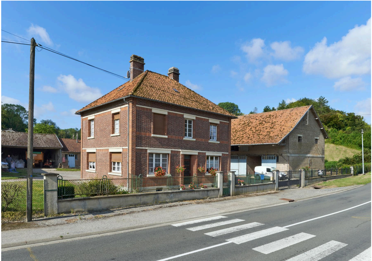
Maison d'habitation et bâtiments agricoles, vue prise depuis le nord.