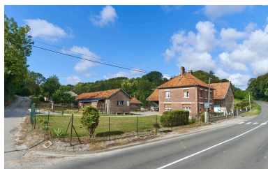
Vue générale de la ferme, prise depuis le nord-est. IVR32_20238000469NUCA

IVR32_20238000477NUCA