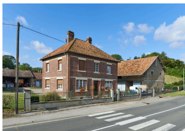
Maison d'habitation et bâtiments agricoles, vue prise depuis le nord.