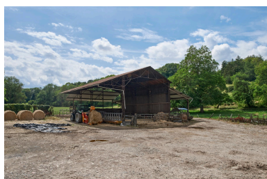
Hangar agricole, vue prise depuis le nord. IVR32_20238000476NUCA