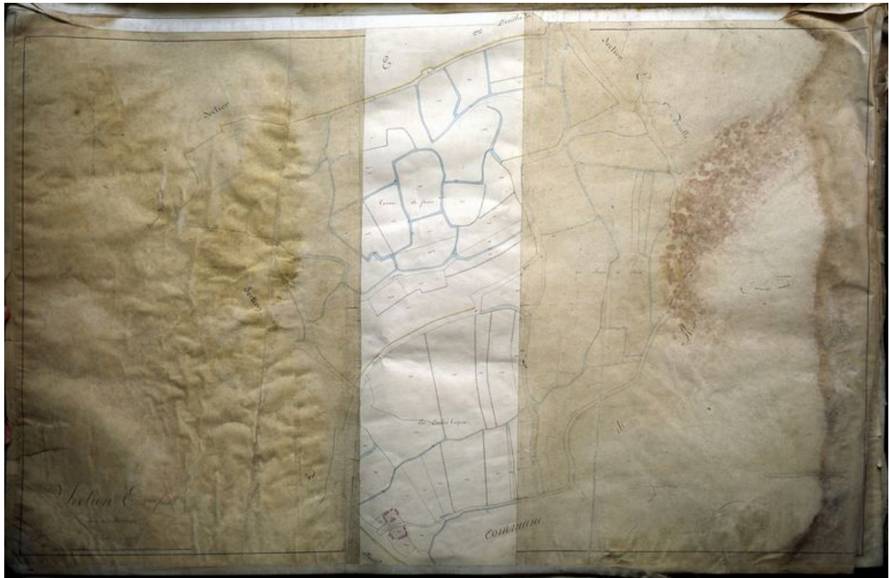
Vue générale du hameau en 1828.