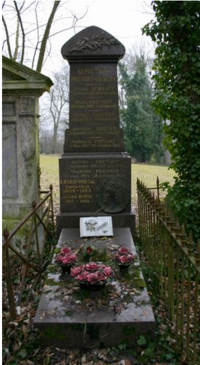
Stèle à fronton triangulaire.