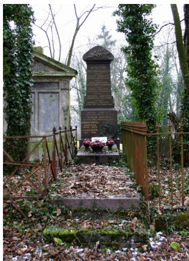
Vue générale. IVR22_20098000688NUCA