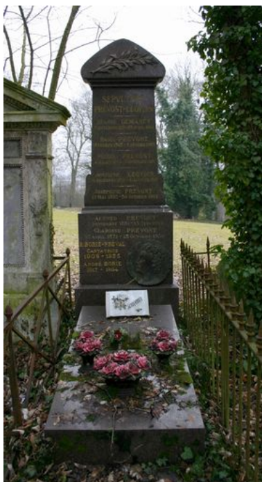
Stèle à fronton triangulaire.