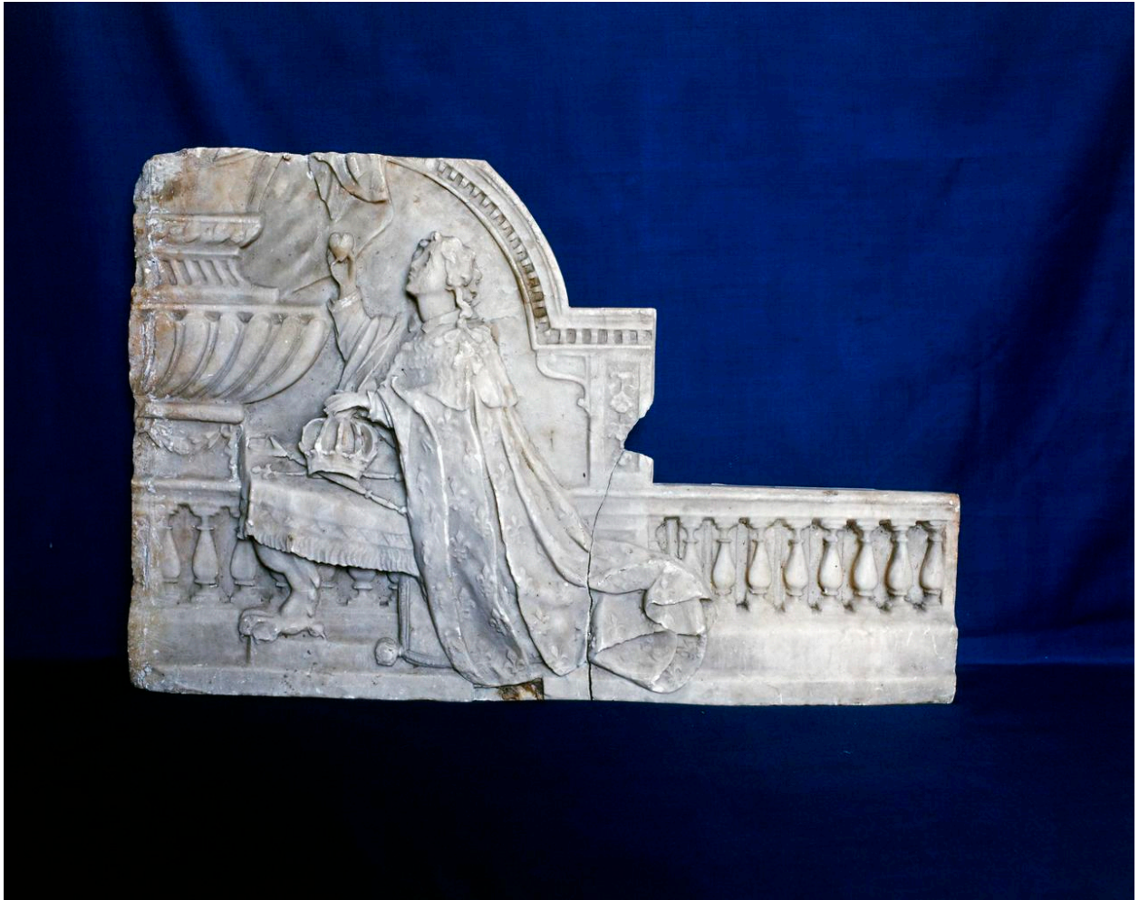
Détail, haut-relief : Louis XIV offrant un coeur à Notre-Dame de Boulogne.