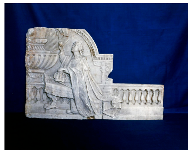
Détail, haut-relief : Louis XIV offrant un cœur à Notre-Dame de Boulogne.