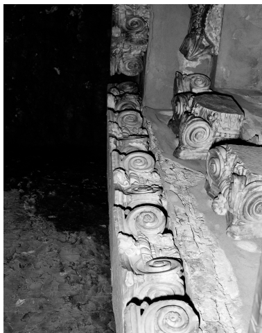
Chapiteaux, vue d'ensemble.