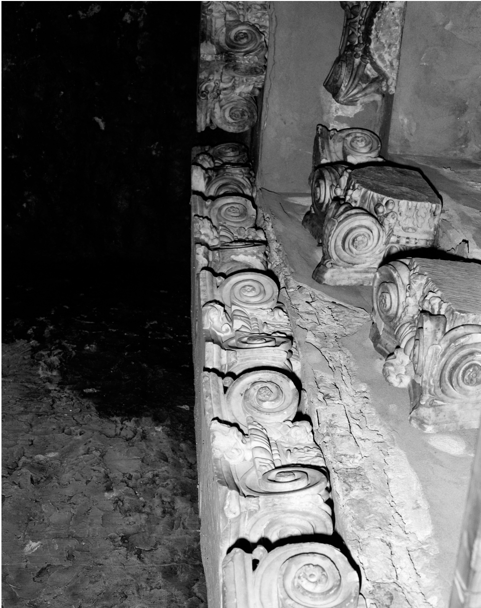
Chapiteaux, vue d'ensemble.