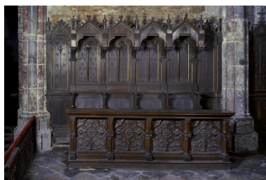
Vue de la rangée nord des stalles, appartenant au décor.