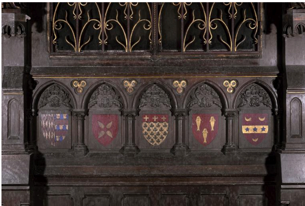
Détail de la partie centrale de l'élévation sud des lambris, abritant les reliquaires et saintes huiles.