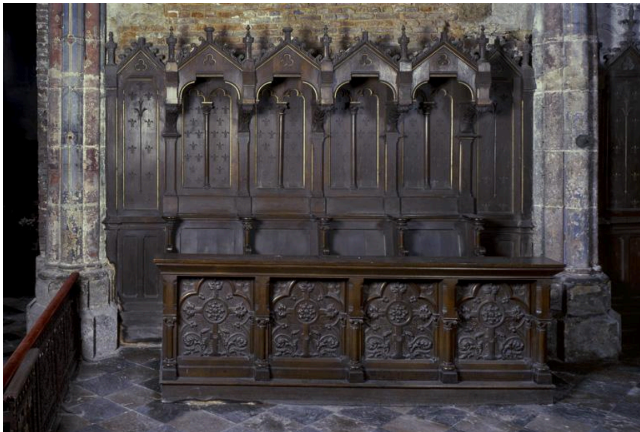
Vue de la rangée nord des stalles, appartenant au décor.