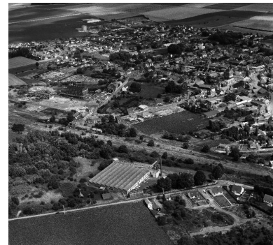
Vue aérienne, flanc ouest.