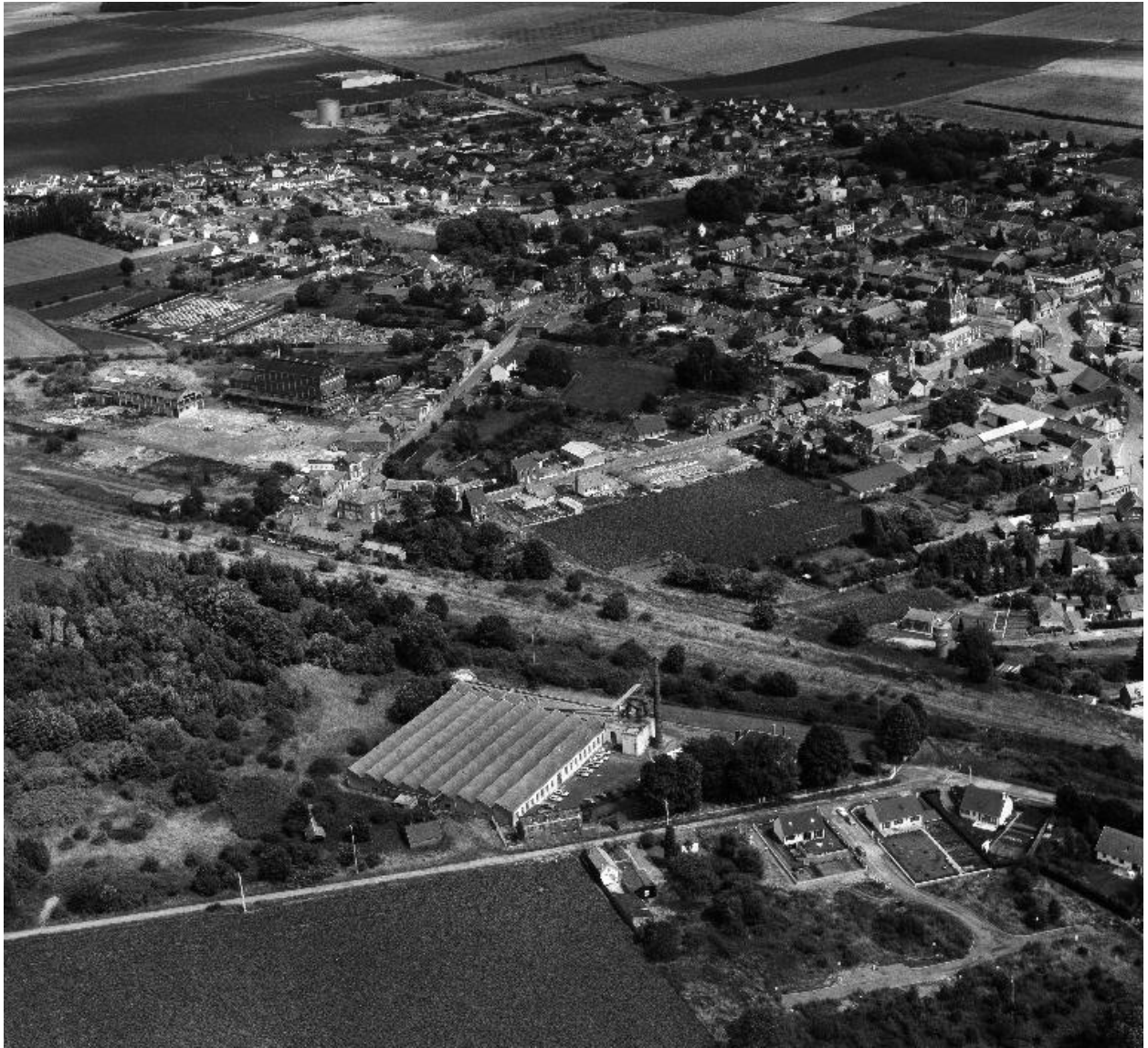
Vue aérienne, flanc ouest.