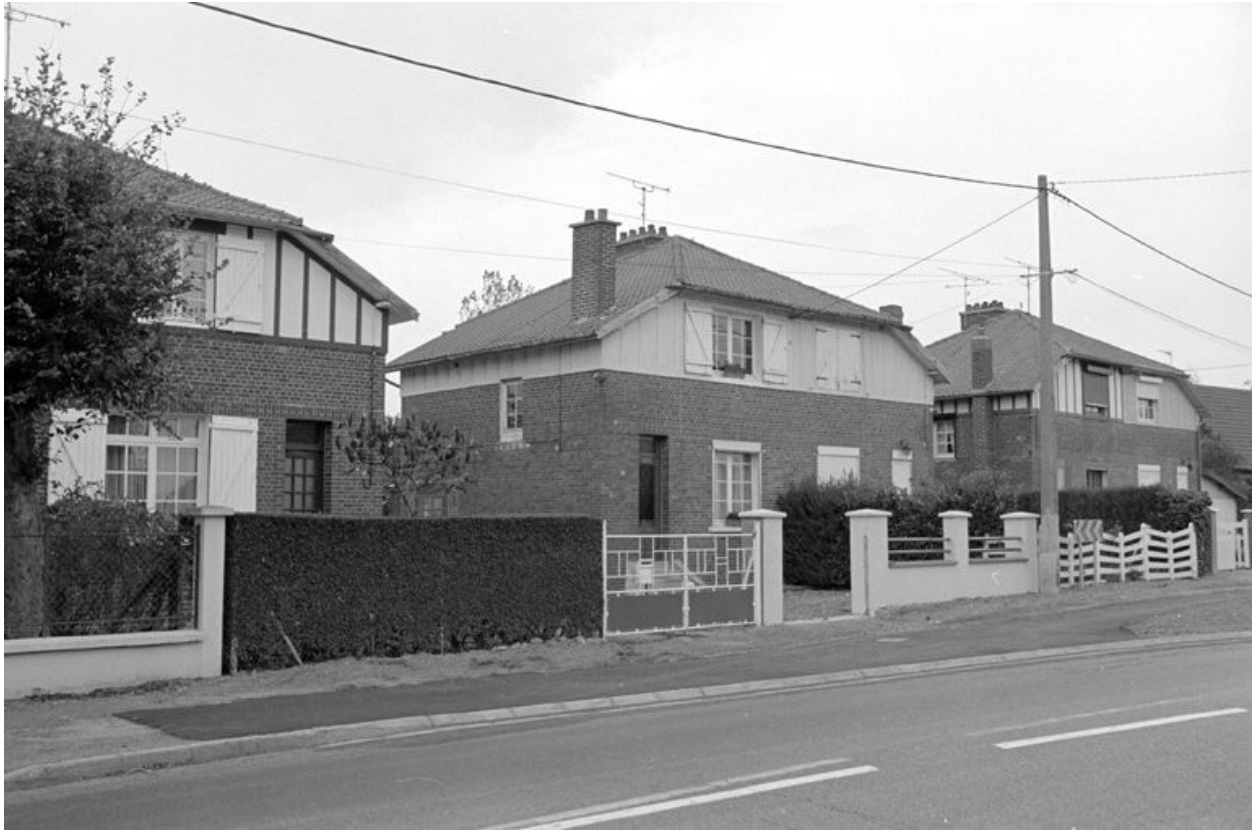
Logement d'ouvriers, vue d'ensemble.