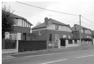
Logement d'ouvriers, vue d'ensemble. IVR22_19908001235Z