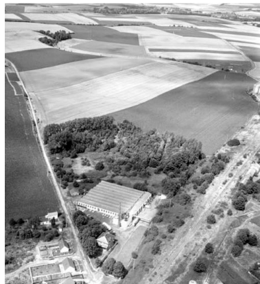
Vue aérienne, flanc sud.