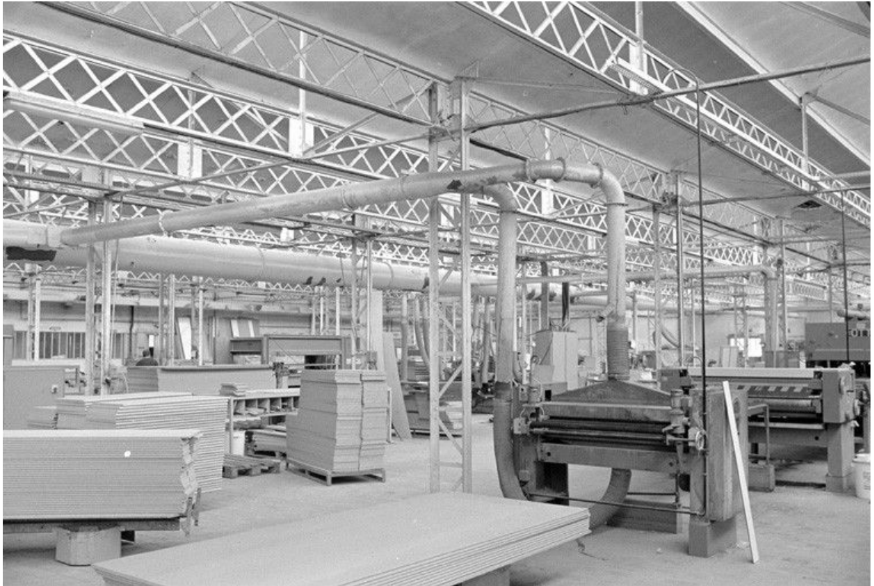
Atelier de fabrication, vue intérieure.