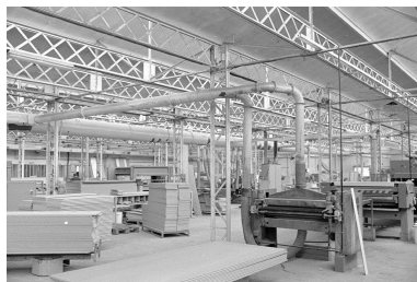
Atelier de fabrication, vue intérieure.