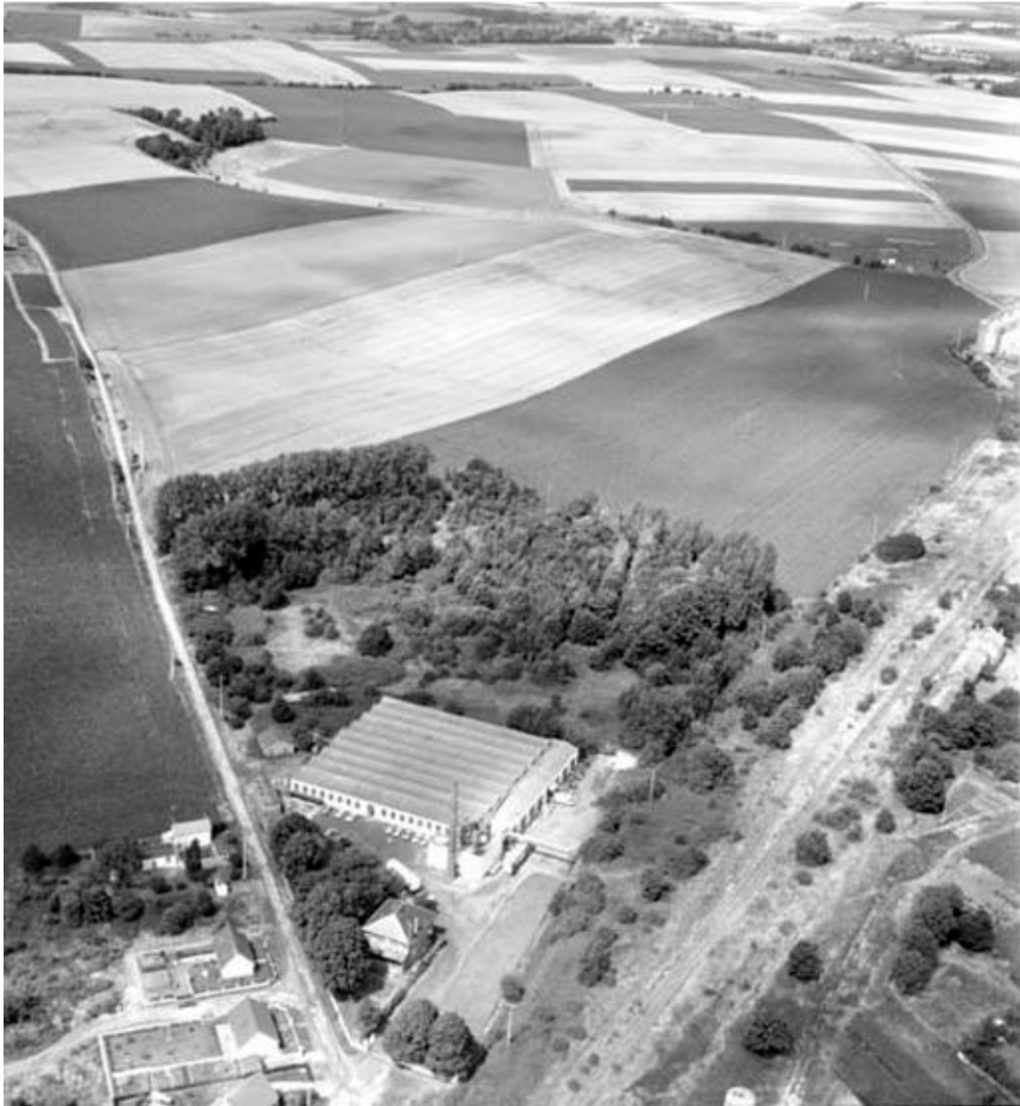
Vue aérienne, flanc sud.