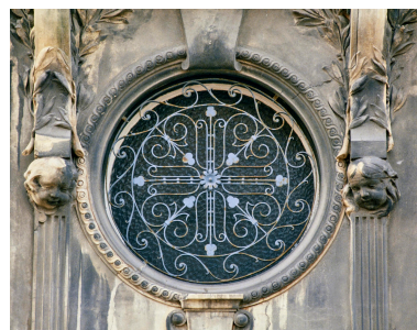
Oculus. IVR31_19826200216ZA