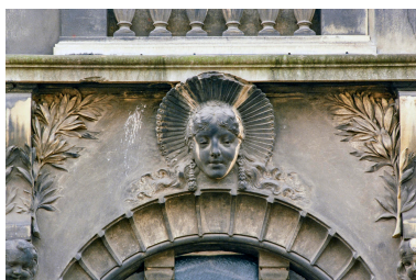
Façade sur voie, détail : haut-relief représentant une tête de boulonnaise. IVR31_19826200215ZA