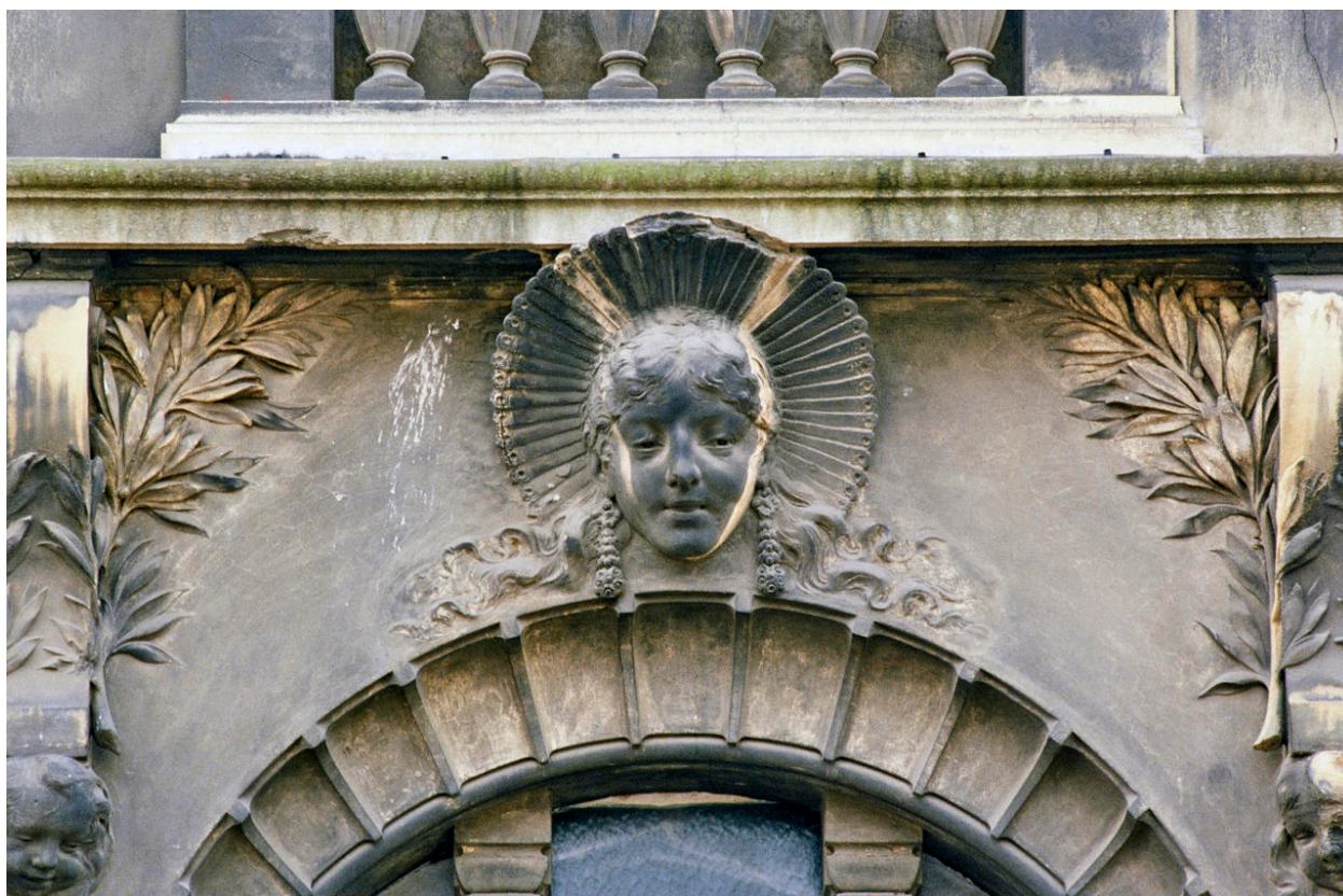
Façade sur voie, détail : haut-relief représentant une tête de boulonnaise.