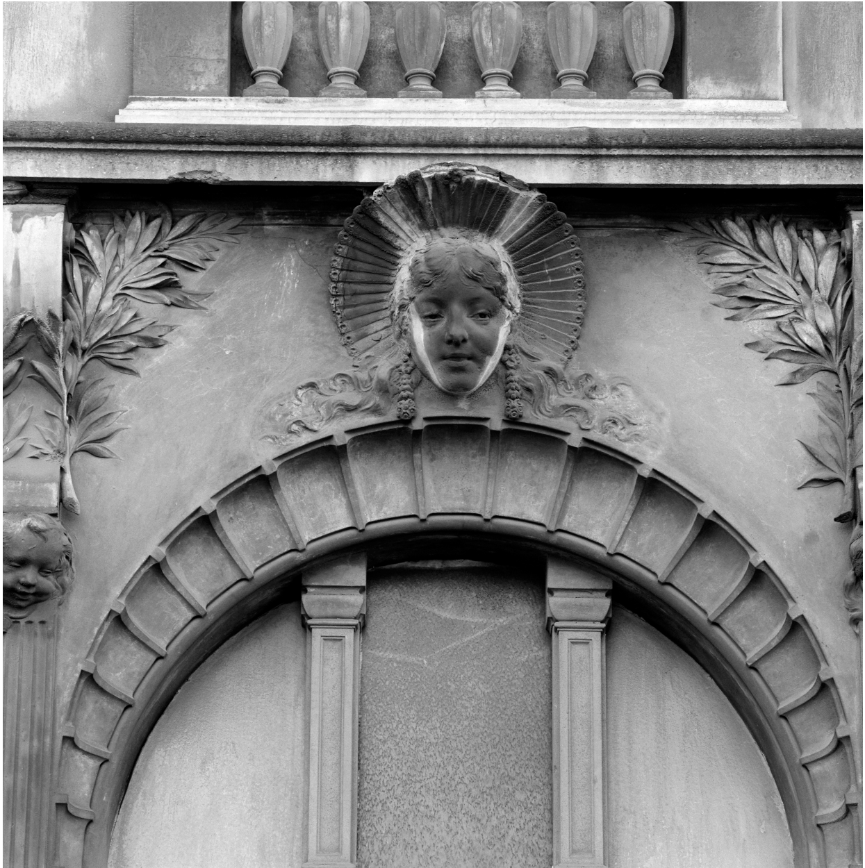
Façade sur voie, haut relief, tête de boulonnaise.