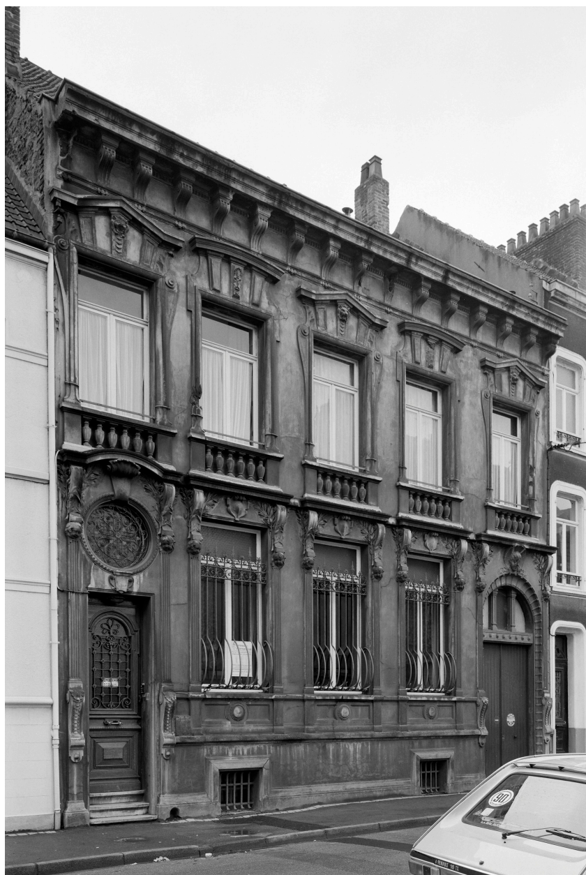
Vue générale sur voie.