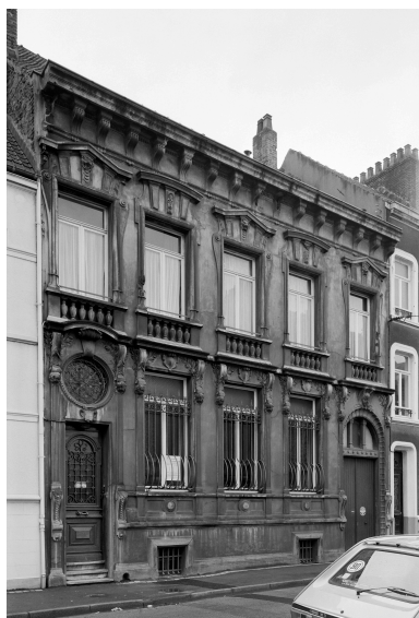
Vue générale sur voie. IVR31_19816204520X