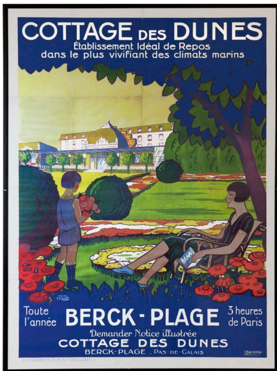
Affiche publicitaire pour le Cottage des Dunes.