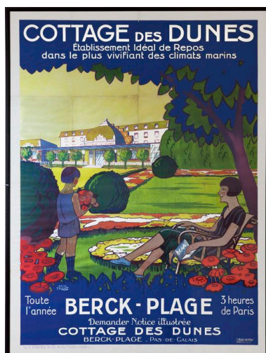
Affiche publicitaire pour le Cottage des Dunes.