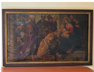
Vue générale IVR31_20106202300NUCA