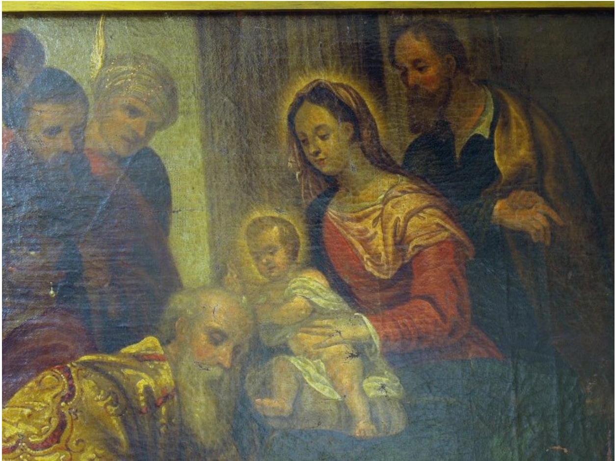
Vue de détail, Vierge et Enfant Jésus