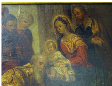
Vue de détail, Vierge et Enfant Jésus IVR31_20106201763NUCA