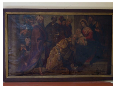
Vue générale IVR31_20106202301NUCA