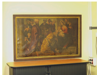
Vue générale IVR31_20106202298NUCA