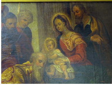
Vue de détail, Enfant Jésus IVR31_20106202302NUCA