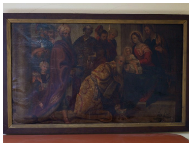
Vue générale IVR31_20106201762NUCA