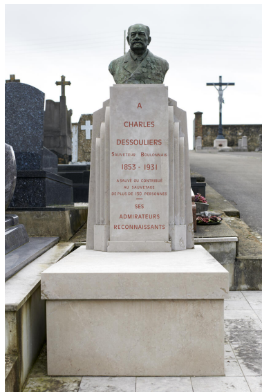
Vue générale en 2024. IVR32_20246200090NUCA