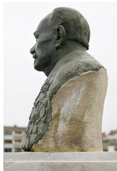
Vue de détail du buste de profil et de la signature du sculpteur.