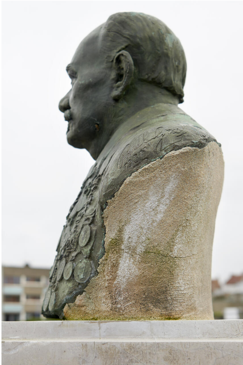
Vue de détail du buste de profil et de la signature du sculpteur.