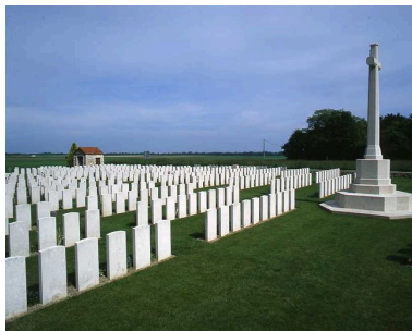
Vue de la nécropole.