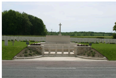
Vue générale. IVR22_20050200511NUCA