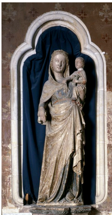
Vue générale, de face. IVR22_20010202738XA