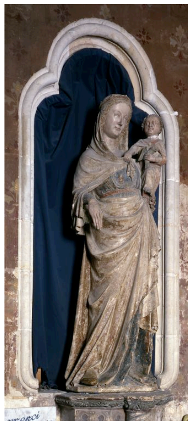
Vue générale, de trois-quarts.