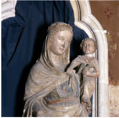
Détail de la Vierge portant l'Enfant, de trois-quarts.