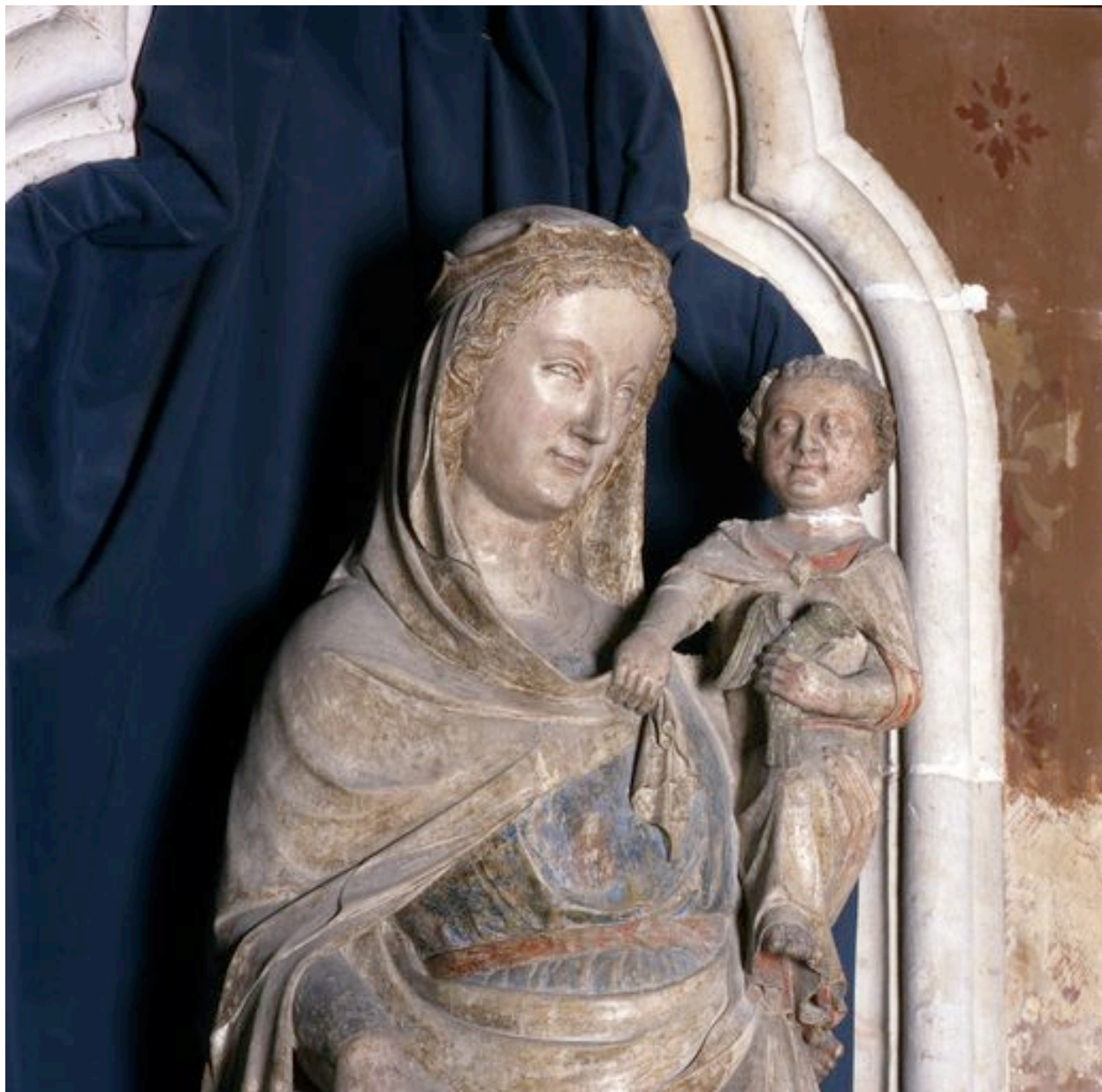
Détail de la Vierge portant l'Enfant, de trois-quarts.