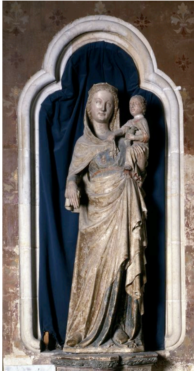
Vue générale, de face.