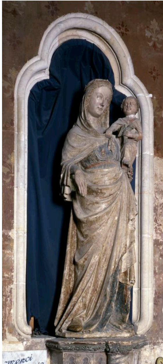
Vue générale, de trois-quarts.