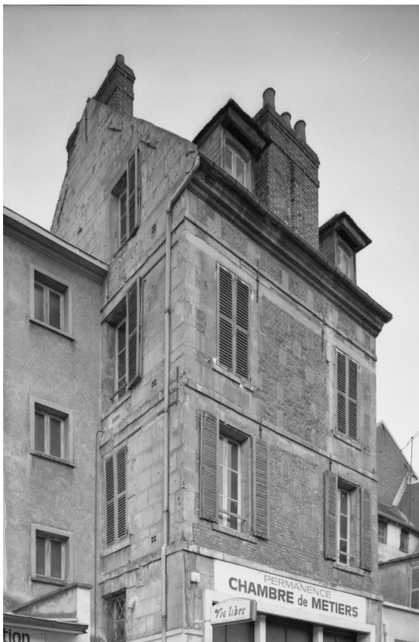
Elévation antérieure et latérale gauche.