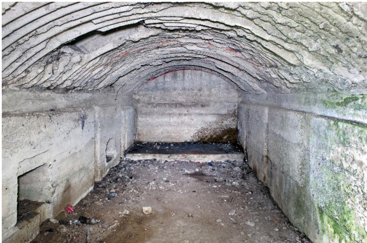
Salle sud, vue générale vers le sud