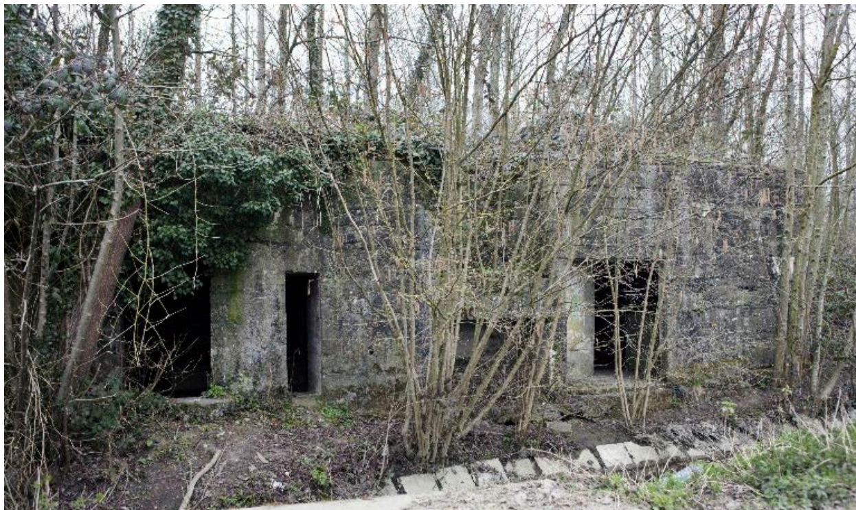
Elévation ouest : A gauche les deux entrées de la salle sud, à droite l'entrée de la salle nord. Au premier plan le ruisseau dit courant Brogniart