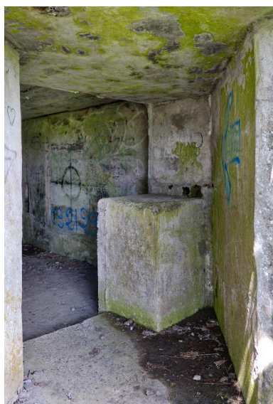
Salle nord, vue depuis l'entrée