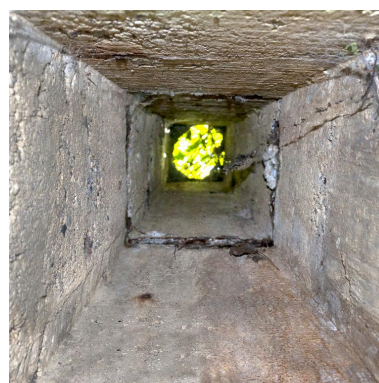
Salle sud : la cheminée en vue zénithale