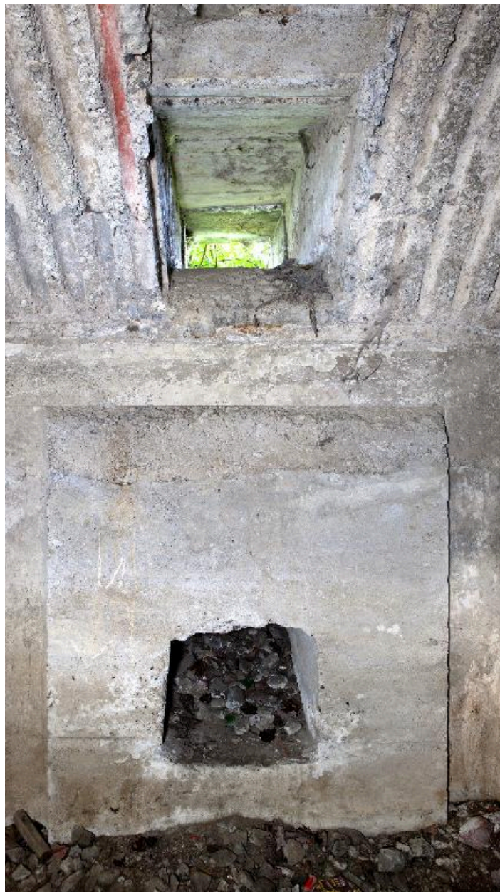
Salle sud niche surmontée d'une baie