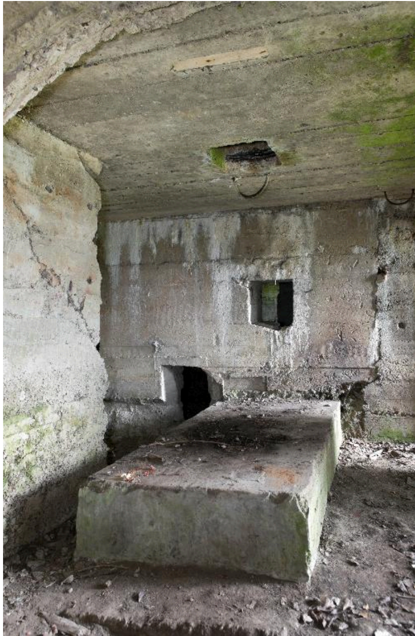
Salle sud : Massif bétonné du moteur diesel. Au fond, deux des quatre ouvertures débouchant salle nord (passage de tuyaux ?). On remarque les anneaux métalliques au plafond et la cheminée d'évacuation des fumées