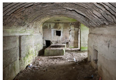
Vue générale de la salle sud, vers le nord