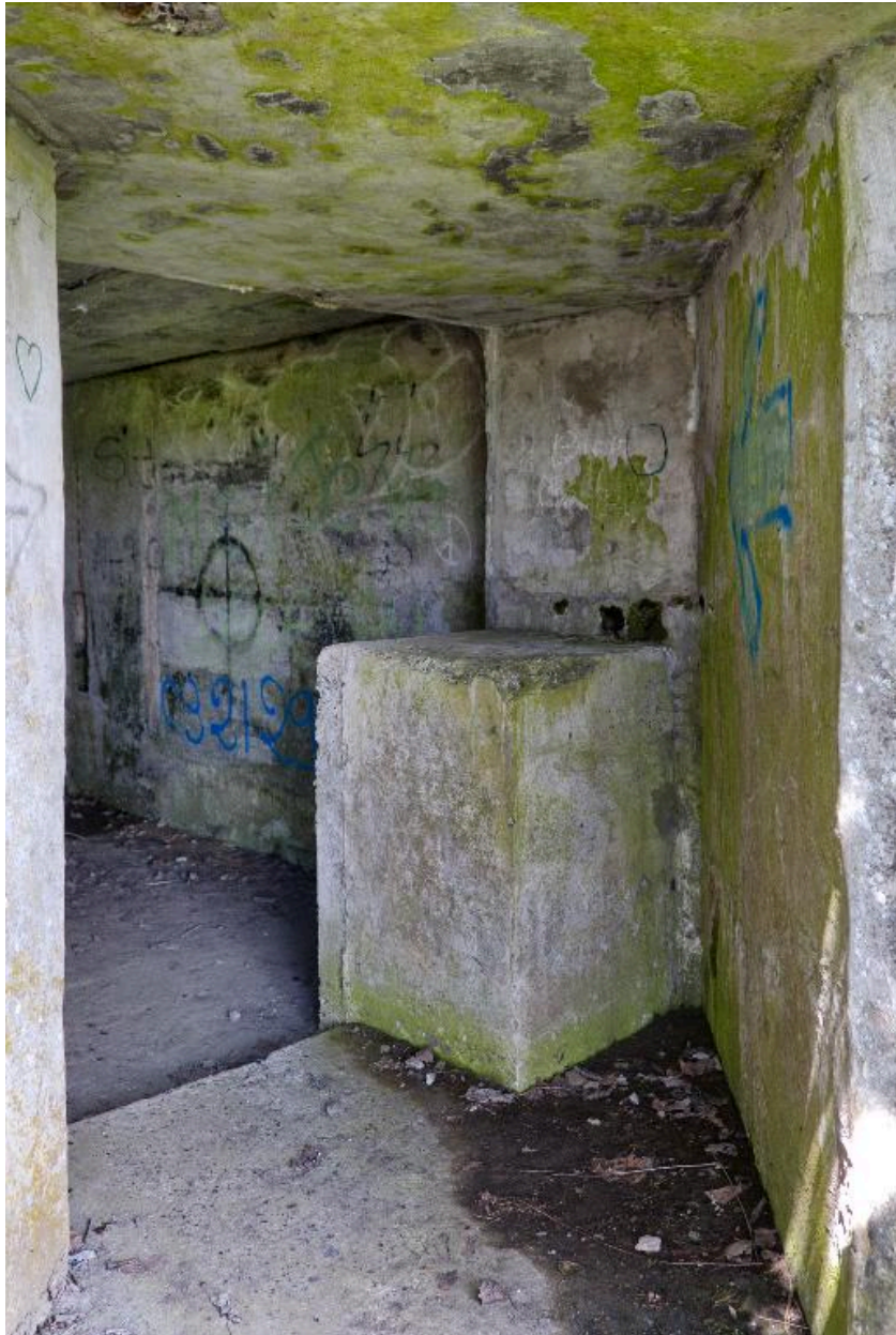
Salle nord, vue depuis l'entrée