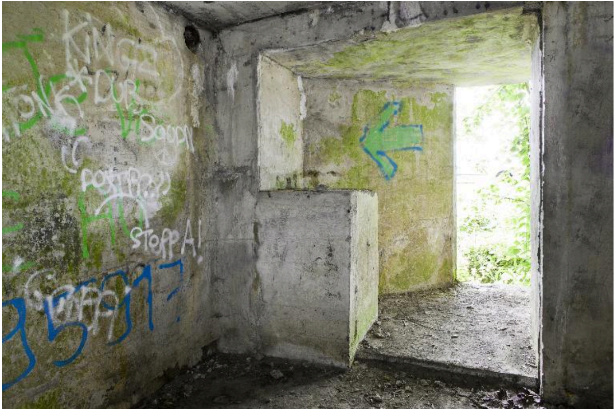
Salle nord. Vue vers l'entrée.