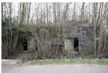
Elévation ouest : A gauche les deux entrées de la salle sud, à droite l'entrée de la salle nord. Au premier plan le ruisseau dit courant Brogniart