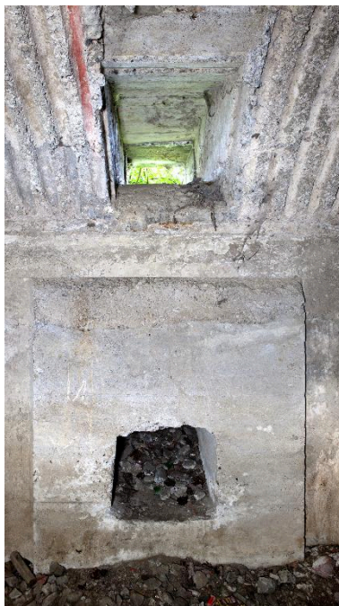
Salle sud niche surmontée d'une baie