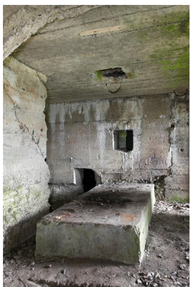
Salle sud : Massif bétonné du moteur diesel. Au fond, deux des quatre ouvertures débouchant salle nord (passage de tuyaux ?). On remarque les anneaux métalliques au plafond et la cheminée d'évacuation des fumées