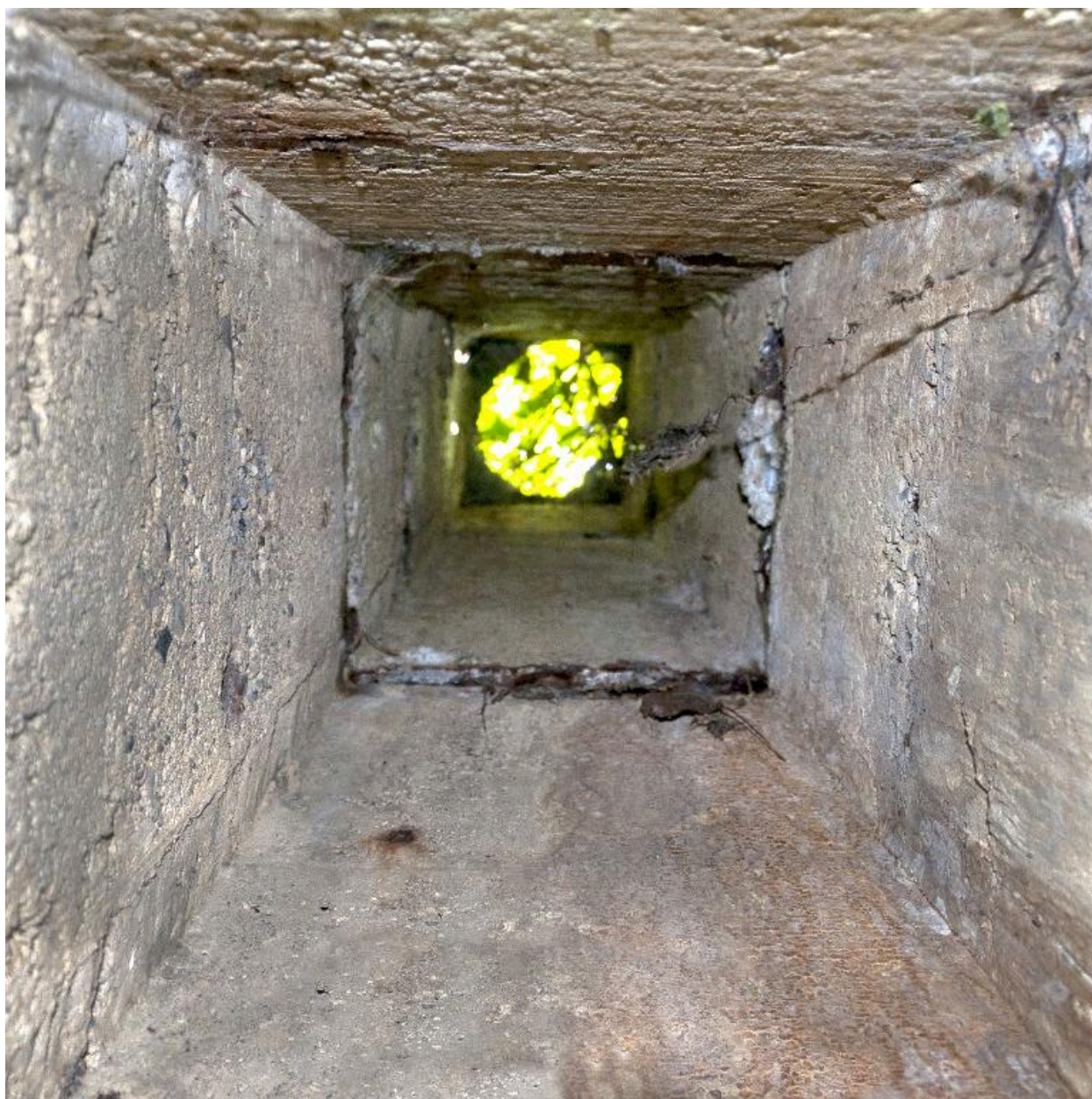
Salle sud : la cheminée en vue zénithale