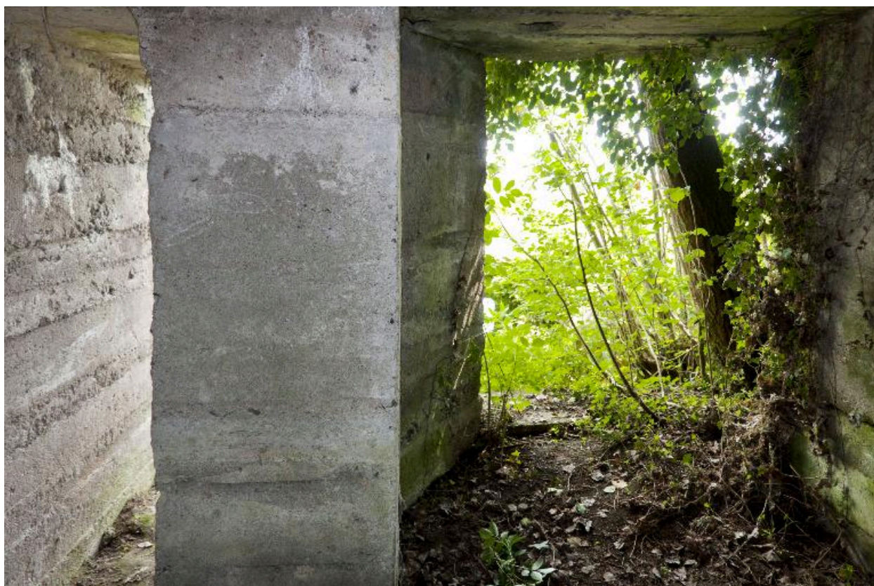
Salle sud, vers les deux entrées