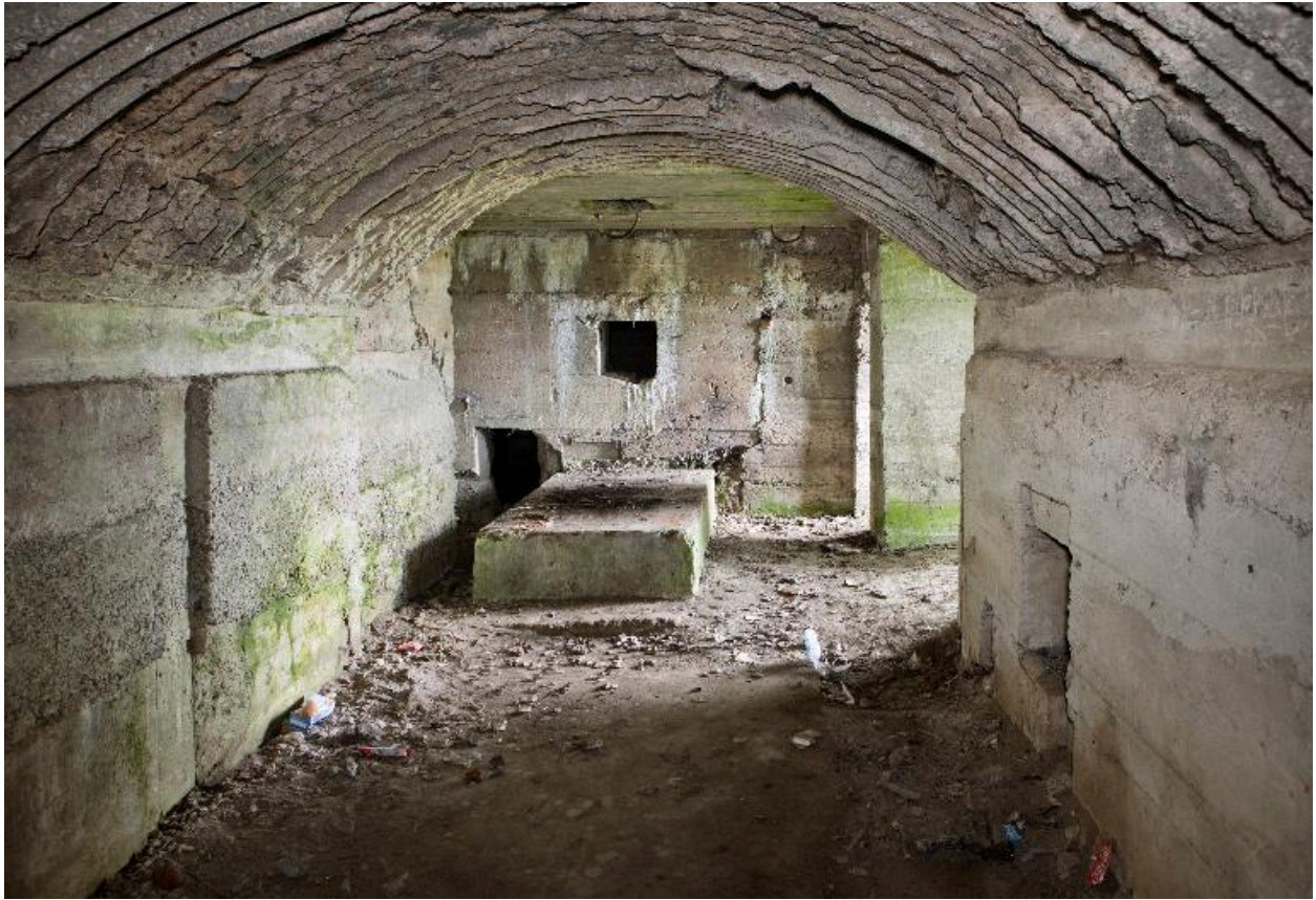
Vue générale de la salle sud, vers le nord