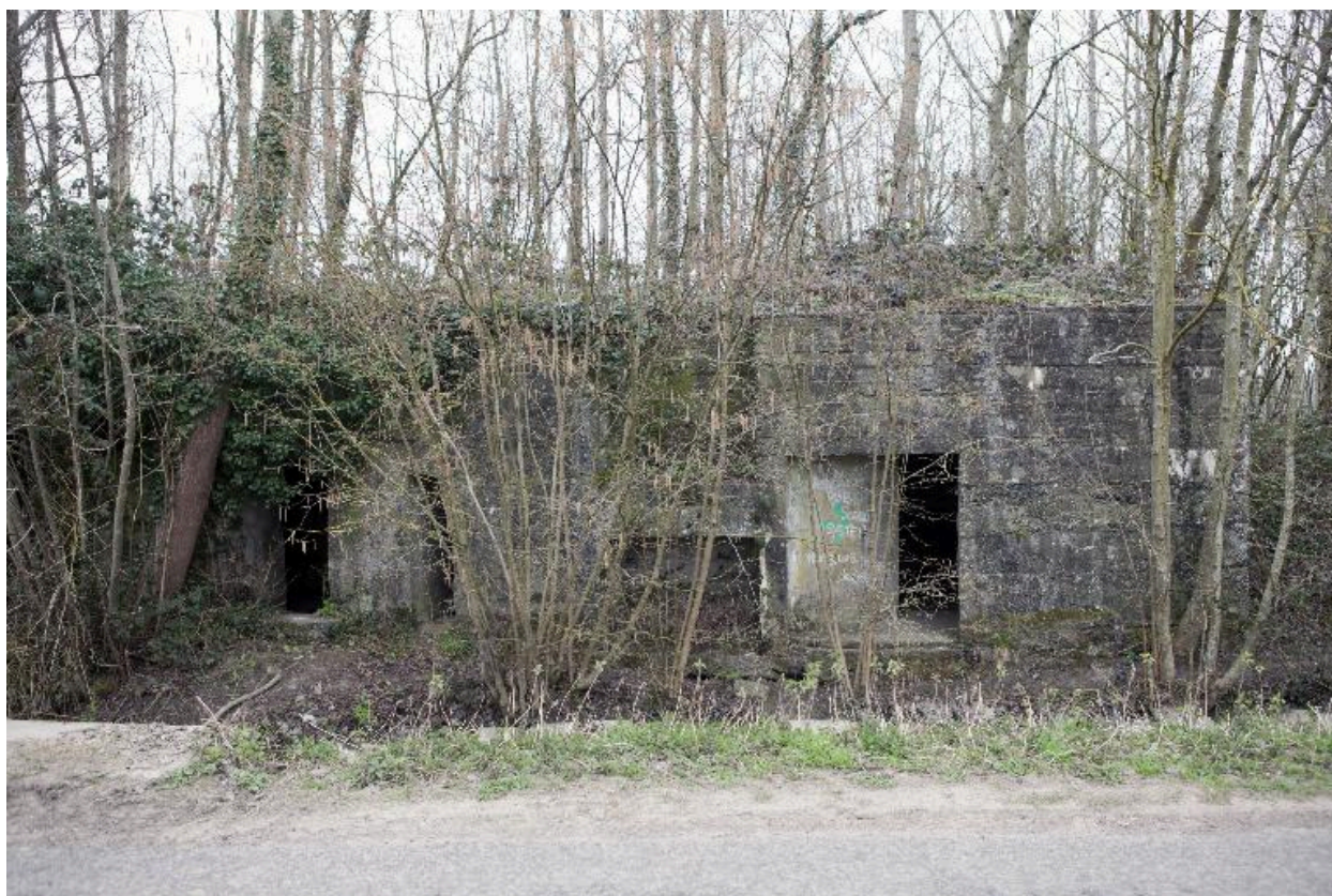
Elévation ouest : A gauche les deux entrées de la salle sud, à droite l'entrée de la salle nord. Au premier plan le ruisseau dit courant Brogniart