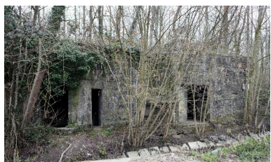
Elévation ouest : A gauche les deux entrées de la salle sud, à droite l'entrée de la salle nord. Au premier plan le ruisseau dit courant Brogniart