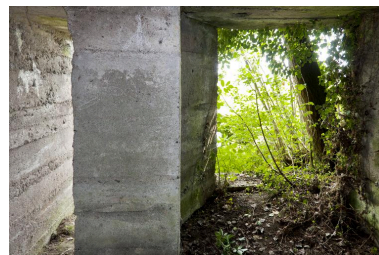
Salle sud, vers les deux entrées IVR31_20146203078NUCA