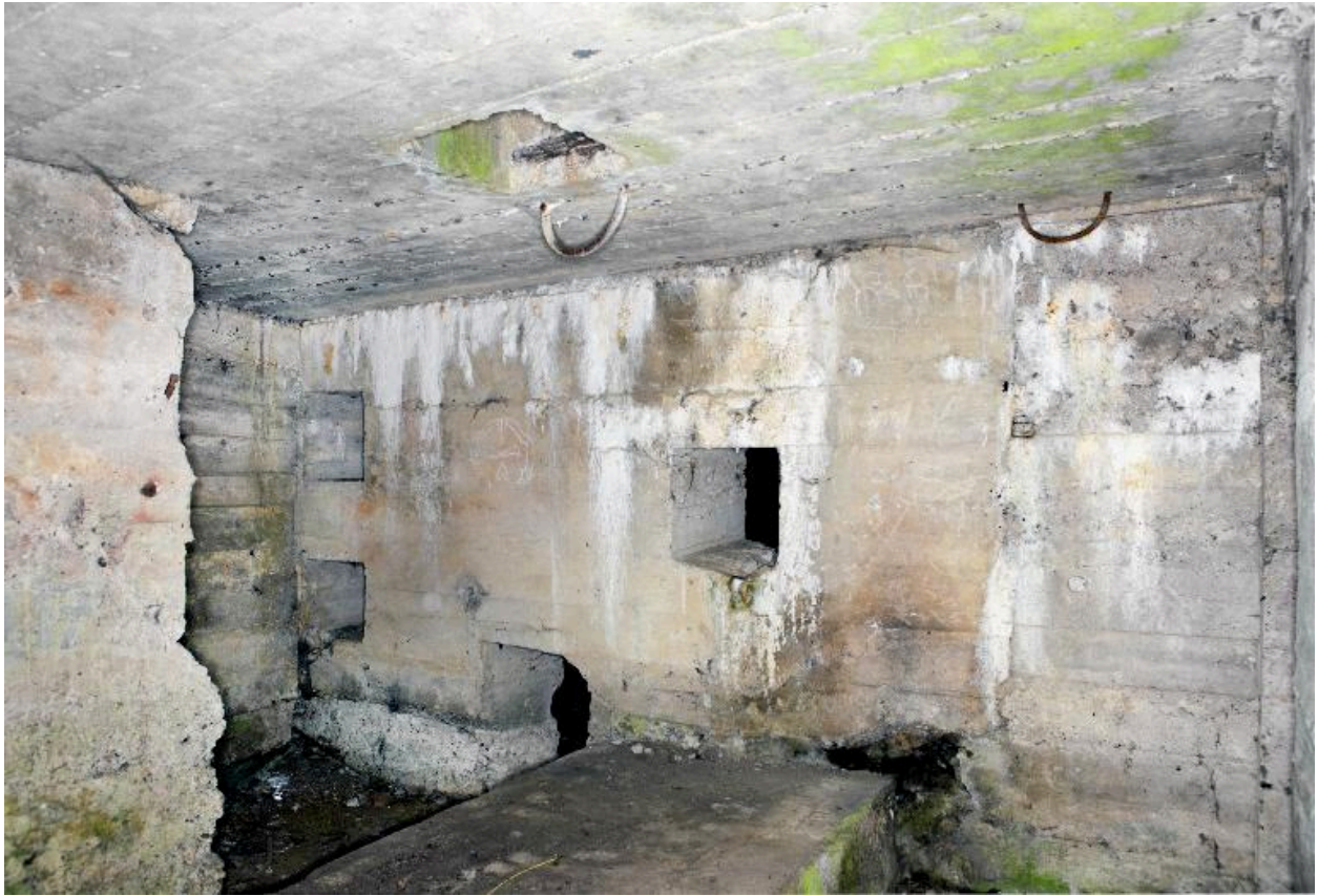
Salle sud : Massif bétonné du moteur diesel et quatre ouvertures débouchant salle nord (passage de tuyaux ?)