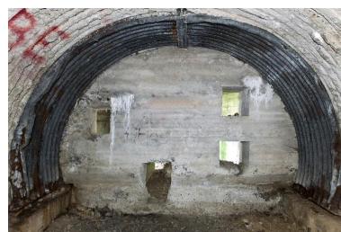
Depuis la salle nord : Orifices communicant avec la salle sud