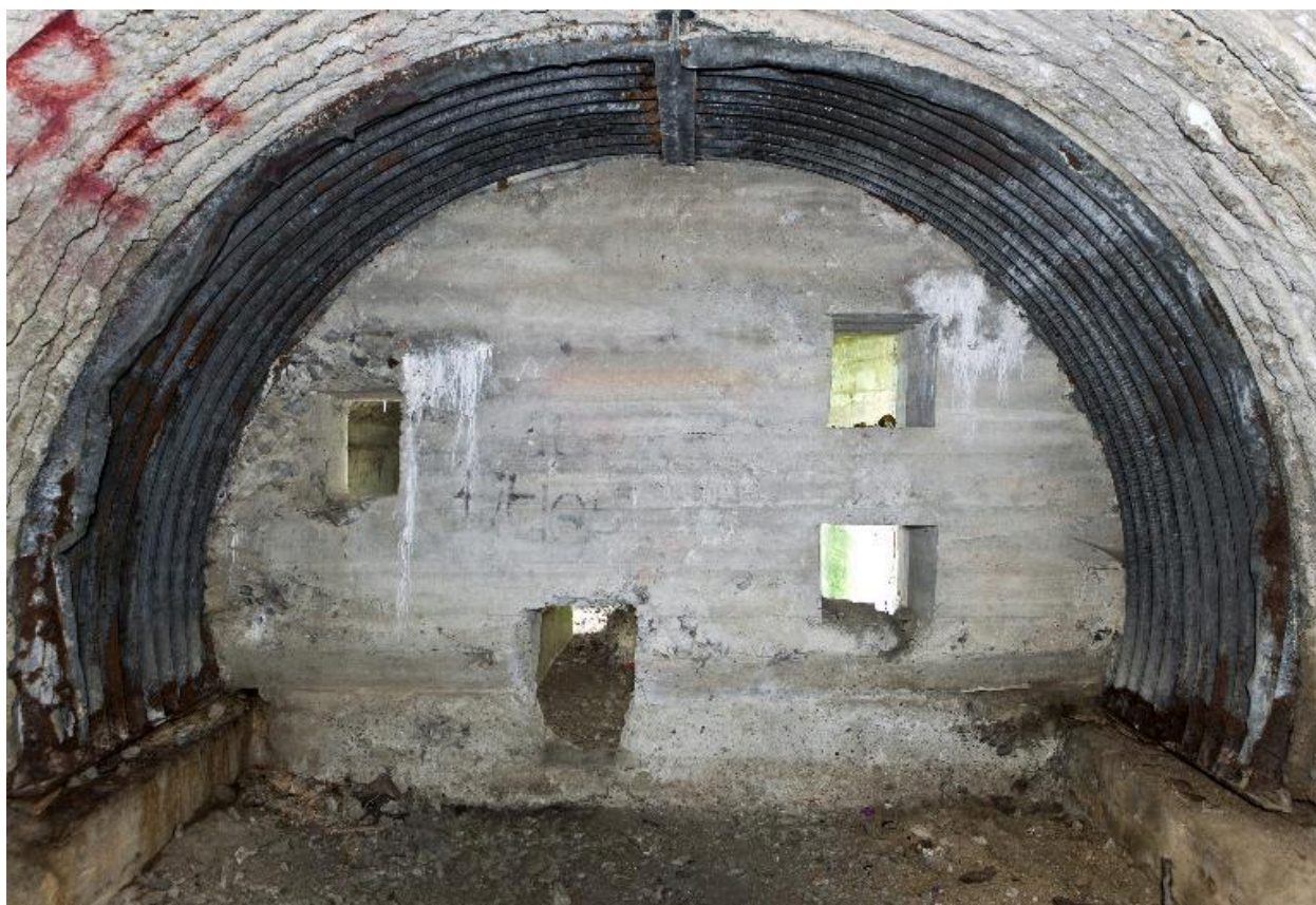
Depuis la salle nord : Orifices communicant avec la salle sud