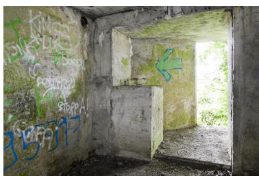
Salle nord. Vue vers l'entrée.