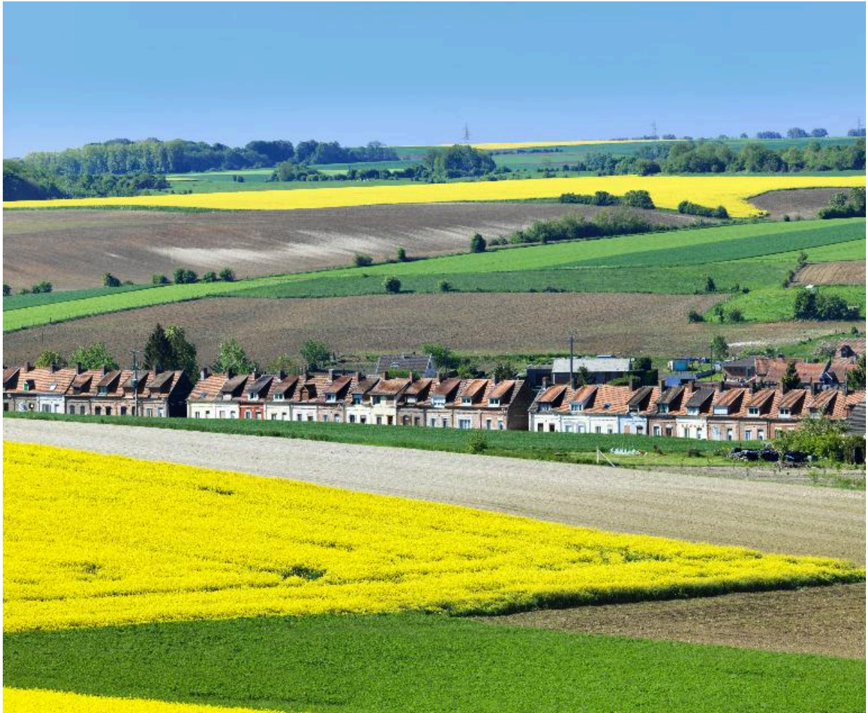
La cité des Avesnes, vue d'ensemble depuis le nord.