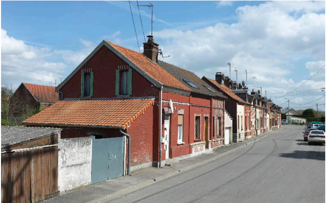
La cité des Avesnes, vue partielle.