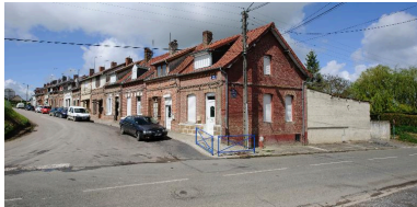
La cité Quenot, vue d'ensemble.