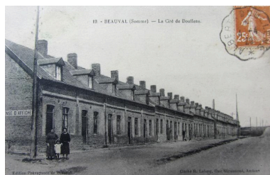
La cité de Doullens, vers 1910.