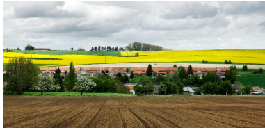
La cité des Avesnes, vue de situation.