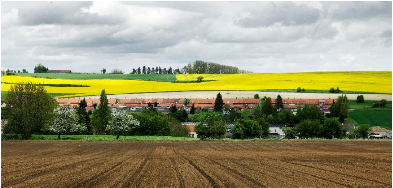
La cité des Avesnes, vue de situation.