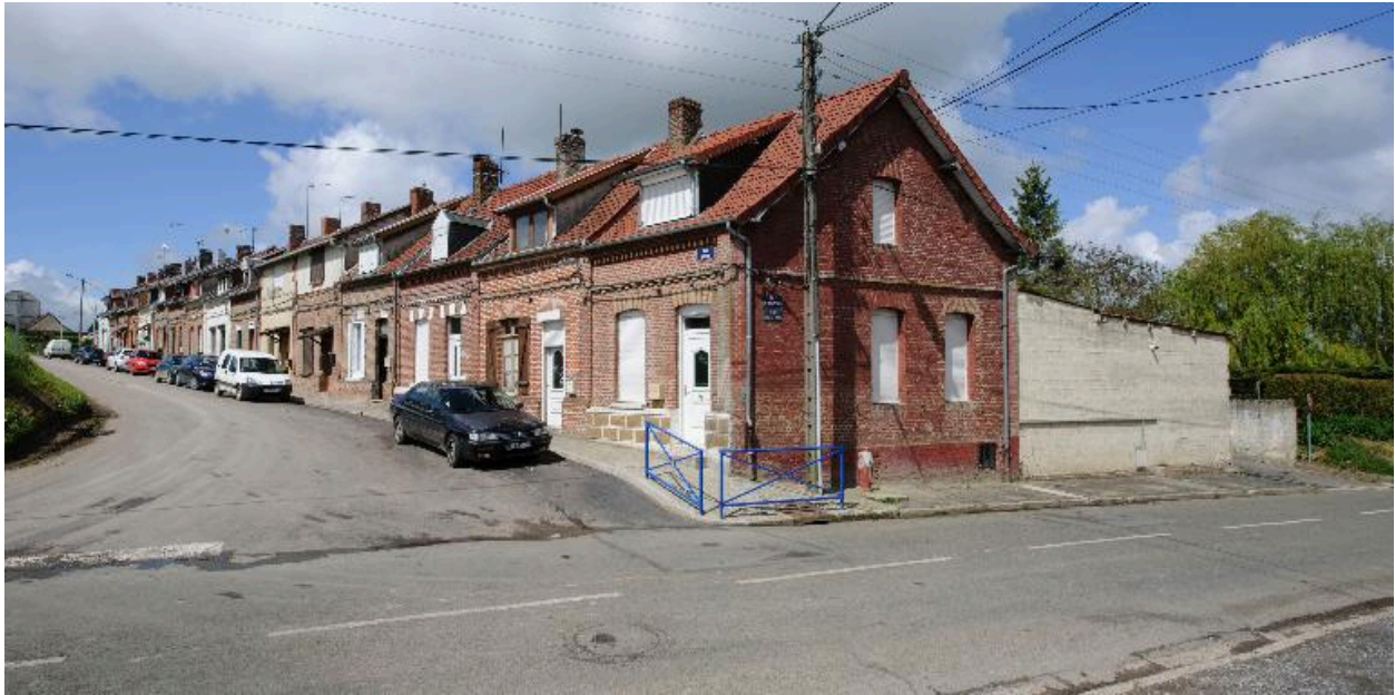
La cité Quenot, vue d'ensemble.