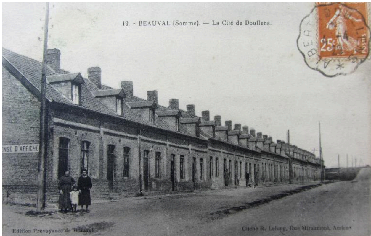
La cité de Doullens, vers 1910 (coll. part.).