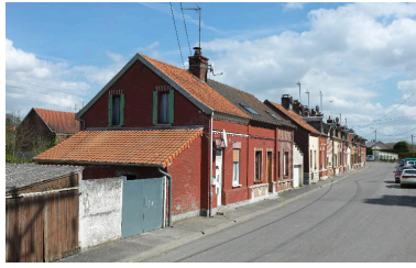
La cité des Avesnes, vue partielle.