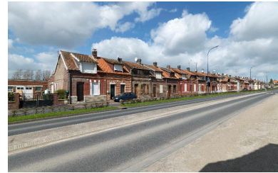
La cité de Doullens.