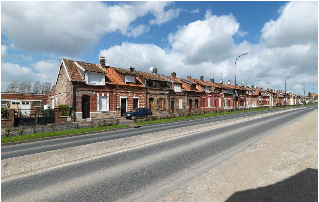
La cité de Doullens.