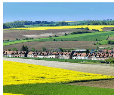
La cité des Avesnes, vue d'ensemble depuis le nord.